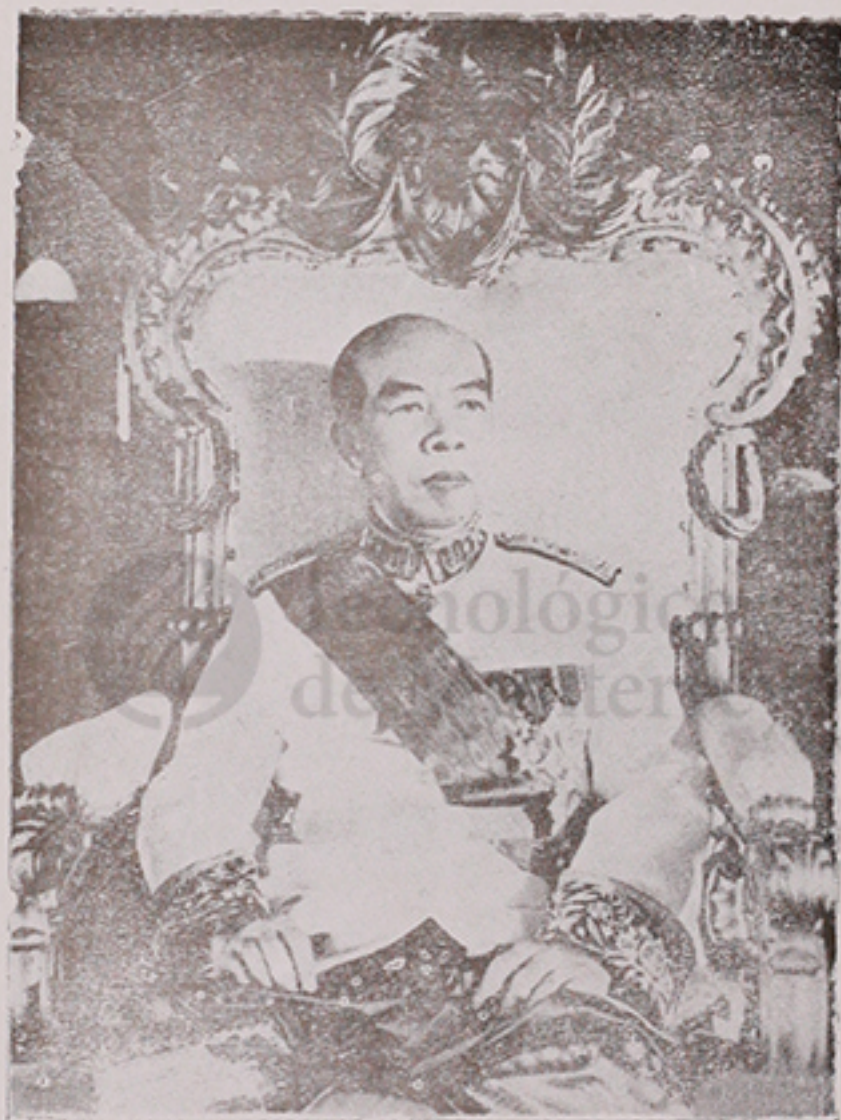
Sa Majesté NORODOM SURAMARIT Roi du Cambodge