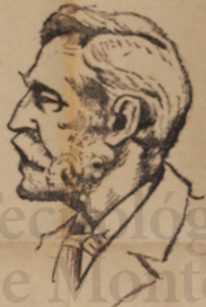
ALFREDO Bernardo Nobel, famoso ingeniero e inventor sueco, creador del premio que lleva su nombre