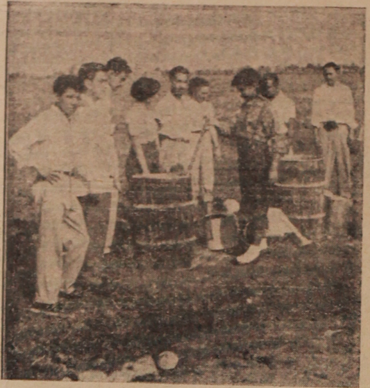
LOS ESTUDIANTES del tercer año de la carrera químico industrial, en el campo experimental del ingenio de El Mante. realizan experimentos sobre la acidificación del suelo, durante la visita que efectuaron la semana pasada.