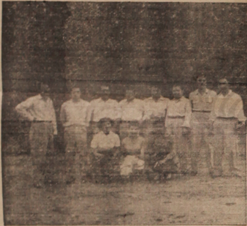
GRAFICA TOMADA a los visitantes estudiantiles, frente a una de las plantas del ingenio "Xicoténcatl", durante su reciente viaje de estudios.

Durante toda la mañana del día 2 los alumnos mencionados, acompañados por su maestros y el subgerente de la industria, visitaron los diferentes departamentos del ingenio, observando las técnicas empleadas por la institución para la fabricación del alcohol. Durante la tarde, los visitantes se trasladaron al ingenio "Xicoténcatl", de la compañía azucarera del Río Guayalejo, donde los alumnos hicieron prácticas de laboratorio gracias a la amabilidad de los encargados de esta institución, señores Chenet e ingeniero Tavarez. El día 3 visitaron el campo experimental del Ingenio de El Mante, donde fueron atendidos por el ingeniero Guillermo Núñez. Allí observaron los diversos experimentos que se realizan para la acidificación del suelo y tomaron importantes datos sobre los sistemas de análisis de suelo que se practican en esa institución. Por la tarde se inició el regreso de los alumnos, quienes se mostraron sumamente complacidos de las prácticas y observaciones hechas durante este viaje que anualmente realizan los alumnos de la Facultad de Ciencias Químicas, para complementar los estudios teóricos que sobre estos temas llevan al cabo en sus aulas.