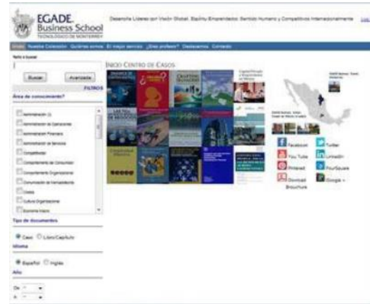
Figura 2. Plataforma de CREA.

Se desarrollaron criterios de catalogación: disciplina, tipo de material, idioma, geografía (ver Figura 2).