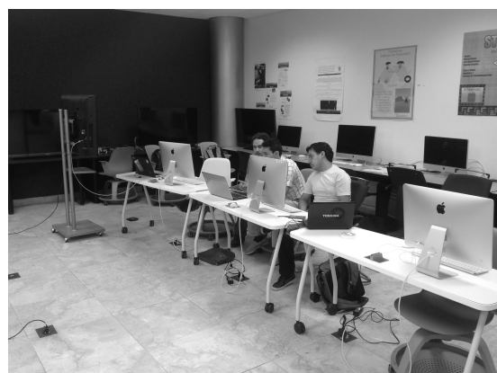
Figura 3 Espacio de aprendizaje