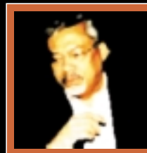
T R E S T R I S T E S T I G R E S

El elenco del filme –que cuenta con una continuación, veinte años después, sin la participación de Belushi por su trágica muerte en la primera mitad de la década de los años ochenta– goza de la participación de reconocidos actores, modelos y blueseros de todos los tiempos: Carrie Fisher, Twiggy, Cab Calloway, Ray Charles, Aretha Franklin, Henry Gibson, James Brown y toda la Blues Brothers Band . •