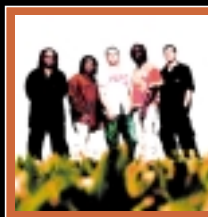
D A V E M A T T H E W S B A N D