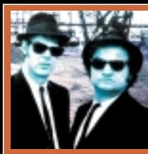
THE BLUES BROTHERS

Ese nítido personaje, Dave Matthews, el que es capaz de todo, incluso de buscar en su agenda el plan C y montarse a la carga tras de otra canción, otra resonancia, otro sueño, otra realidad. Esto es lo que me permite recomendar la obra de este señor y músico. •