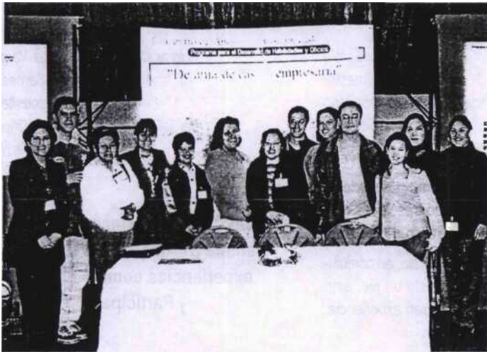
Señoras participantes del programa TyHO de García NL y los alumnos del Tec de Monterrey que las apoyan, durante la exhibición de sus productos

El pasado 1 y 2 de marzo se llevó a cabo en el Foro Pro cultura el II Encuentro de la Mujer: "Todas