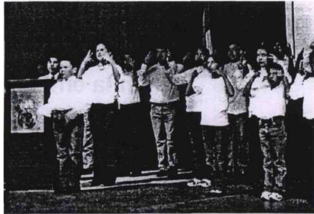
Niños con capacidades especiales entonaron el Himno Nacional Mexicano con lenguaje para sordomudos