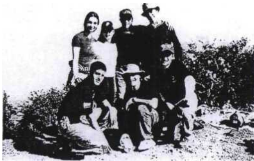
Participantes del curso en la cima del Cerro de las Mitras

Una experiencia de liderazgo personal y confrontación de límites a través de retos, es lo