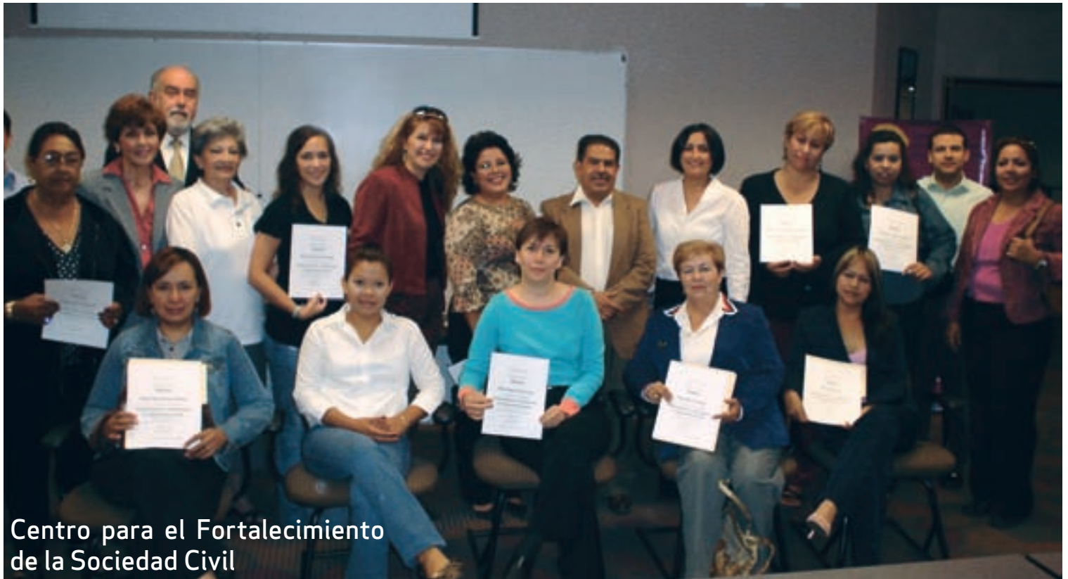
Centro para el Fortalecimiento de la Sociedad Civil