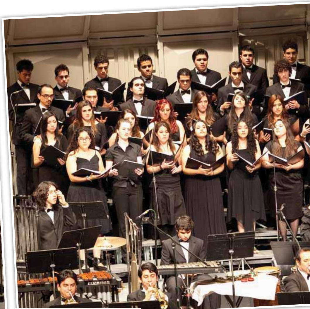
El Coro de la comunidad participó en el espectáculo