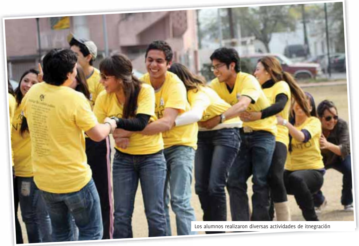
Los alumnos realizaron diversas actividades de integración

A los asistentes se les entregó una playera amarilla con la frase "soy conta", y así se promovió el sentido de pertenencia y el orgullo de estudiar esta carrera.