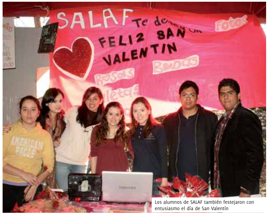
Los alumnos de SALAF también festejaron con entusiasmo el día de San Valentín