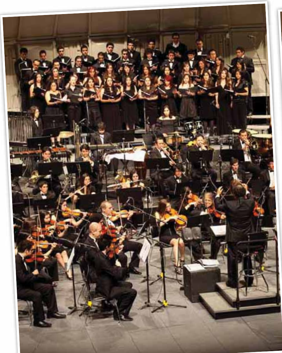
La Orquesta Sinfónica Juvenil interpretó música mexicana