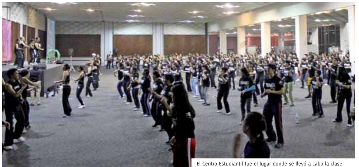
El Centro Estudiantil fue el lugar donde se llevó a cabo la clase