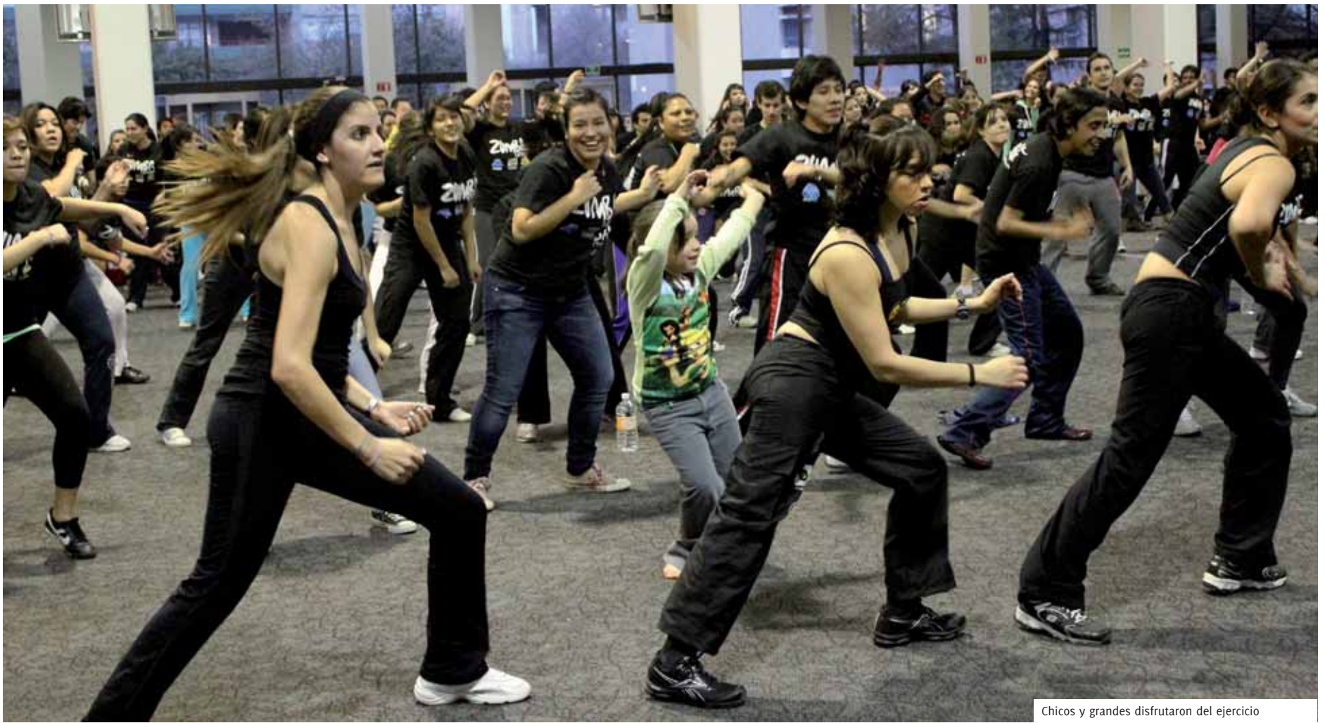
Chicos y grandes disfrutaron del ejercicio