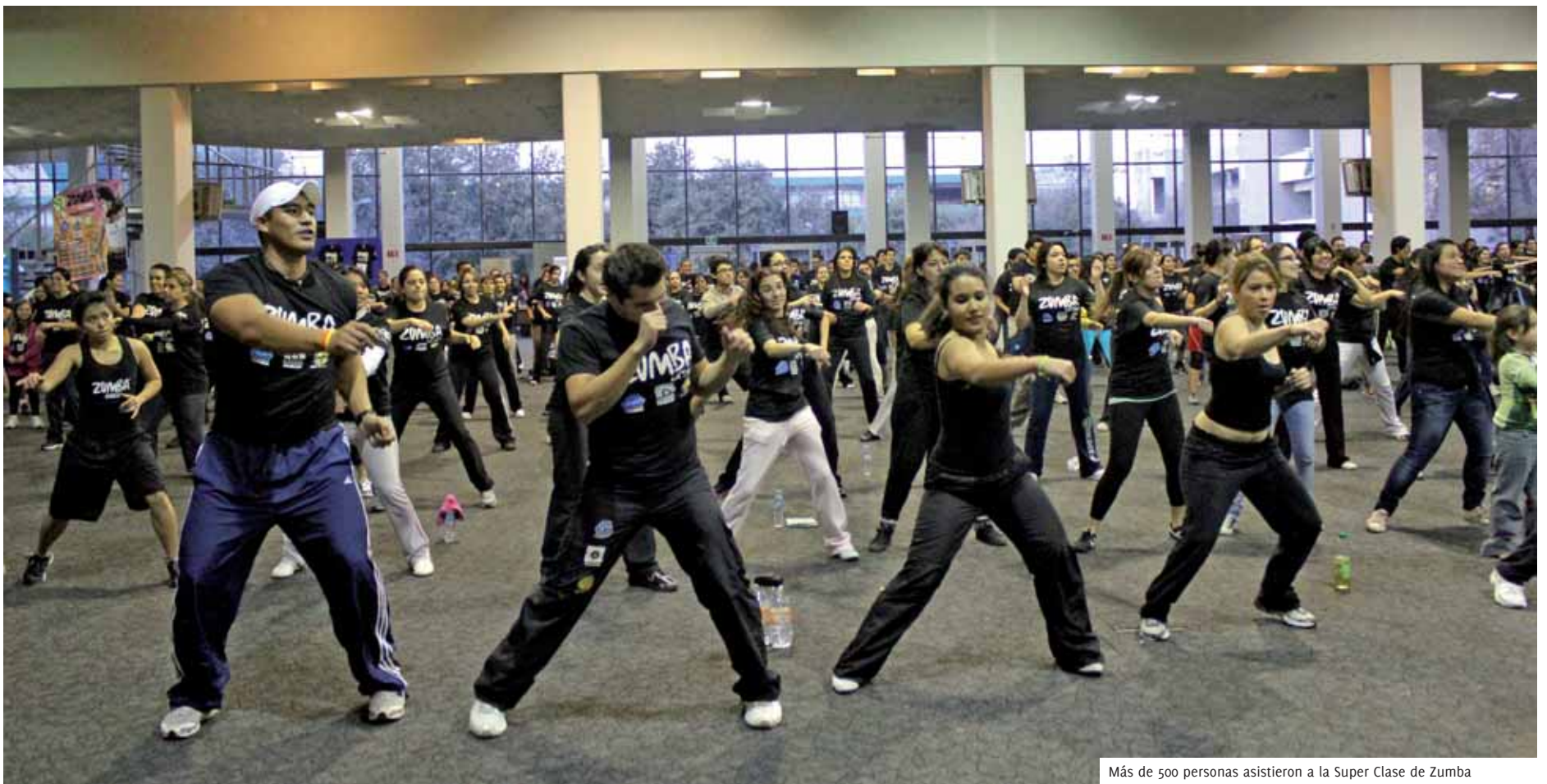
Más de 500 personas asistieron a la Super Clase de Zumba