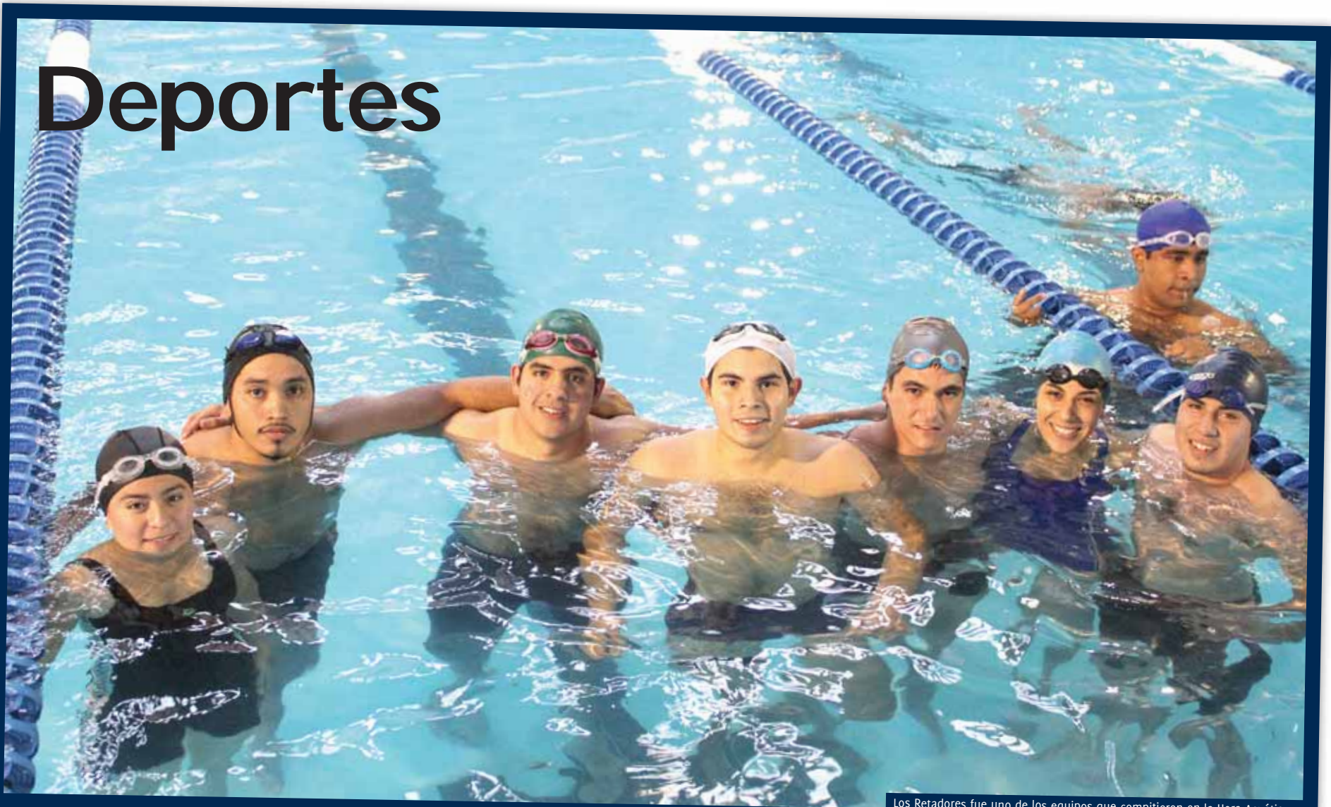
Los Retadores fue uno de los equipos que compitieron en la Hora Acuática