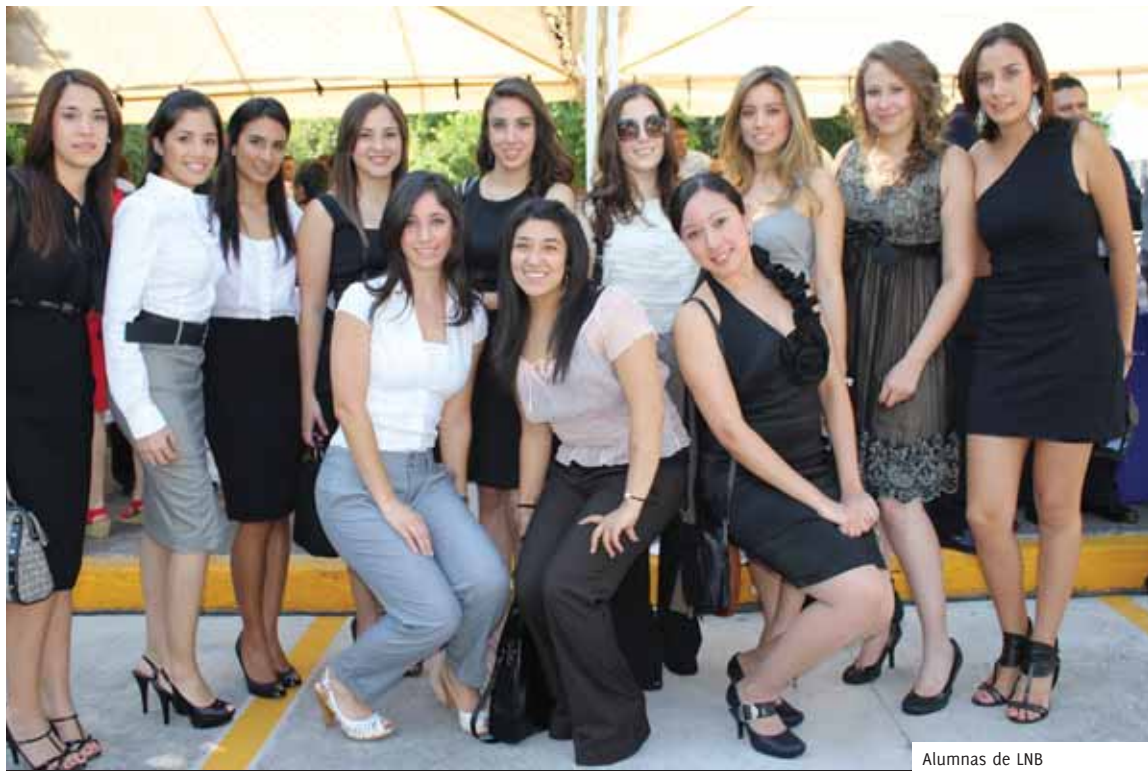
Alumnas de LNB