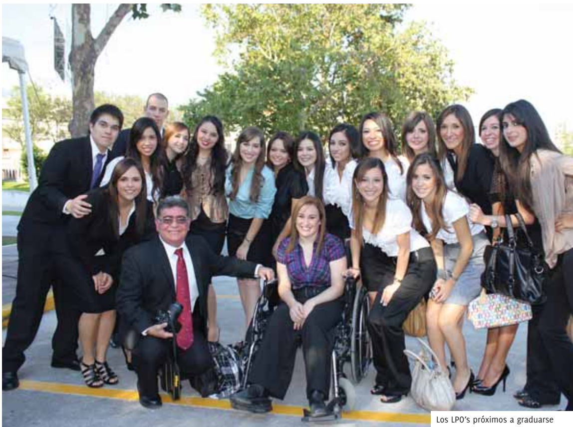
Los LPO's próximos a graduarse