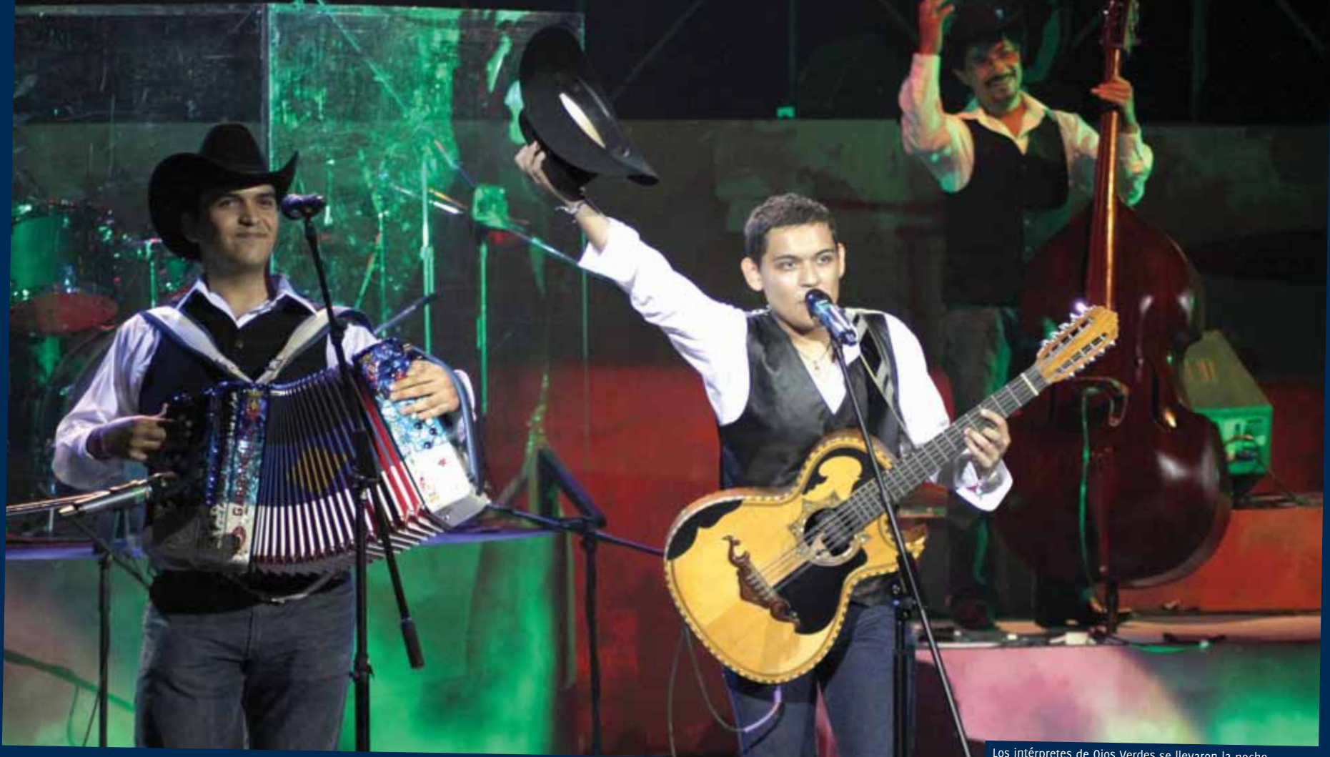
Los intérpretes de Ojos Verdes se llevaron la noche