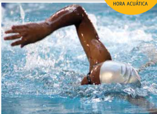
Los alumnos nadaron con intensidad

57 ALUMNOS ESTUVIERON EN LA HORA ACUÁTICA