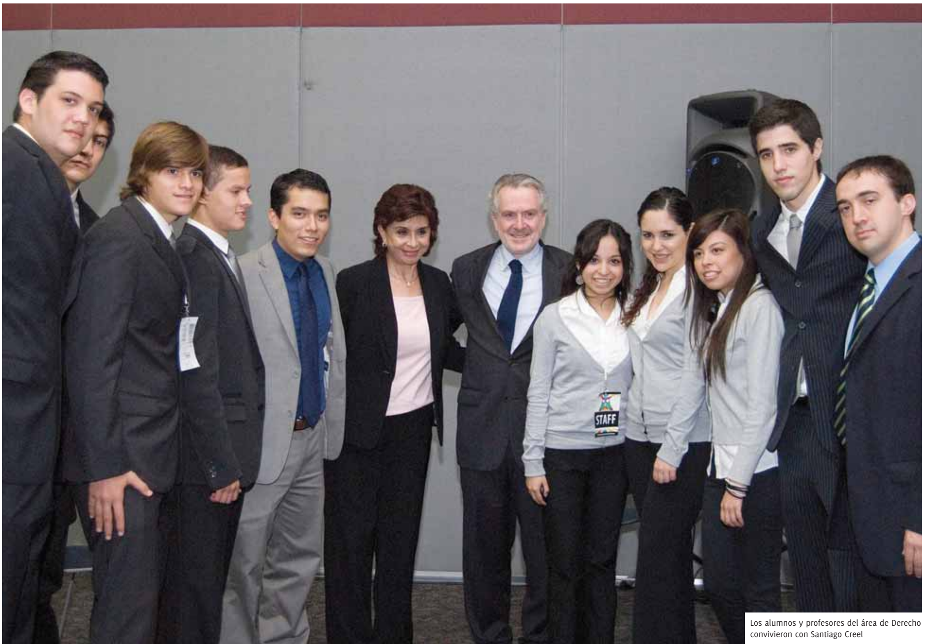
Los alumnos y profesores del área de Derecho convivieron con Santiago Creel