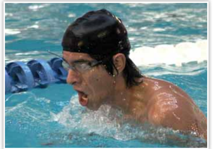
Los competidores realizaron su mayor esfuerzo

Los ganadores fueron los "Tritanes" con 4,045 metros de nado, en segundo lugar terminaron los "Retadores", acumulando 3,500 metros, en tanto que los "Magníficos", sumaron 3,325 metros para culminar en tercer sitio.