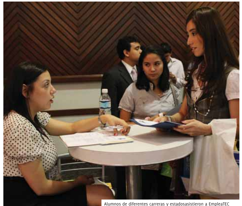
Alumnos de diferentes carreras y estados asistieron a EmpleaTEC