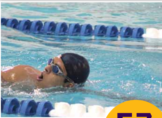
Un total de seis equipos participaron

57 ALUMNOS ESTUVIERON EN LA HORA ACUÁTICA