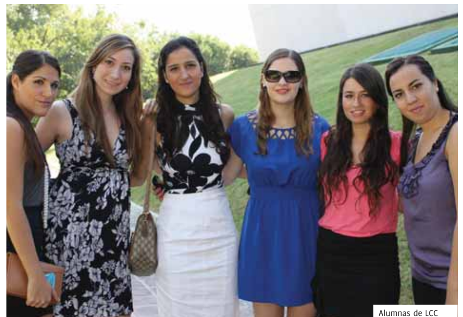
Alumnas de LCC