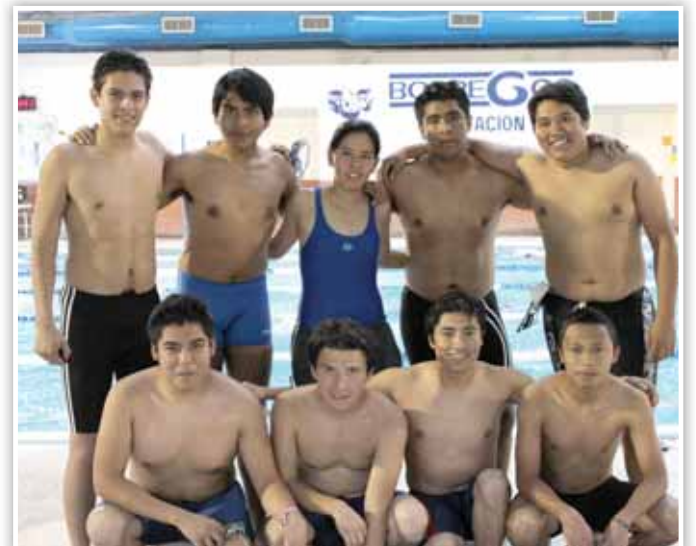
Alumnos del Campus Monterrey provenientes de Oaxaca que participaron en la competencia