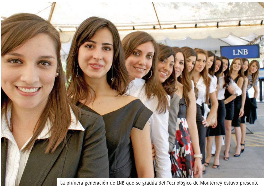
La primera generación de LNB que se gradúa del Tecnológico de Monterrey estuvo presente