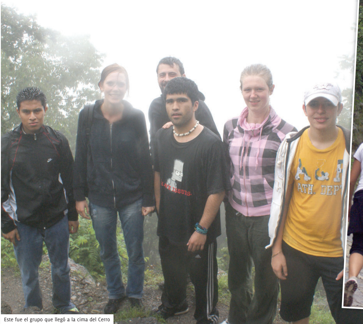
Este fue el grupo que llegó a la cima del Cerro