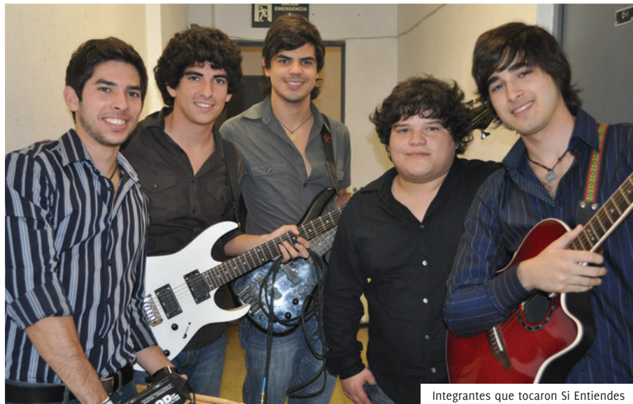
Integrantes que tocaron Si Entiendes

Así, los participantes disfrutaron de la música, subieron al escenario y recibieron el aplauso y la algarabía del público.