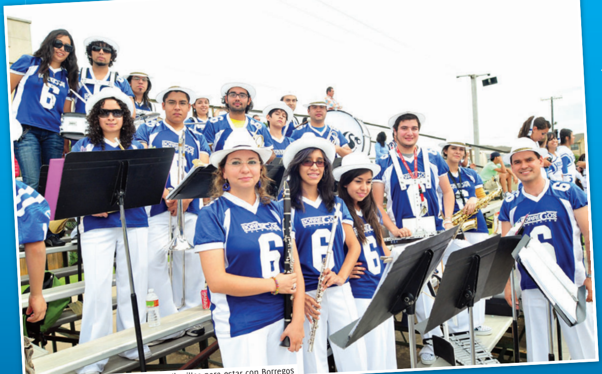
La Banda Sonido Azul viajó más de mil millas para estar con Borregos