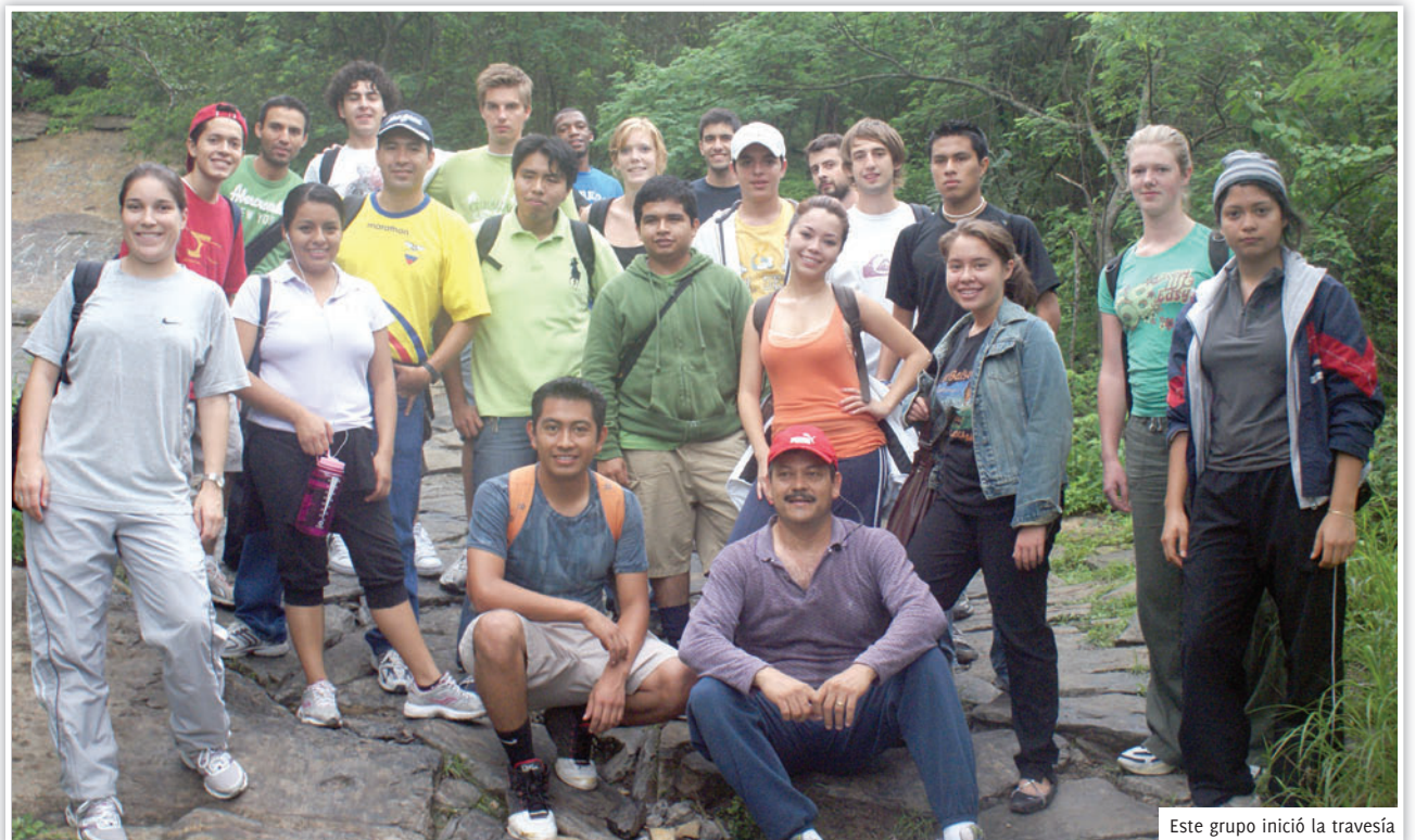
Este grupo inició la travesía