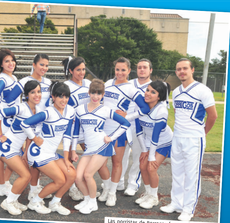
Las porristas de Borregos fueron al encuentro