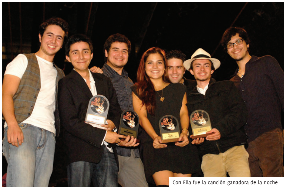
Con Ella fue la canción ganadora de la noche