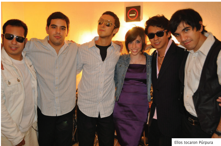
Ellos tocaron Púrpura