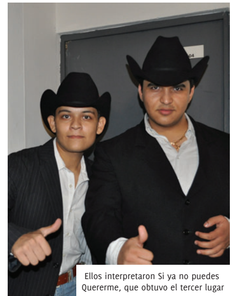
Ellos interpretaron Si ya no puedes Quererme, que obtuvo el tercer lugar