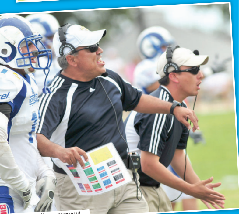
ca, el juego se vivió con intensidad