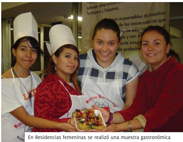
En Residencias femeninas se realizó una muestra gastronómica