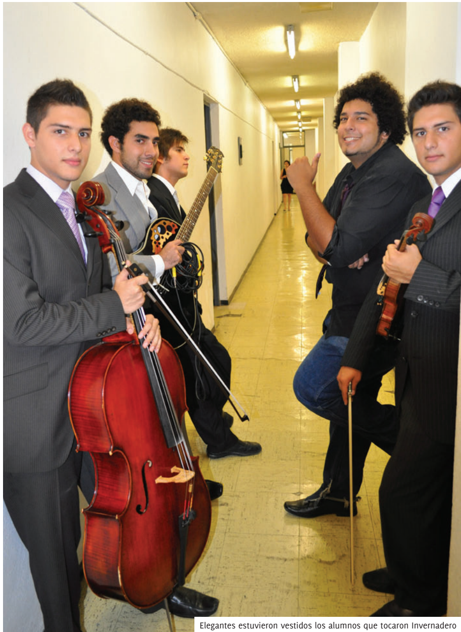
Elegantes estuvieron vestidos los alumnos que tocaron Invernadero