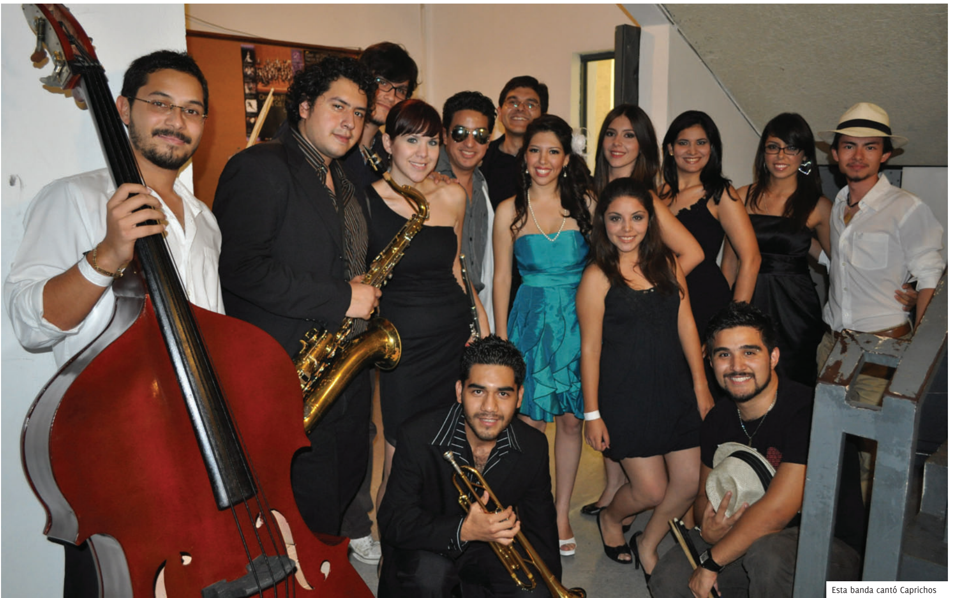
Esta banda cantó Caprichos