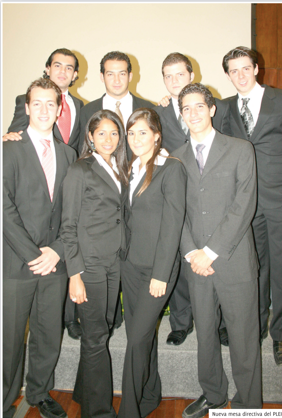
Nueva mesa directiva del PLEI