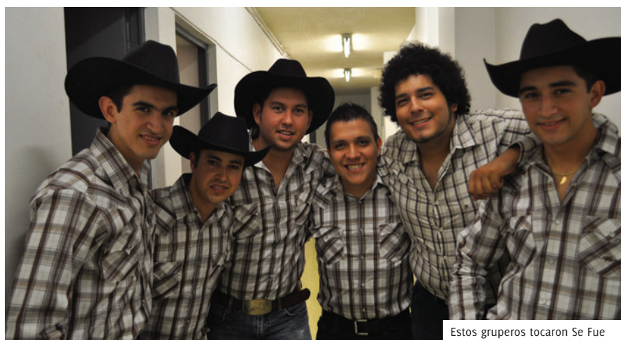
Estos gruperos tocaron Se Fue