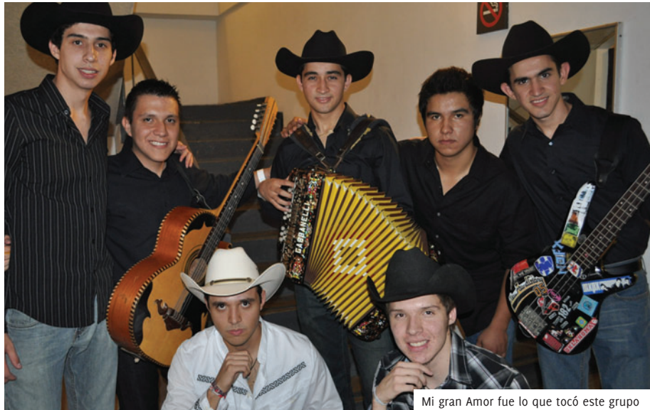
Mi gran Amor fue lo que tocó este grupo