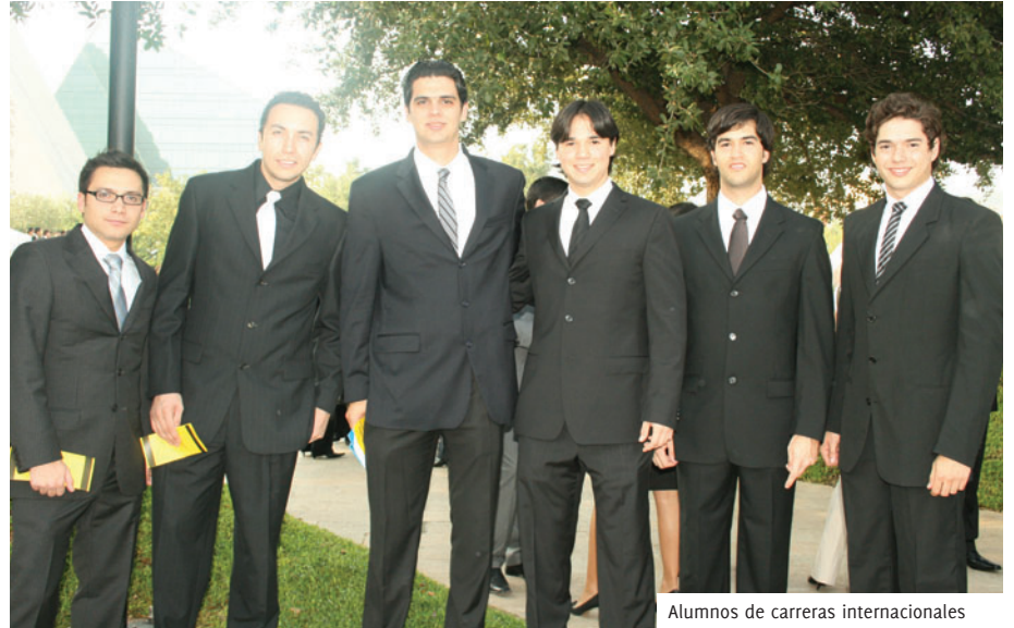
Alumnos de carreras internacionales