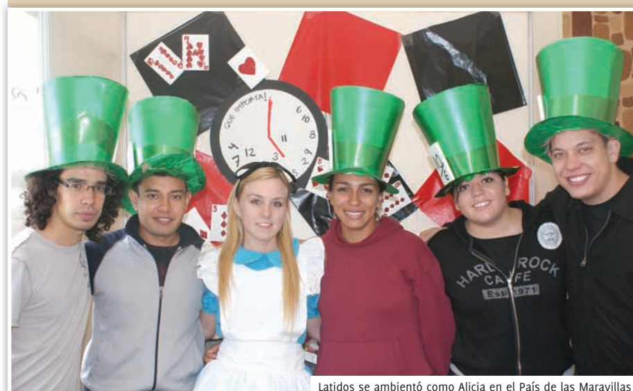
Latidos se ambientó como Alicia en el País de las Maravillas

En AGE se encuentran cerca de 80 grupos estudiantiles, que dan muestra de la diversidad que existe en el Campus Monterrey para los alumnos que quieran participar en actividades co curriculares.