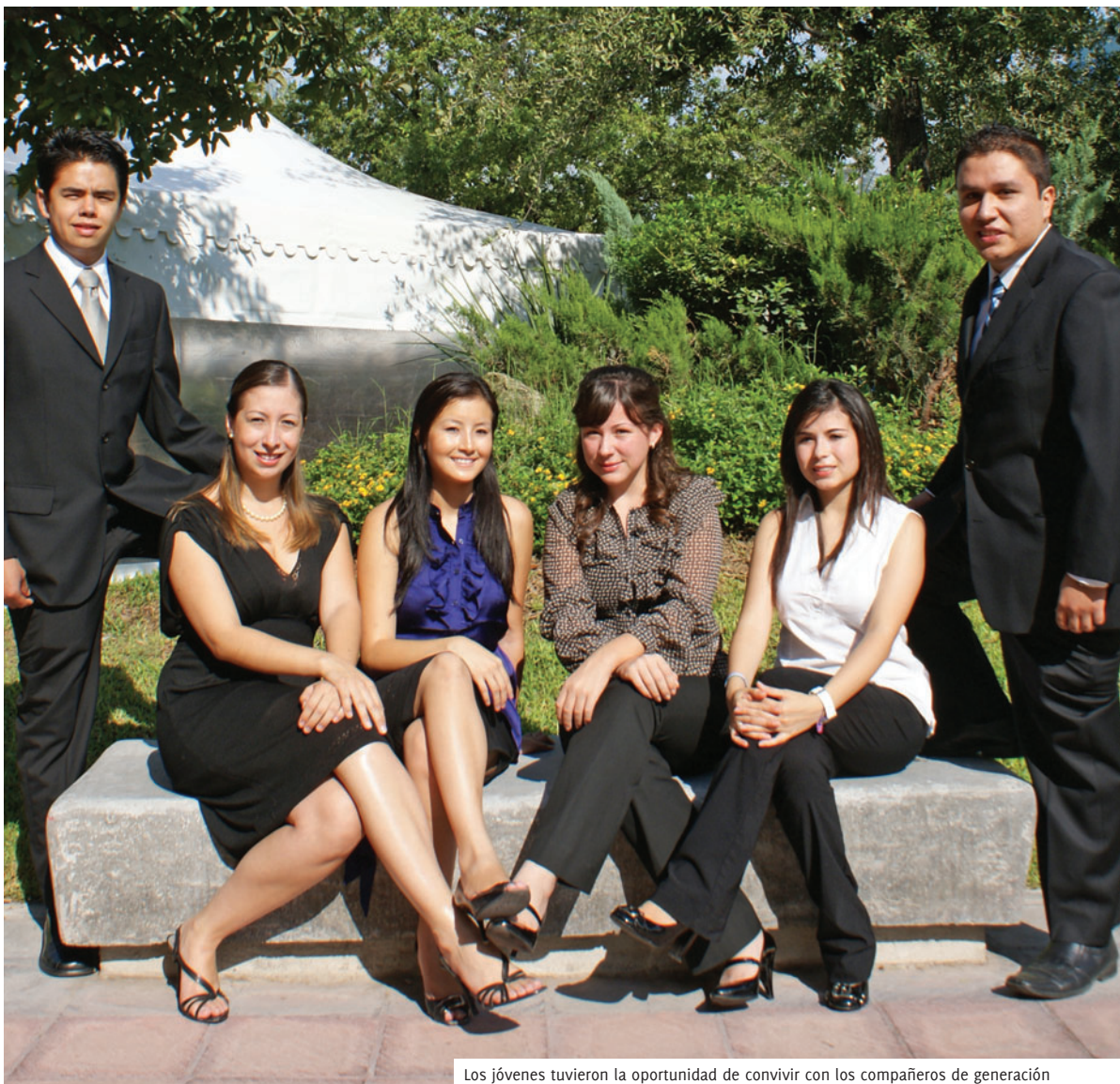
Los jóvenes tuvieron la oportunidad de convivir con los compañeros de generación