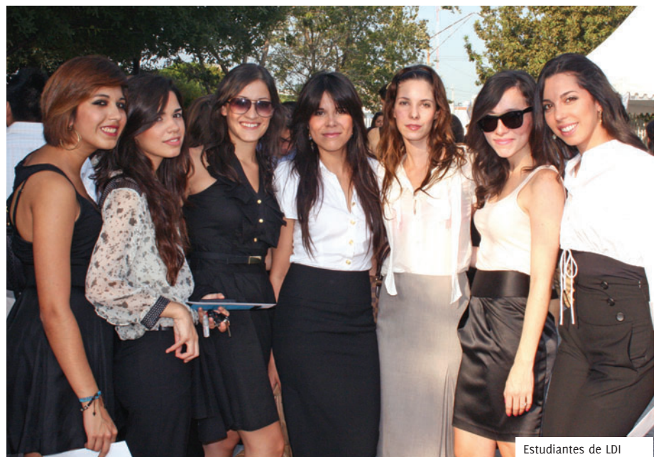
Estudiantes de LDI