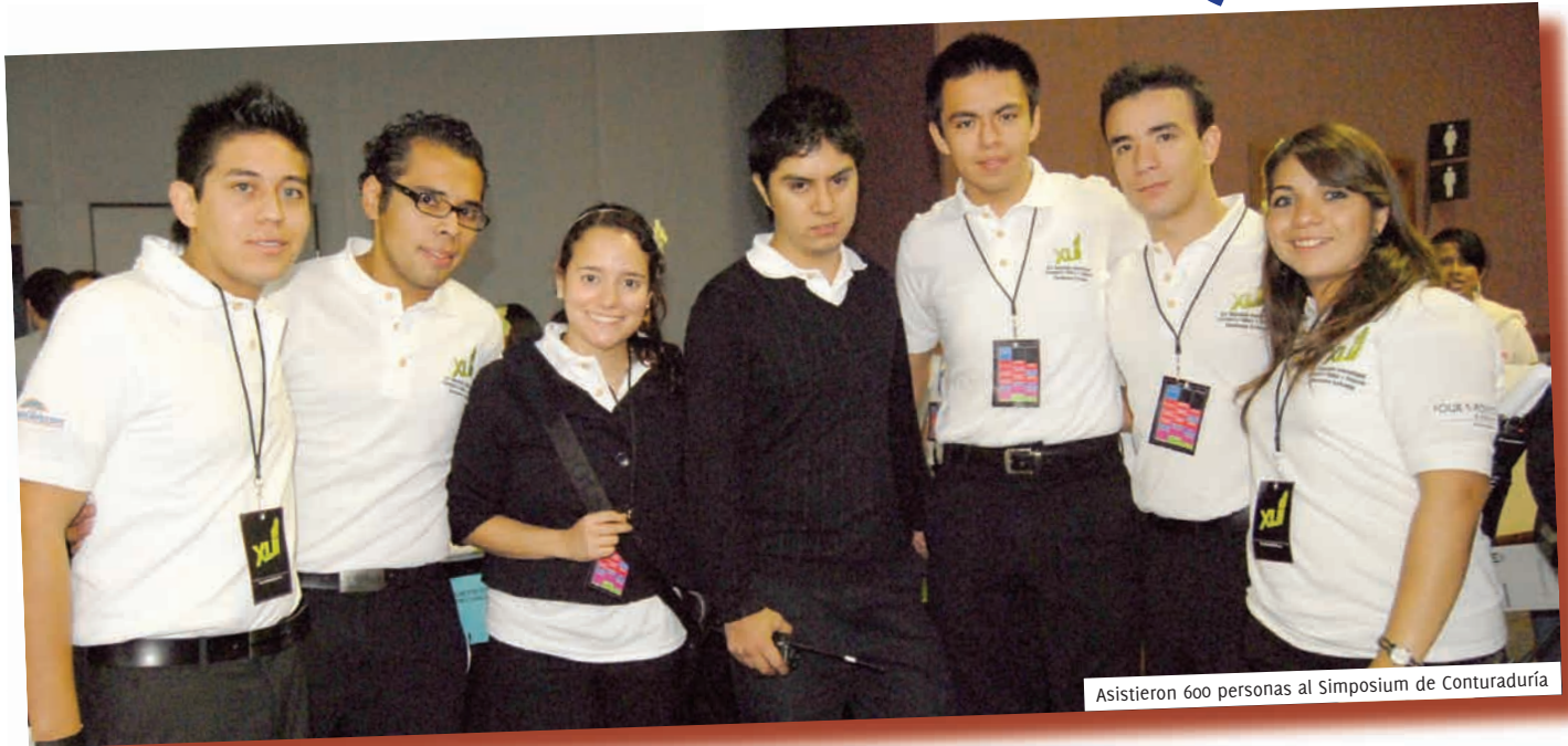
Asistieron 600 personas al Simposium de Contaduría

Éstas fueron Daltile, Cervezeria Cuahatemoc Moctezuma, El Financiero y Deloitte.