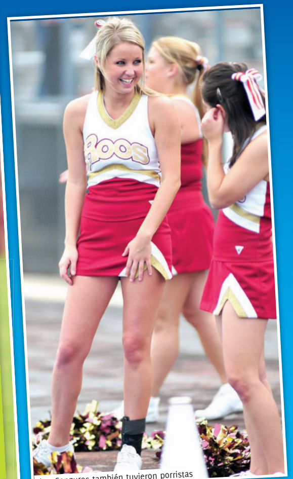
Los Canguros también tuvieron porristas