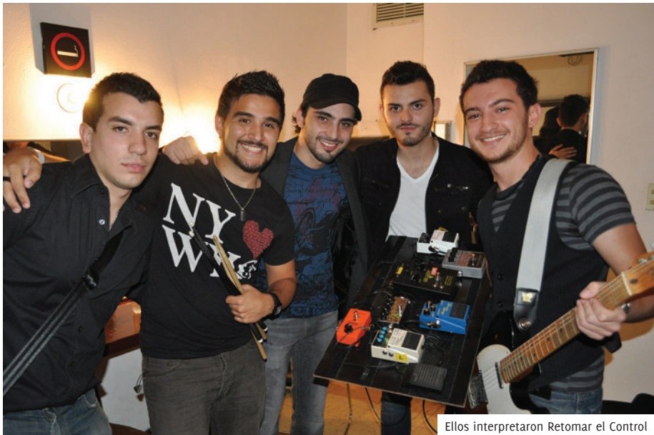
Ellos interpretaron Retomar el Control