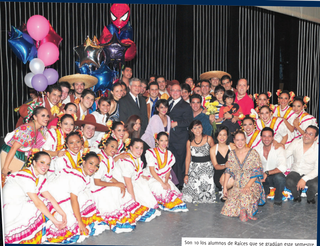
Son 10 los alumnos de Raíces que se gradúan este semestre