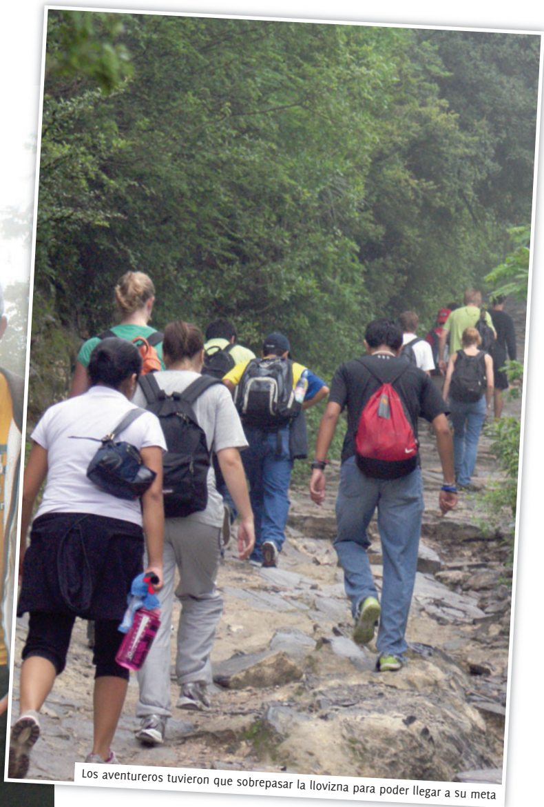
Los aventureros tuvieron que sobrepasar la llovizna para poder llegar a su meta