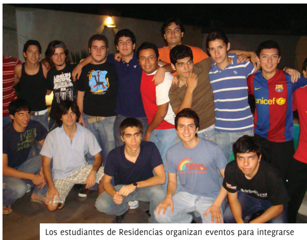
Los estudiantes de Residencias organizan eventos para integrarse