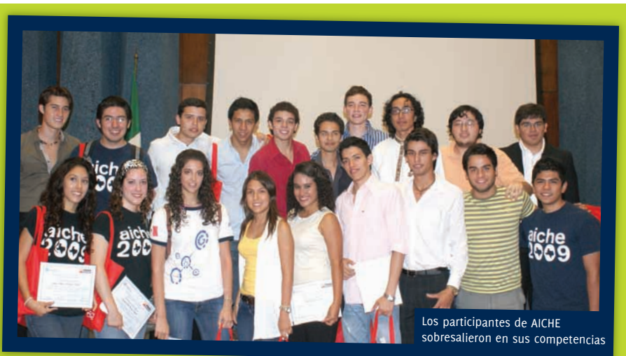
Los participantes de AICHE sobresalieron en sus competencias