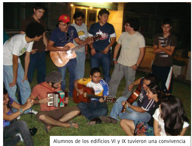
Alumnos de los edificios VI y IX tuvieron una convivencia

A lumnos que habitan en las Residencias del Campus Monterrey han tenido diversos eventos en las últimas semanas, he aquí algunos en lo que han logrado convivir con sus compañeros.