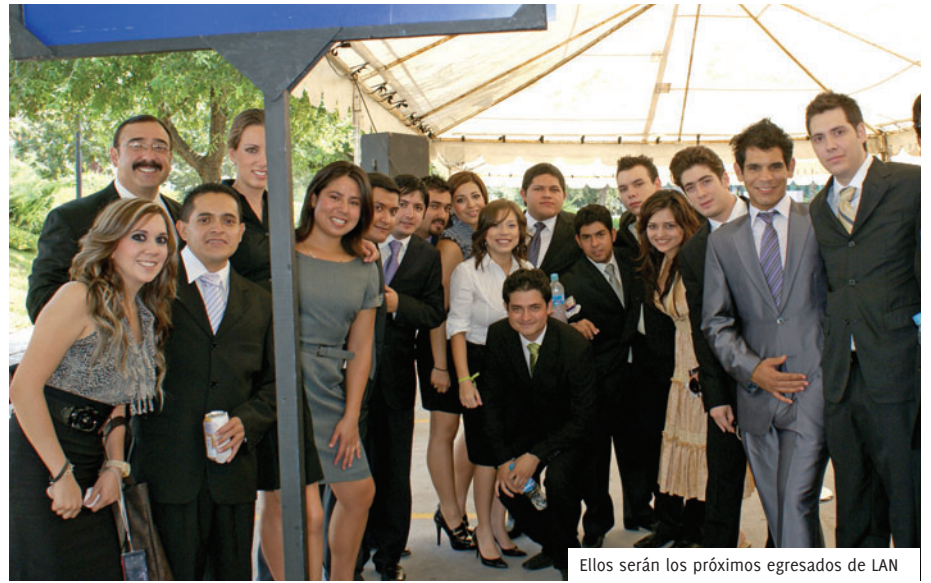
Ellos serán los próximos egresados de LAN