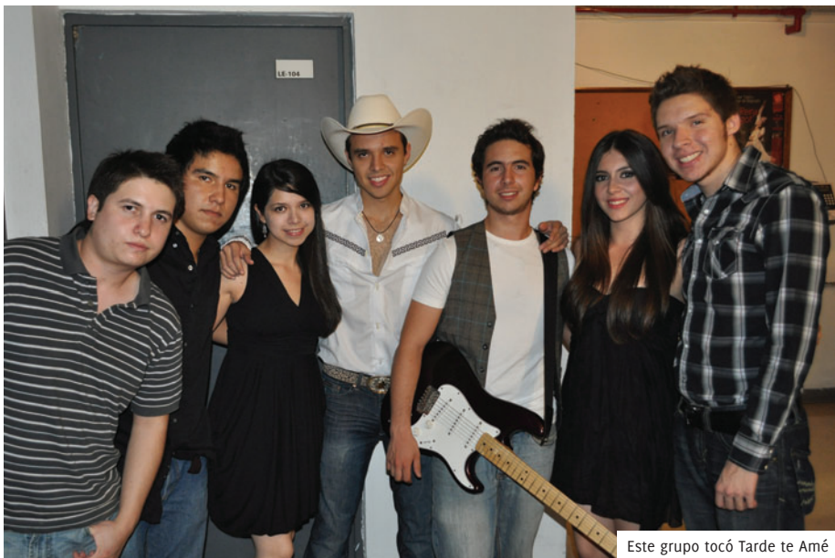
Este grupo tocó Tarde te Amé