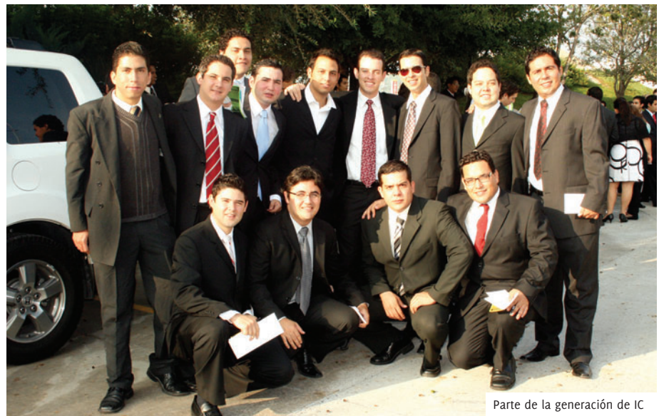
Parte de la generación de IC