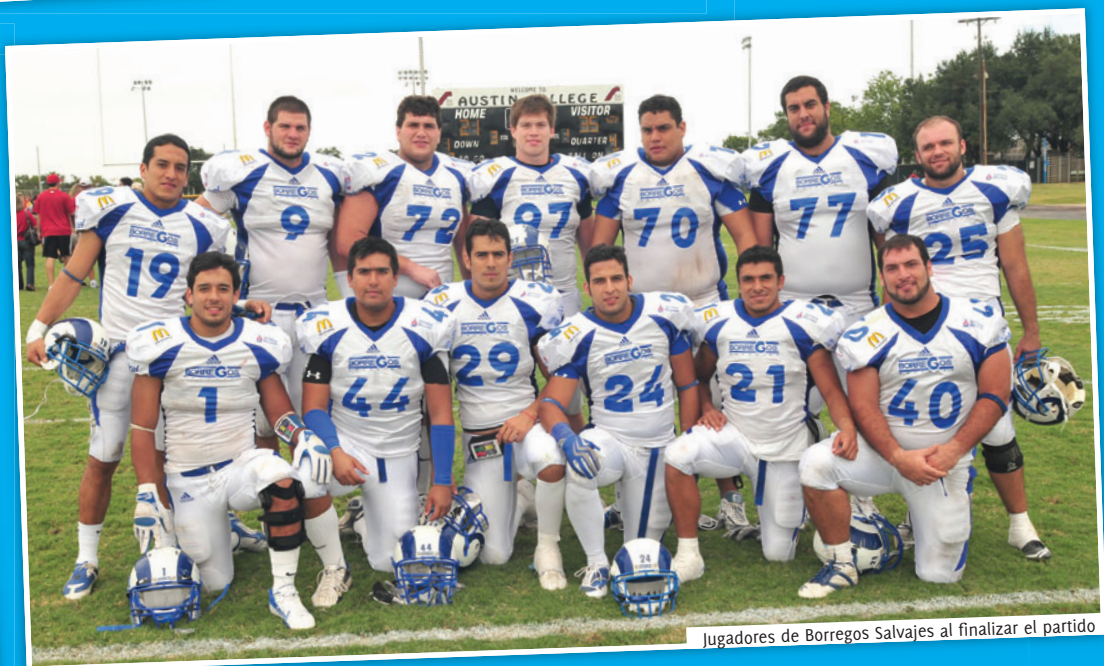
Jugadores de Borregos Salvajes al finalizar el partido