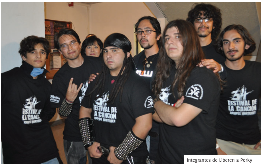
Integrantes de Liberen a Porky