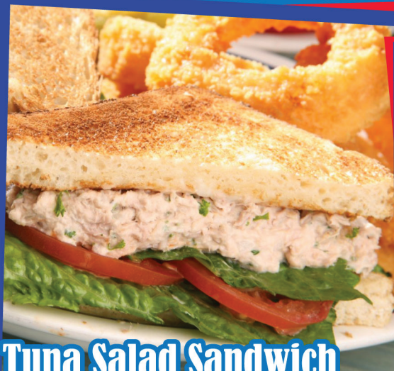
Tuna Salad Sandwich