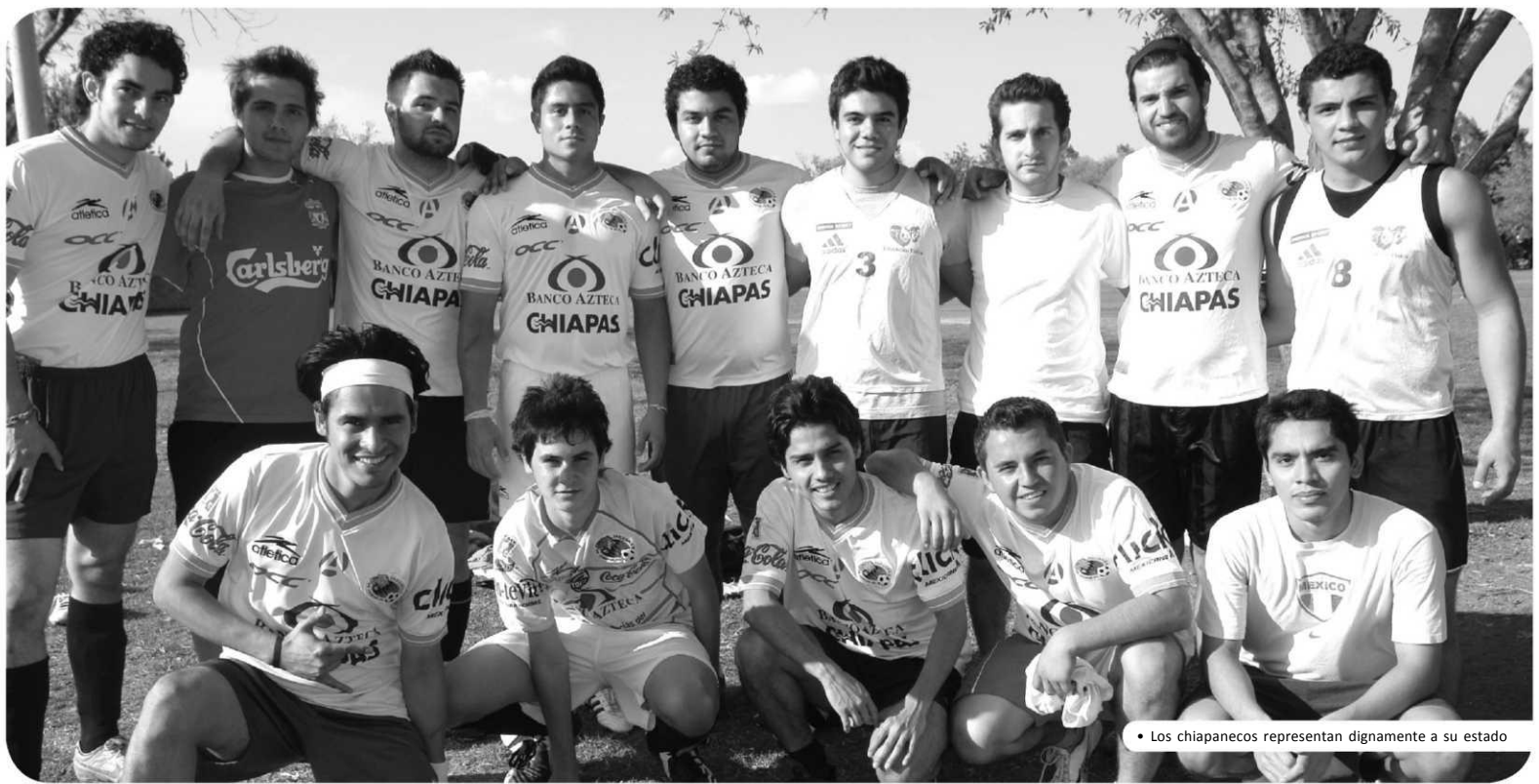
• Los chiapanecos representan dignamente a su estado