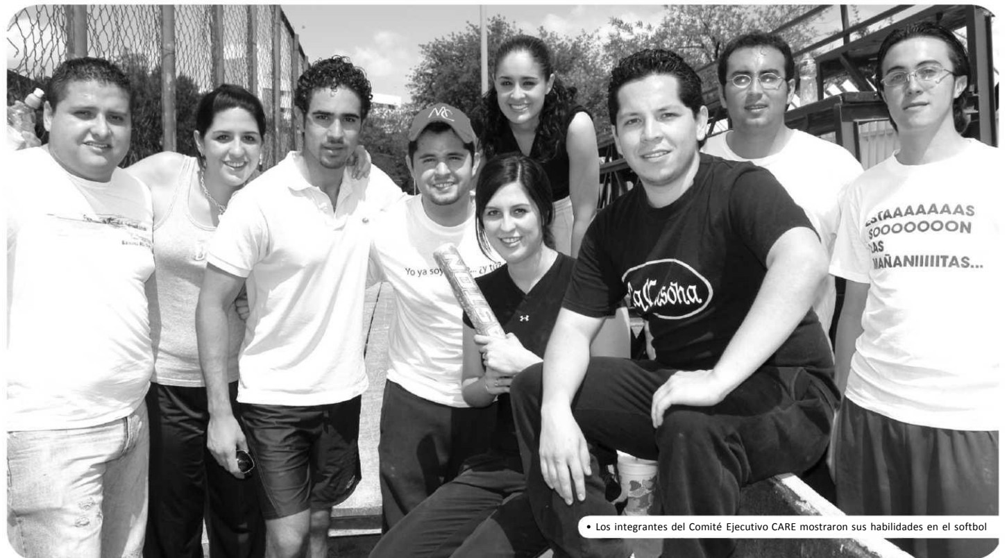
• Los integrantes del Comité Ejecutivo CARE mostraron sus habilidades en el softbol