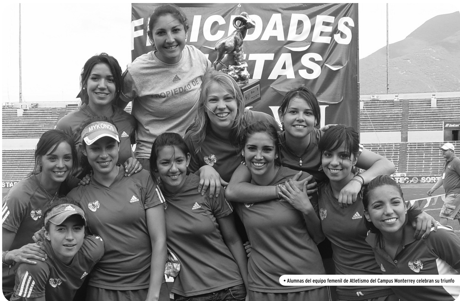
• Alumnas del equipo femenil de Atletismo del Campus Monterrey celebran su triunfo

Con esto, los Borregos de Atletismo del Campus Monterrey continúan su preparación para la Universiada Nacional y otros eventos nacionales e internacionales.