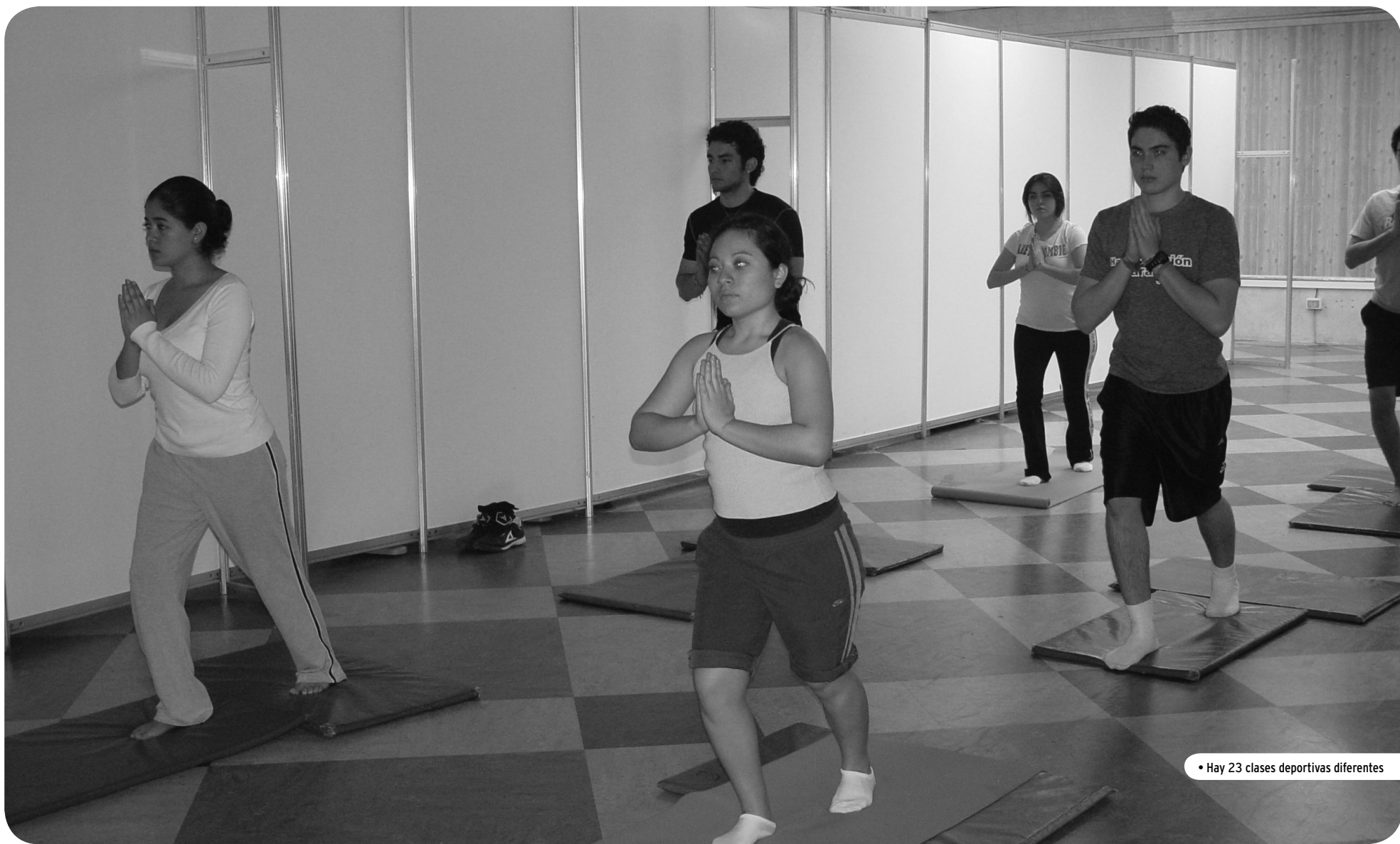
• Hay 23 clases deportivas diferentes