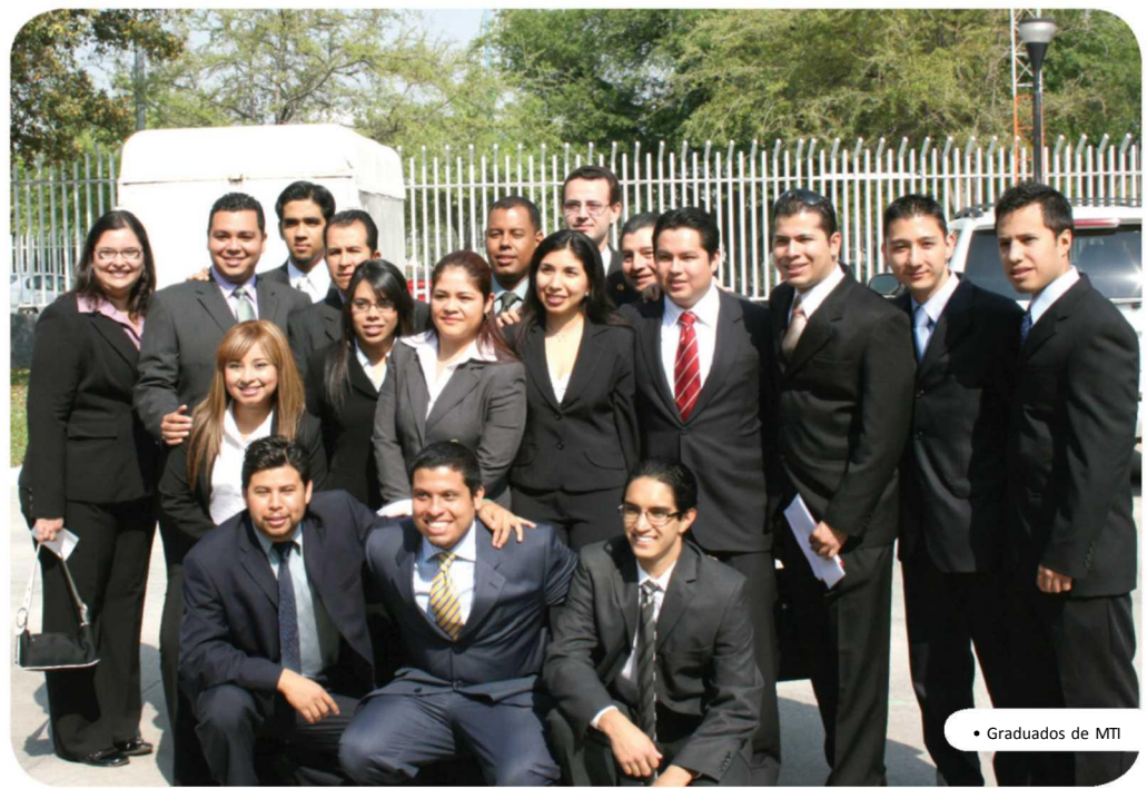
• Graduados de MTI

"Me da mucho orgullo, ya que representa el cierre de un ciclo y empezar una nueva vida como profesionista y eso me da mucha alegría. Me siento muy contenta y feliz de graduarme del Tec ya que esta escuela me brindo diferentes oportunidades para aprender en la carrera y aplicarlos en la vida profesional y me gusto mucho lo que pude vivir aquí en mis 5 años".