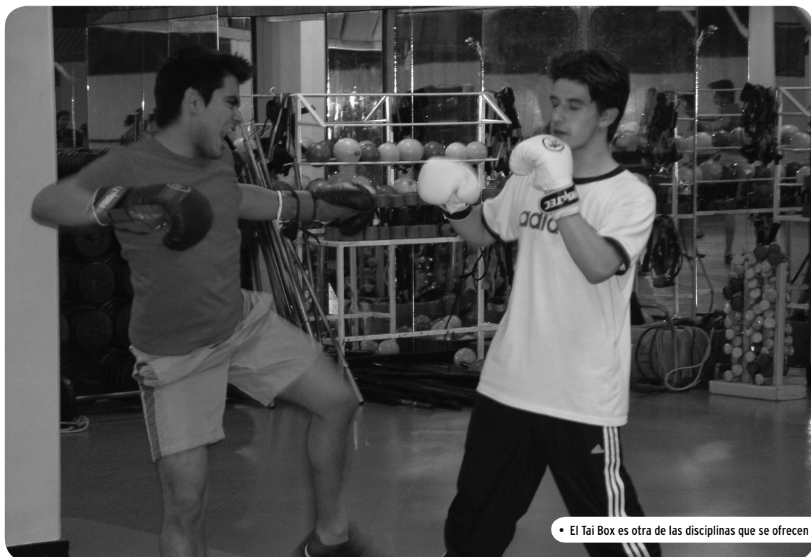
• El Tai Box es otra de las disciplinas que se ofrecen