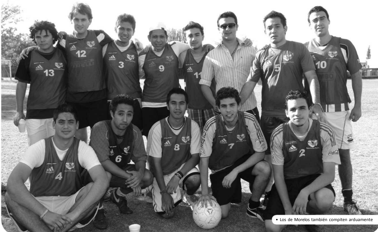
• Los de Morelos también compiten arduamente