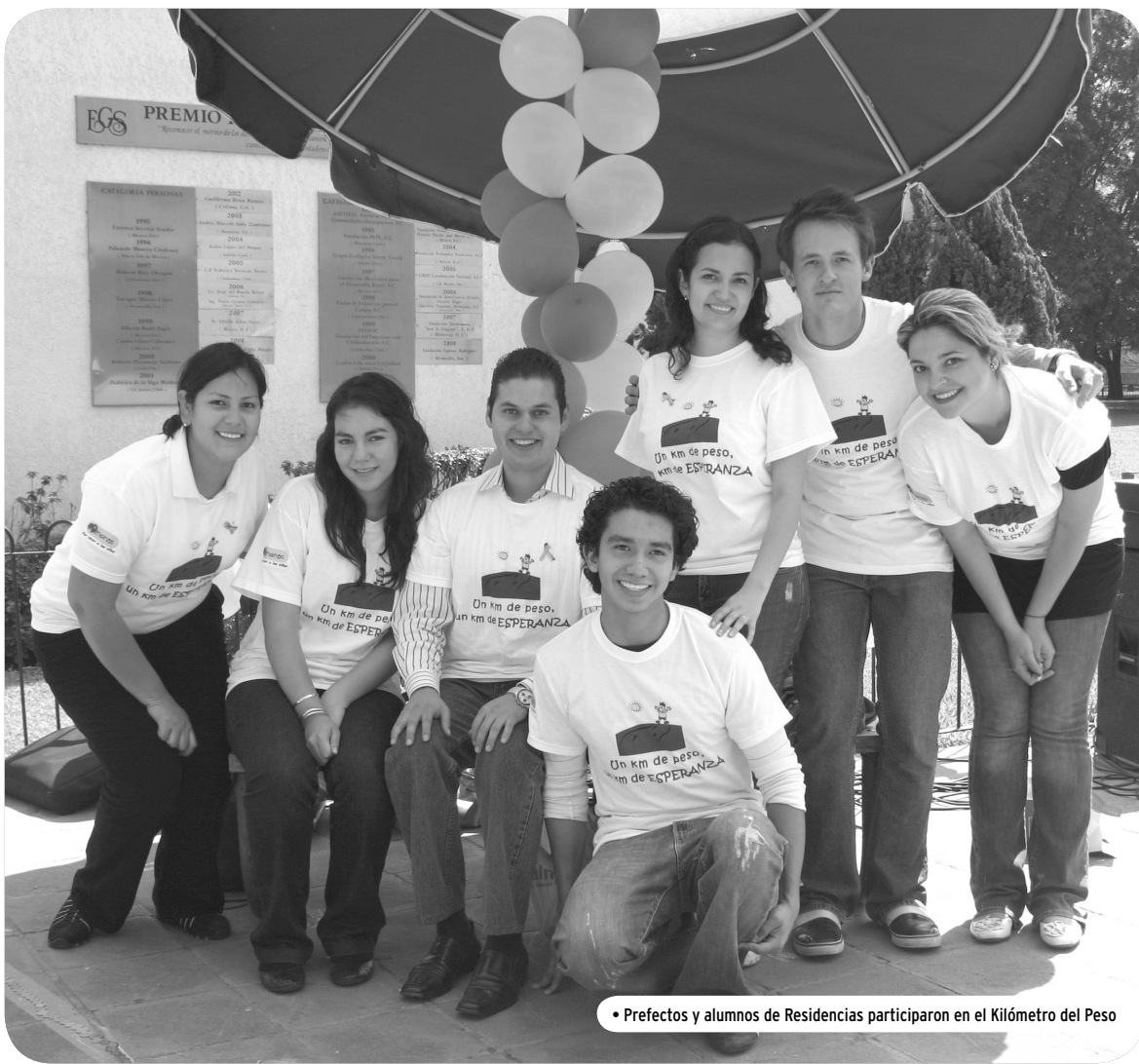
• Prefectos y alumnos de Residencias participaron en el Kilómetro del Peso