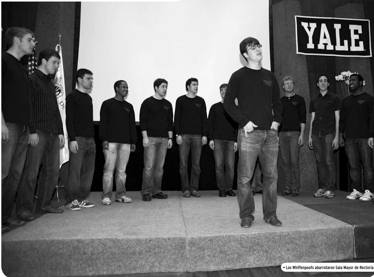
• Los Whiffenpoofs abarrotaron Sala Mayor de Rectoría