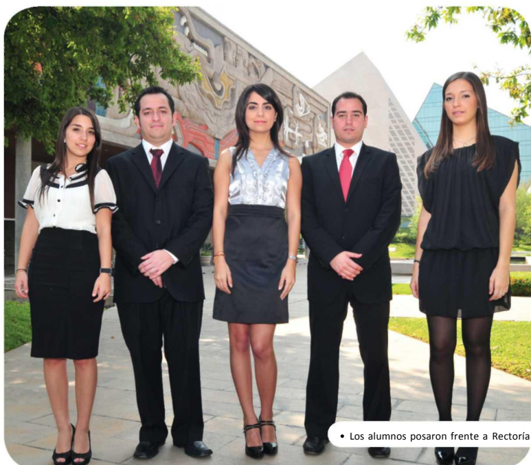
• Los alumnos posaron frente a Rectoría