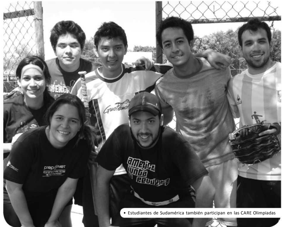
• Estudiantes de Sudamérica también participan en las CARE Olimpiadas