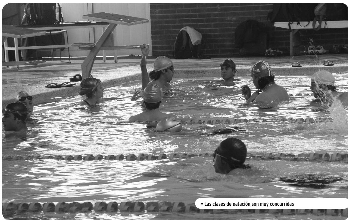
• Las clases de natación son muy concurridas