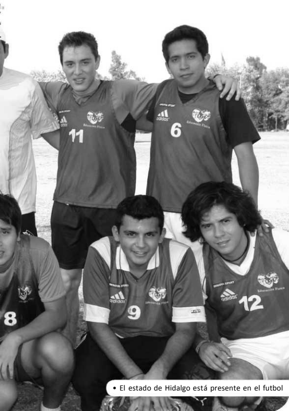
• El estado de Hidalgo está presente en el fútbol