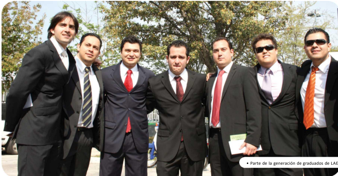
• Parte de la generación de graduados de LAE

"Siento mucha emoción, me acuerdo que veía a amigos en semestres pasados que estaban en la foto y quería ya estar en este momento, además de alegría de estar con mis amigos y mi generación".