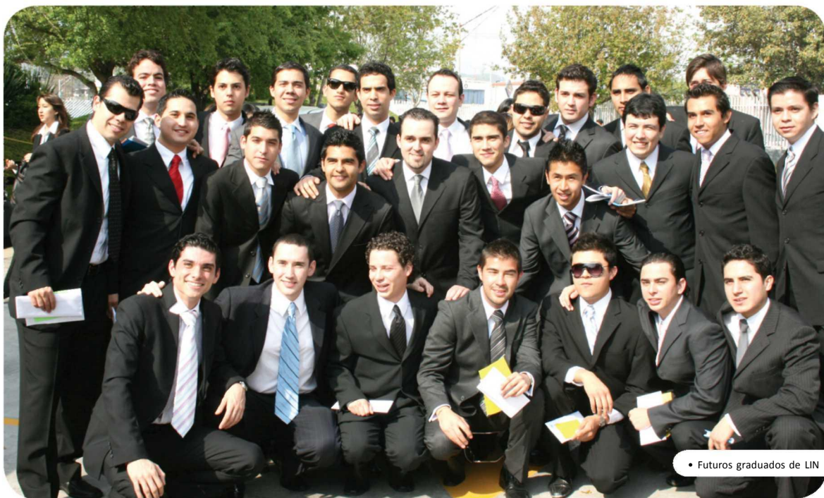
• Futuros graduados de LIN