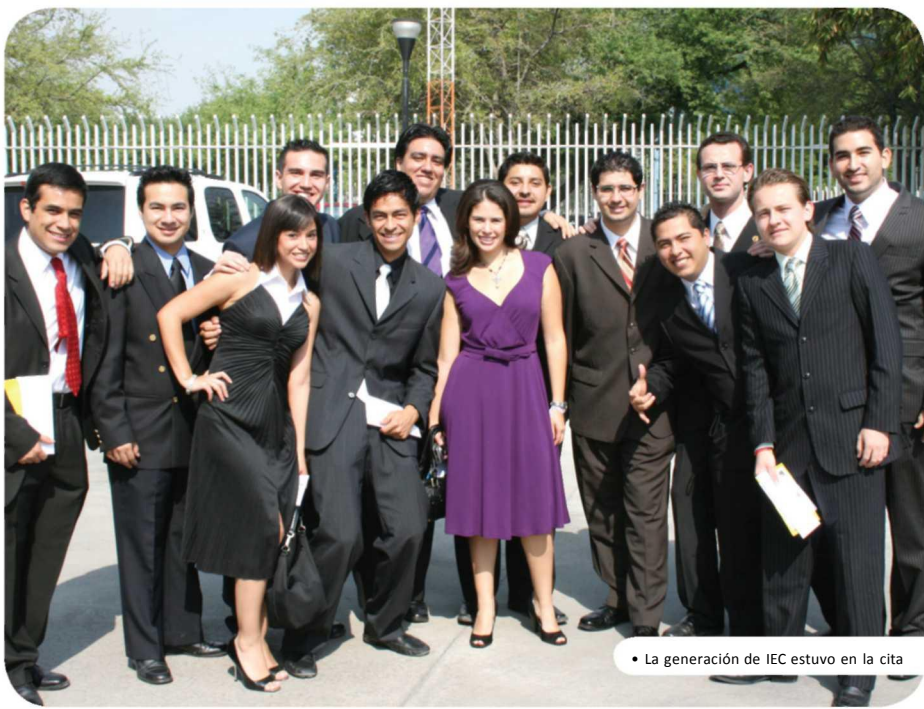
• La generación de IEC estuvo en la cita