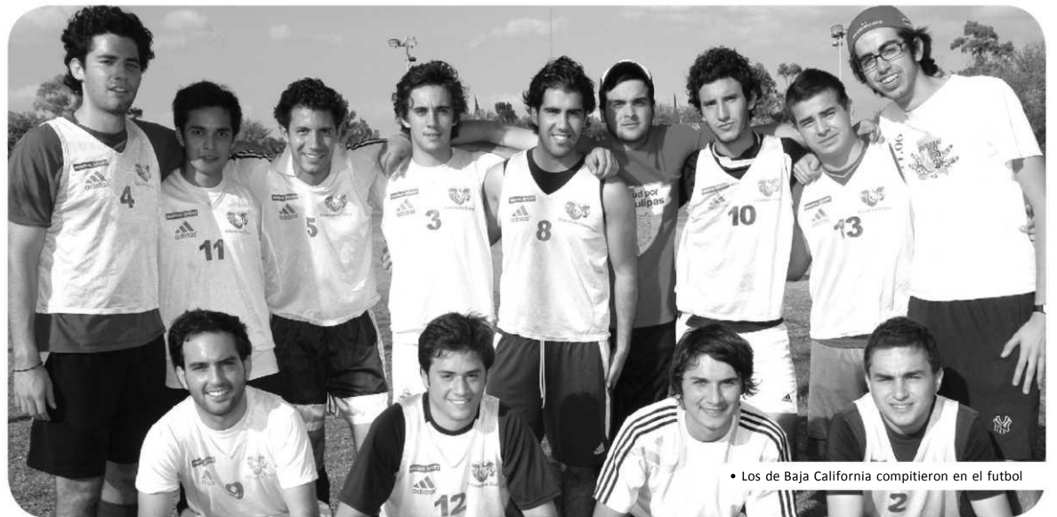
• Los de Baja California compitieron en el futbol

La premiación se celebrará este viernes 27 de marzo; con esto, el CARE demuestra la unión de las asociaciones regionales y coronará a los mejores del deporte.