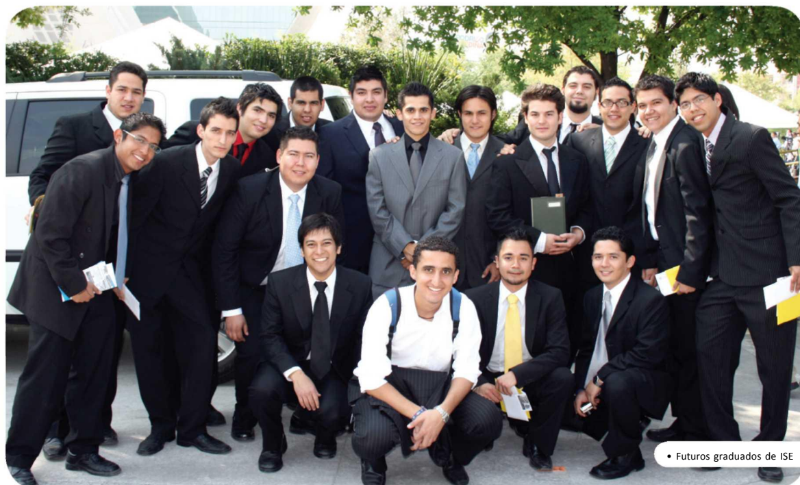
• Futuros graduados de ISE