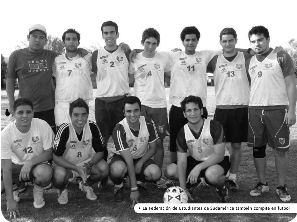
• La Federación de Estudiantes de Sudamérica también compete en fútbol