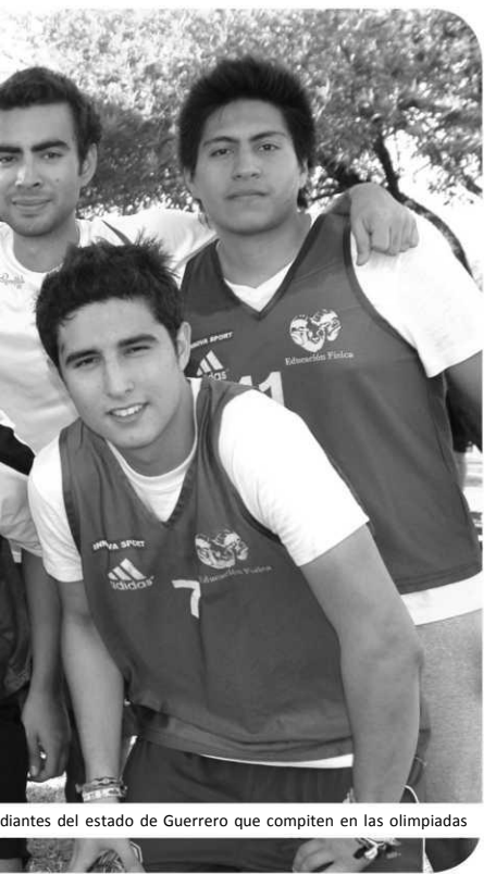
• Atletas del estado de Guerrero que compiten en las olimpiadas