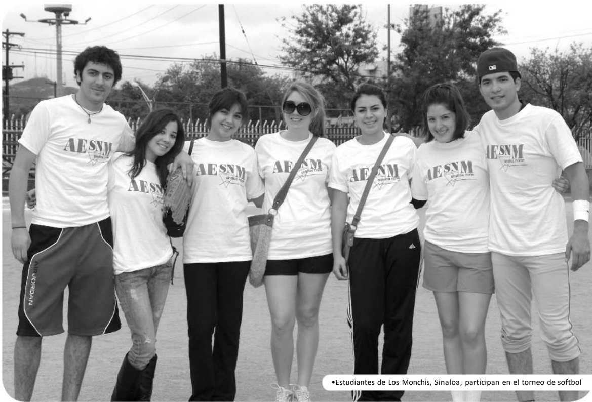
•Estudiantes de Los Monchis, Sinaloa, participan en el torneo de softbol