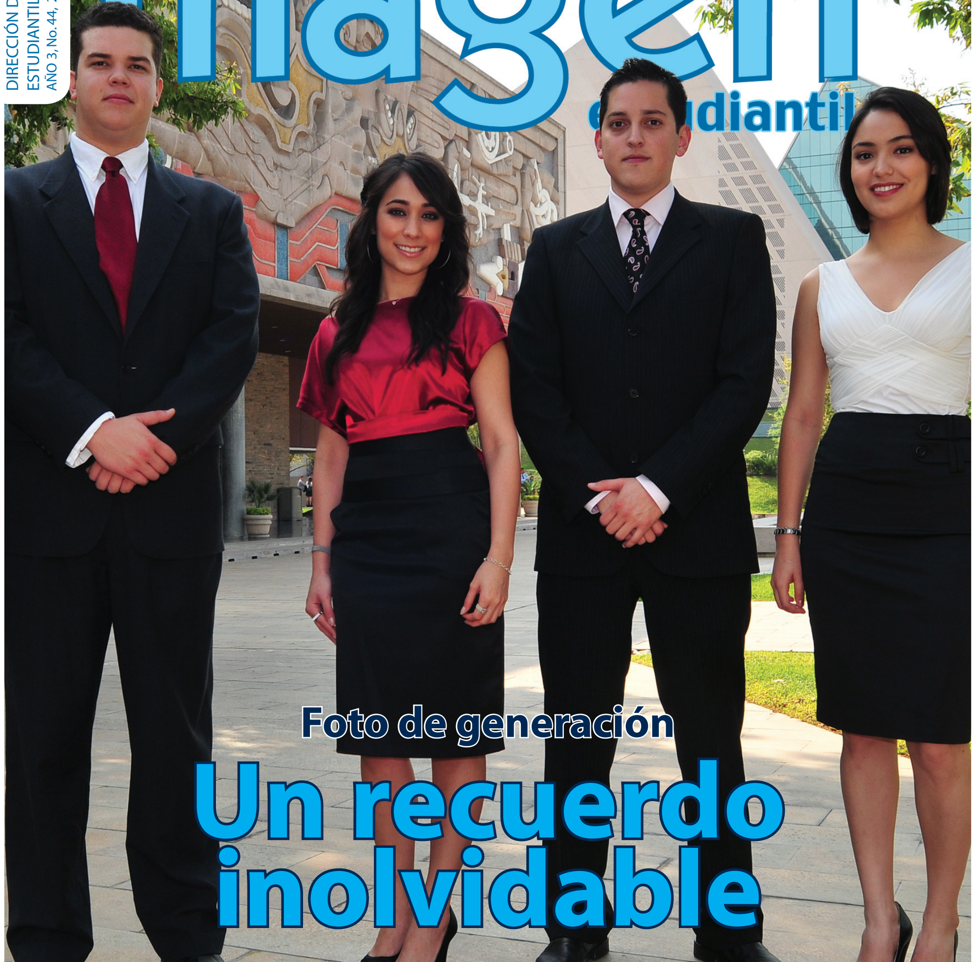
Foto de generación