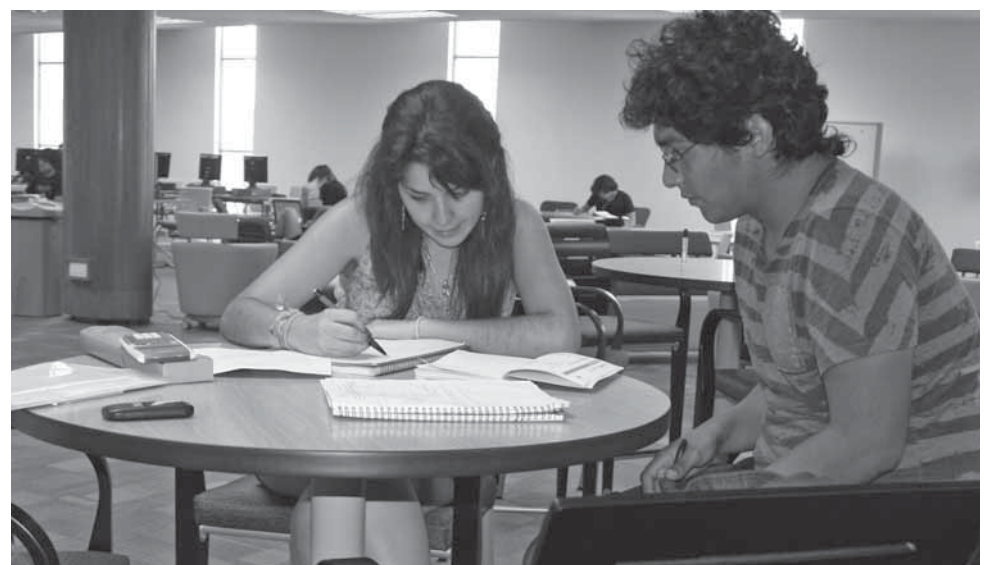
>La ENCSH promueve que sus alumnos se formen de manera integral.