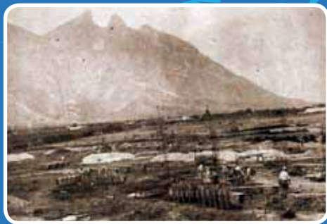
>La construcción del Campus inició en 1945.