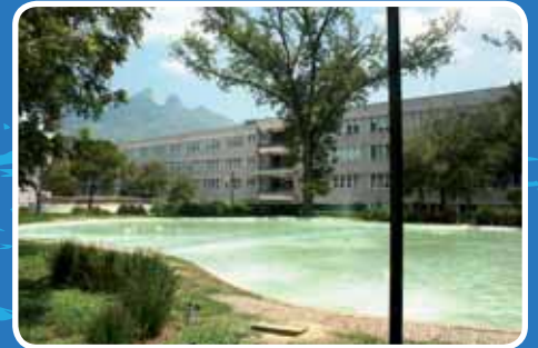
> "El Lago". Al fondo se observa Aulas 1.