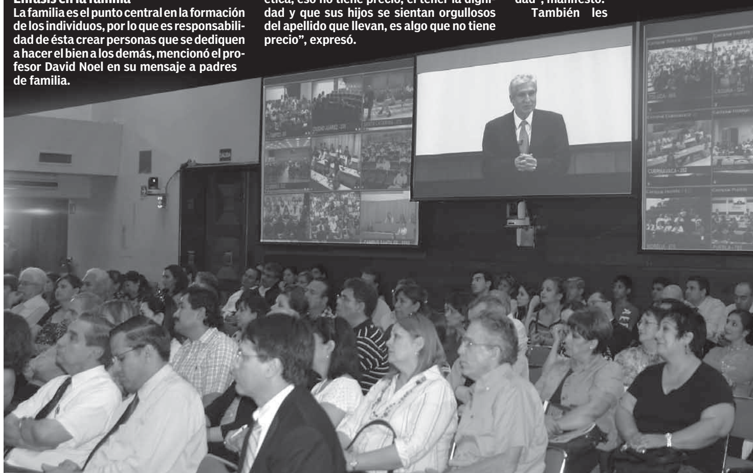
>Una gran cantidad de padres de familia se dieron cita en la Sala Mayor de Rectoría, además de los que acudieron a los diferentes campus a ver la transmisión.