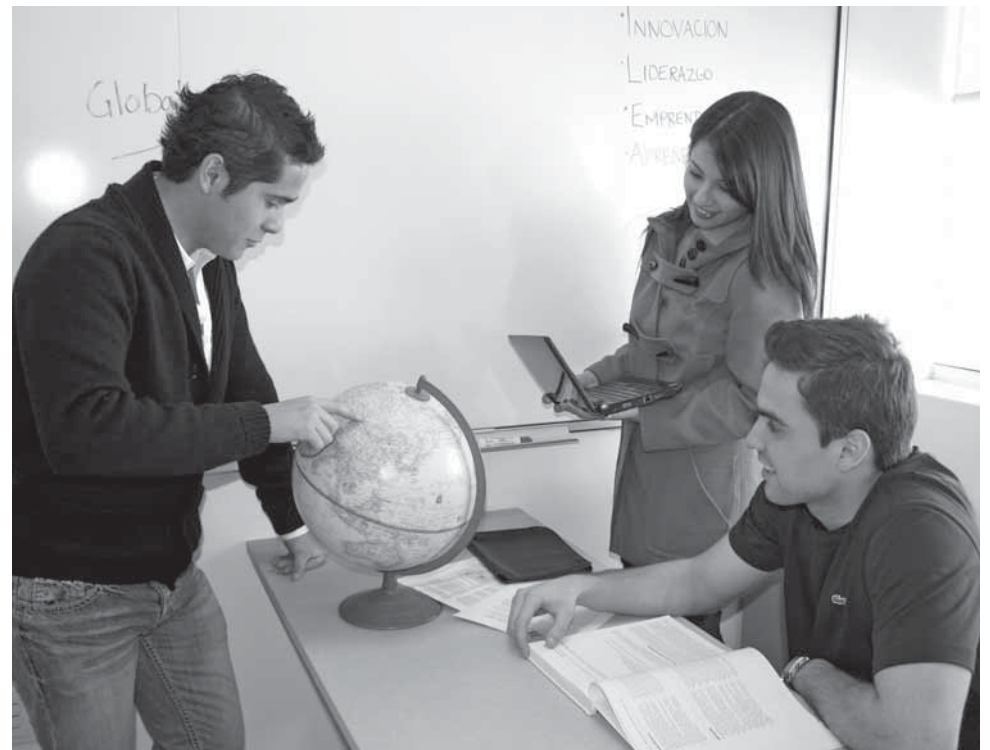
>Desarrollar una visión global, es fundamental para los alumnos del Tecnológico de Monterrey.