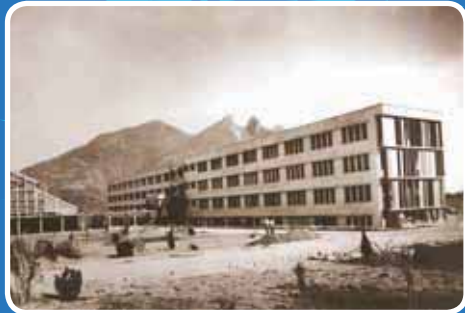
> Aulas 1, primer edificio en el Campus Monterrey.