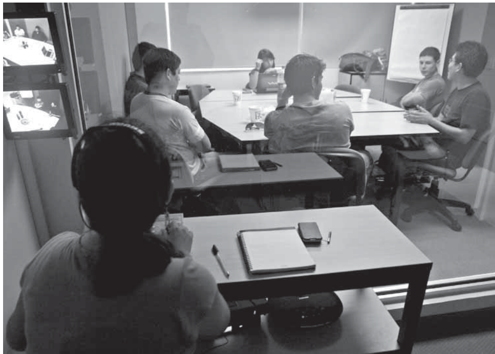
>La Sala Bumeran cuenta con cámaras tipo Gesell, para proyectos de investigación y análisis de mercado.