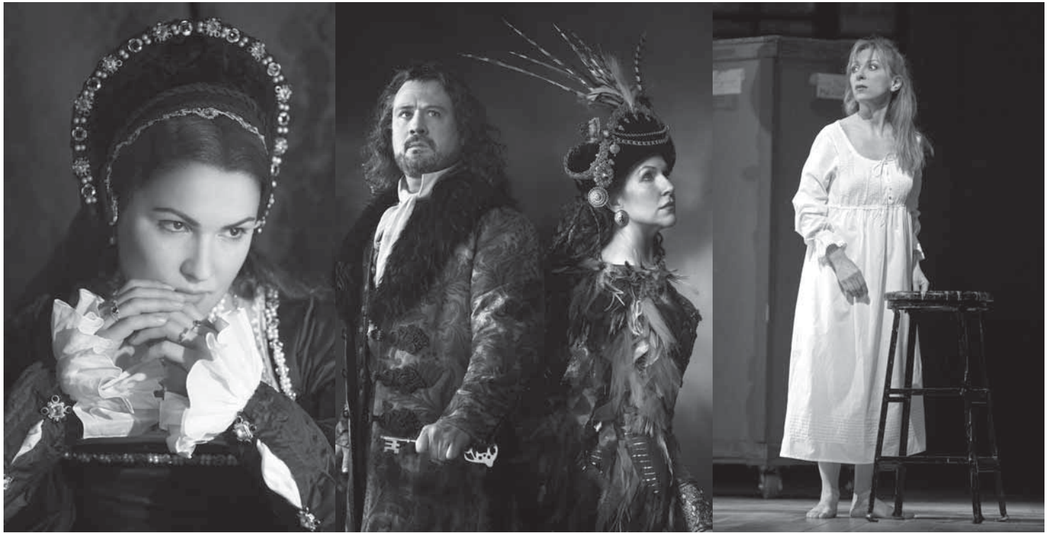
> (De izq. a der.) La temporada comienza con la ópera “Anna Bolena”. También se encuentran en el programa “La Isla Encantada” y “La Traviata”.

Los boletos se pondrán a la venta el jueves 8 de septiembre, en la página www.ticketmaster.com.mx