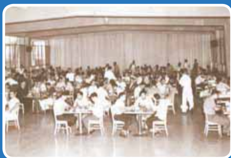
>Cafetería Centrales, punto de reunión.