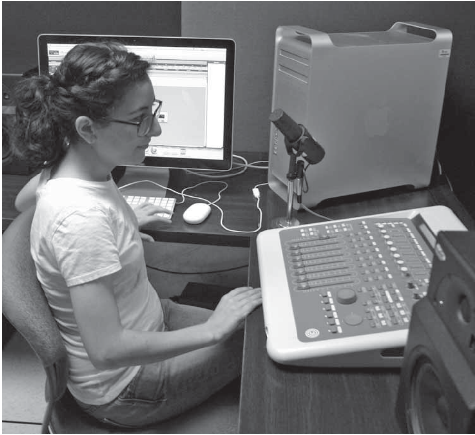
>En el CIAP se encuentran ubicadas las cabinas de radio, para realizar prácticas.