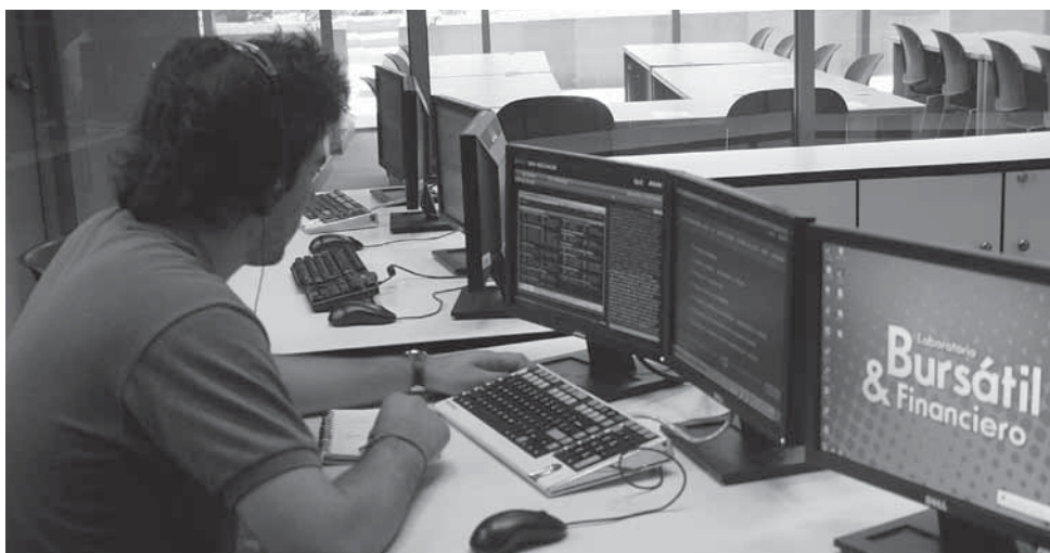
>El Laboratorio Bursátil y Financiero, es un elemento importante para el área de finanzas.

En próximas ediciones se publicarán los mejores promedios del resto de las Escuelas