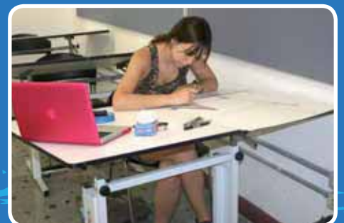
> La tecnología se ha integrado al modelo educativo, pero la calidad académica permanece.