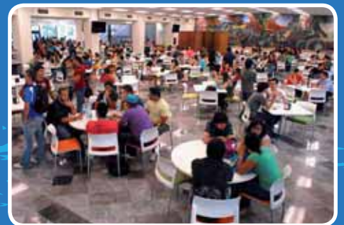
> Ahora, Centrales cuenta con más espacio.