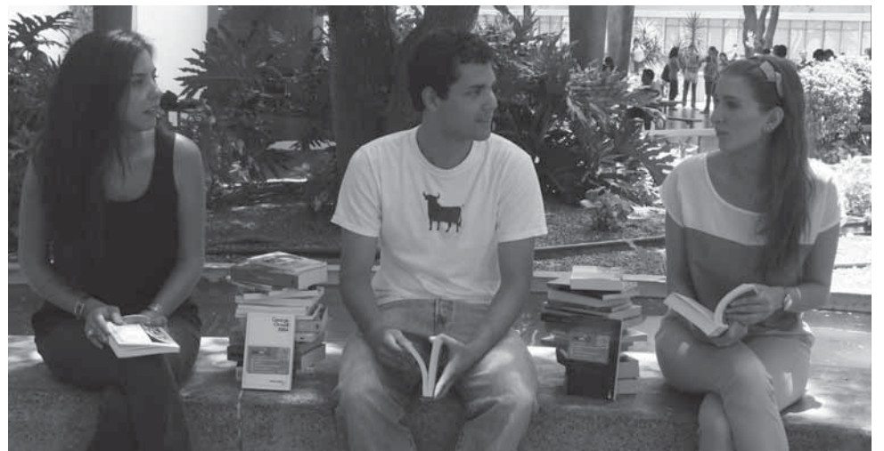
>La lectura y el análisis crítico, es fundamental para los alumnos que pertenecen a la ENCSH.