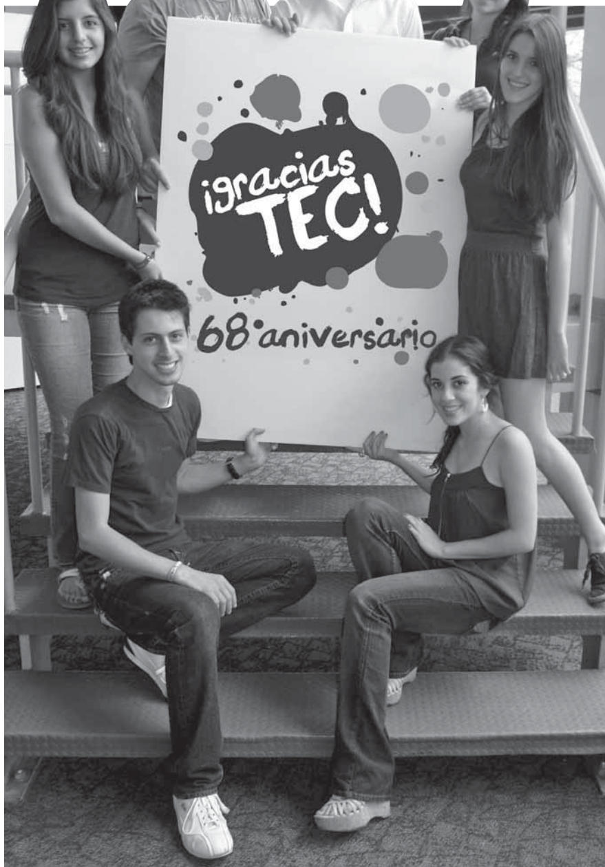
>El comité organizador se mostró muy entusiasmado por las actividades que se llevarán a cabo para que la celebración del 68 aniversario del Tecnológico de Monterrey sea todo un éxito.