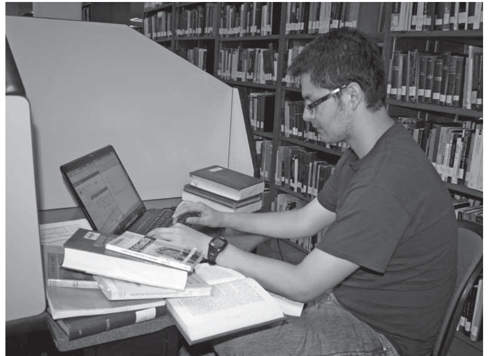
>Alumnos de la ENCSH, encuentran tanto en libros, como en recursos digitales, un gran apoyo.

>Las fotos son solamente ilustrativas para dar referencia a la actividad académica que llevan a cabo los alumnos que pertenecen a la ENCSH, sin embargo no corresponden necesariamente a los alumnos que aparecen en los listados.