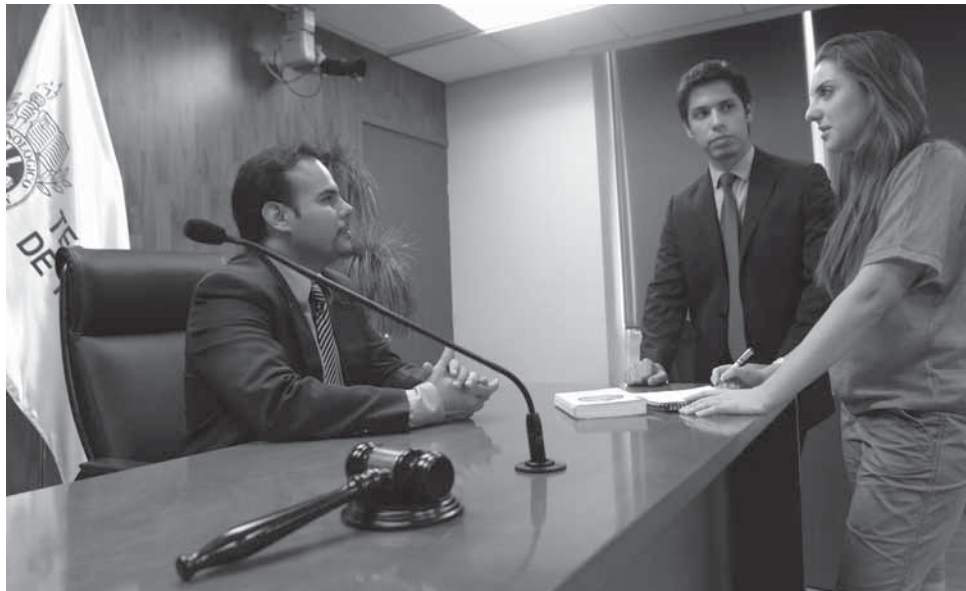
>La Sala de Juicios Orales es utilizada por alumnos que cursan carreras en el área de Derecho.