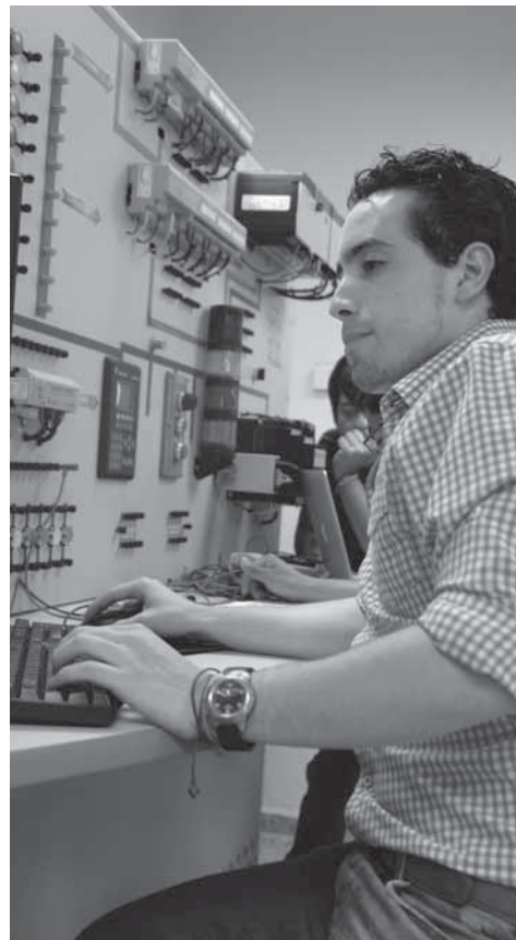
> La EITI busca que sus alumnos tengan una gran calidad académica y que se generen mayores sinergias que beneficien los proyectos.