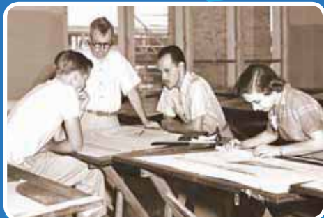
>Alumnos de las primeras décadas, realizando sus actividades escolares.