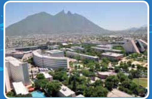
> Así luce el Campus Monterrey en el 2011.

Así mismo, se ha propuesto ser un verdadero promotor del desarrollo económico, político y social de México, por lo cual ha enfocado su investigación en áreas prioritarias, ha conformado una extensa red de parques tecnológicos, incubadoras y aceleradoras de empresas para promover una nueva economía; y ha establecido modelos y programas que buscan reducir la brecha educativa en el país.