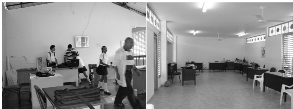
Figura 3. Sala de profesores de la sede Núcleo Escolar. A la izquierda en el año 2009 y a la derecha en el 2011.

Son pocas las instituciones educativas rurales que conservan las construcciones que ofrecían las alternativas agropecuarias; en el caso de la sede en estudio, sus cimientos como la práctica educativa han cambiado, y más rápido en los últimos años. En la figura 3, se puede observar las instalaciones que existían antes de 2009 y las que existen en el 2012.