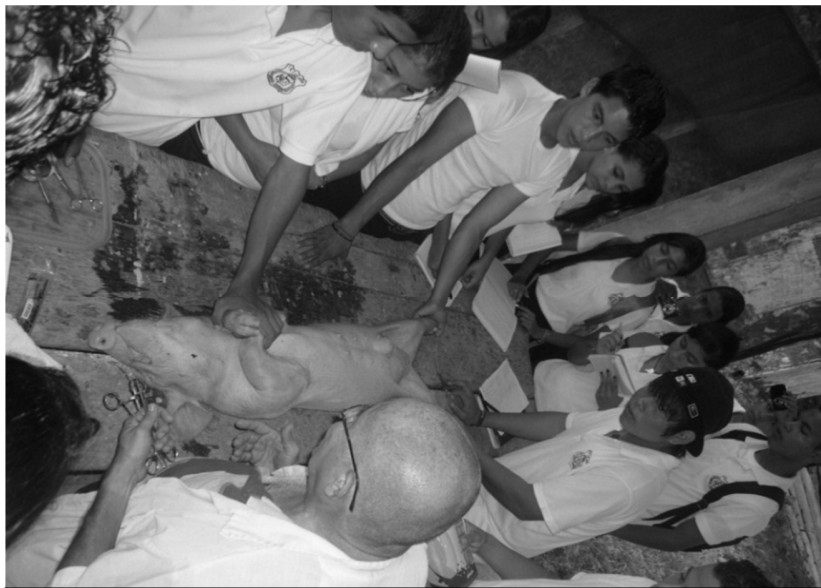
Actividades Pedagógicas. Práctica del grado decimo en Producción Pecuaria sobre el procedimiento de cirugía para corregir una hernia en porcinos (extracción de un video multimedia)