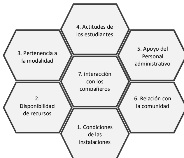
Figura 2. Diagrama de las condiciones que afectan la práctica docente en una institución rural.

A partir de la triangulación de la información originada de los diversos instrumentos y técnicas, surgieron las categorías que son descritas en la figura 2, relacionadas con las condiciones de la práctica docente.