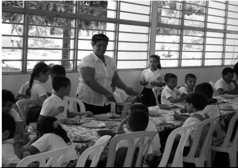
Actividades que realizan los docentes durante la semana de disciplinas, regulando el servicio de restaurante estudiantil