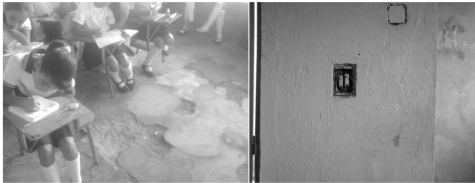
Figura 5. Aula de clase de la Sede Villa Esperanza. A la izquierda el deterioro de los pisos y a la derecha los circuitos eléctricos.

La anterior afirmación, ratificada con algunas fotografías recolectadas (ver figura 5), supone la existencia de diferentes características entre las instituciones rurales, y más aún entre distintas sedes; además evidencian el posible conformismo de las condiciones de la aula por parte de los docentes de la sede en estudio.