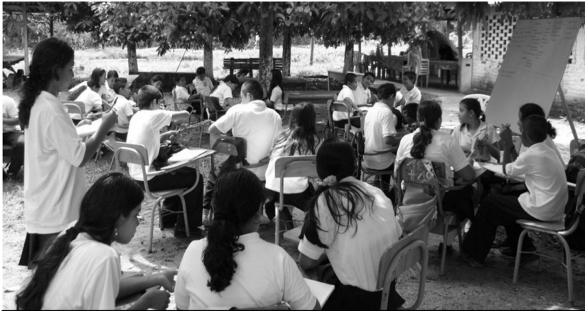
Actividades pedagogía fuera del salón de clase