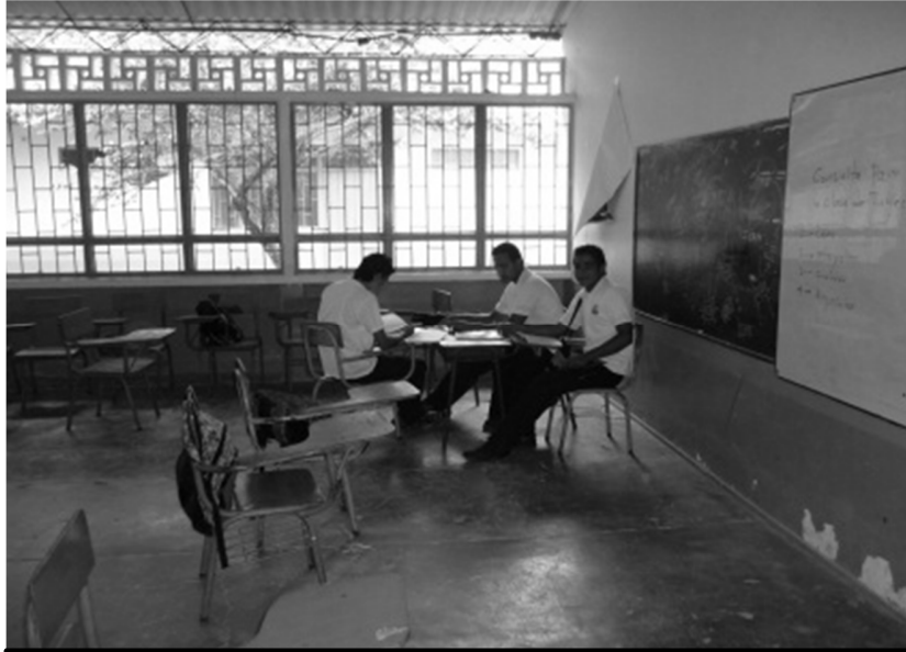
Imagen del salón de grado décimo, en el cual se observa su estructura y deterioro.