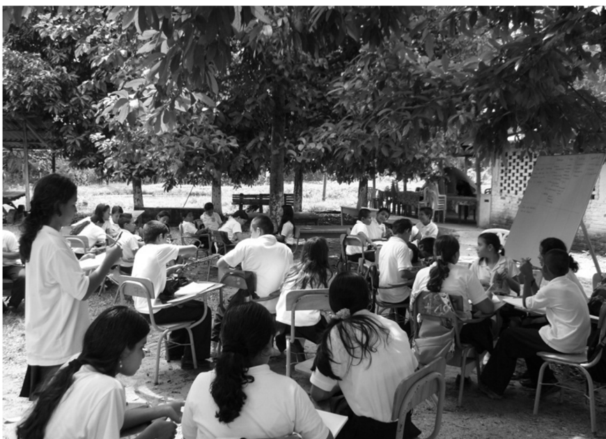
Figura 4. Clase de Ciencias Naturales desarrollada al aire libre, 11:30 a.m. del 24 de agosto de 2011.

Al ser complementadas estas apreciaciones con los documentos recabados, se evidencia que en la sede Núcleo Escolar, este factor se ve remediado por la utilización del espacio verde, como aula ambiental; lo cual es una ventaja de los espacios de las instituciones rurales frente a otras instituciones, que posee limitantes en su área física, ya que los docentes y los estudiantes poseen una mayor flexibilidad en adecuar sus aulas, como también la de modificar e innovar ambientes de aprendizaje.