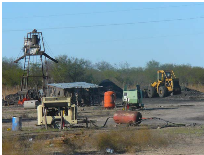
Fotografía 4. Pocitos de Carbón 2