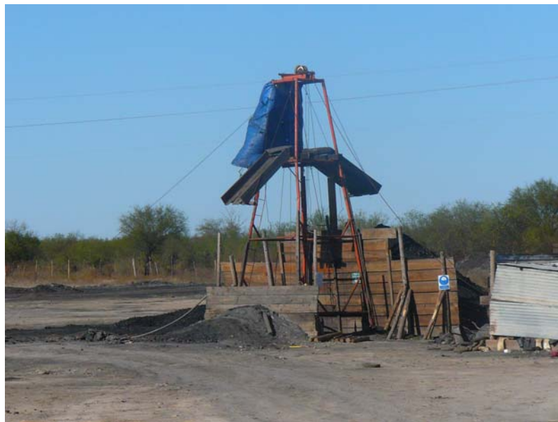
Fotografía 3. Pocitos de Carbón 1