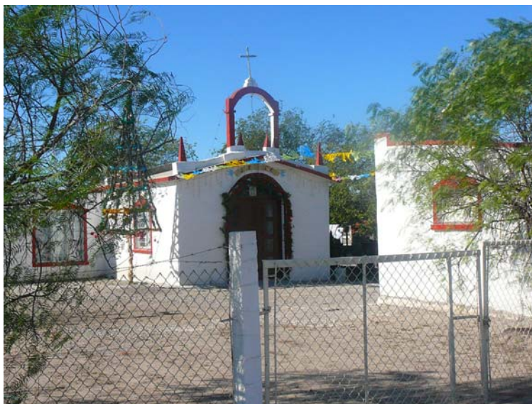
Fotografía 7. Iglesia de ejido