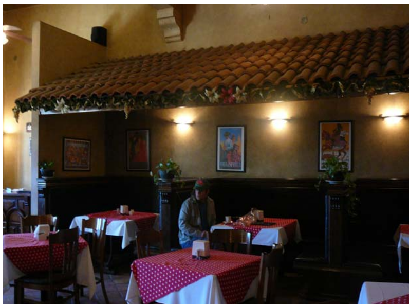
Fotografía 5. Interior restaurante Gran Hotel Sabinas