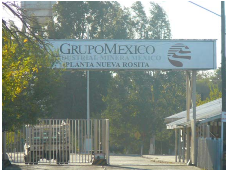
Fotografía 9. Empresa minera