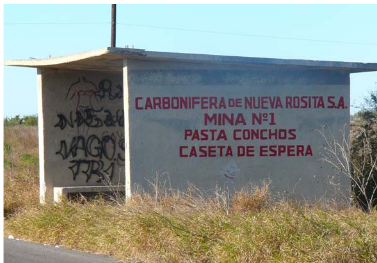
Fotografía 10. Caseta abandonada