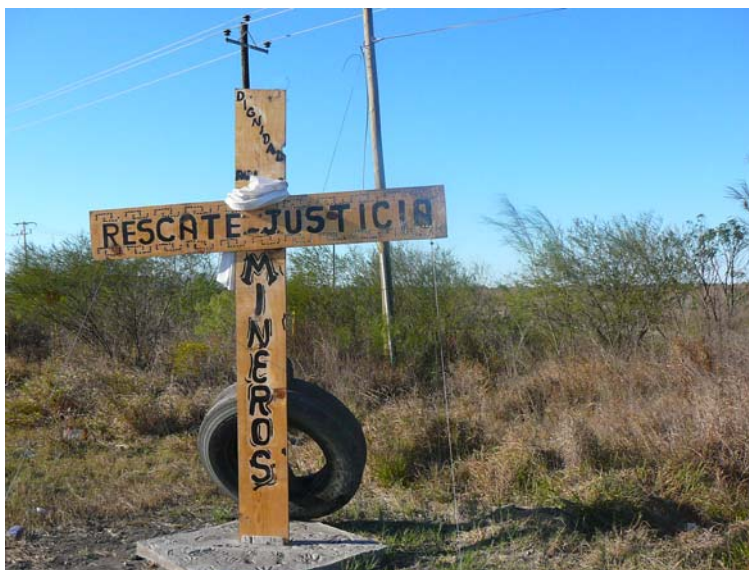
Fotografía 8. Lucha por el rescate de los mineros