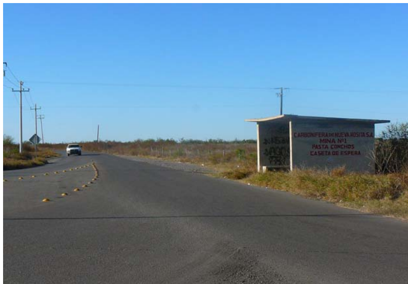
Fotografía 2. Carretera