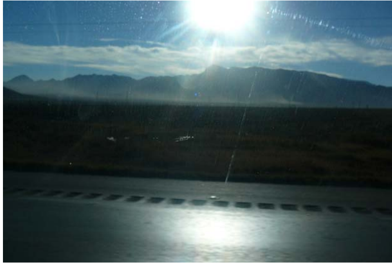
Fotografía 1. Camino a la región carbonífera