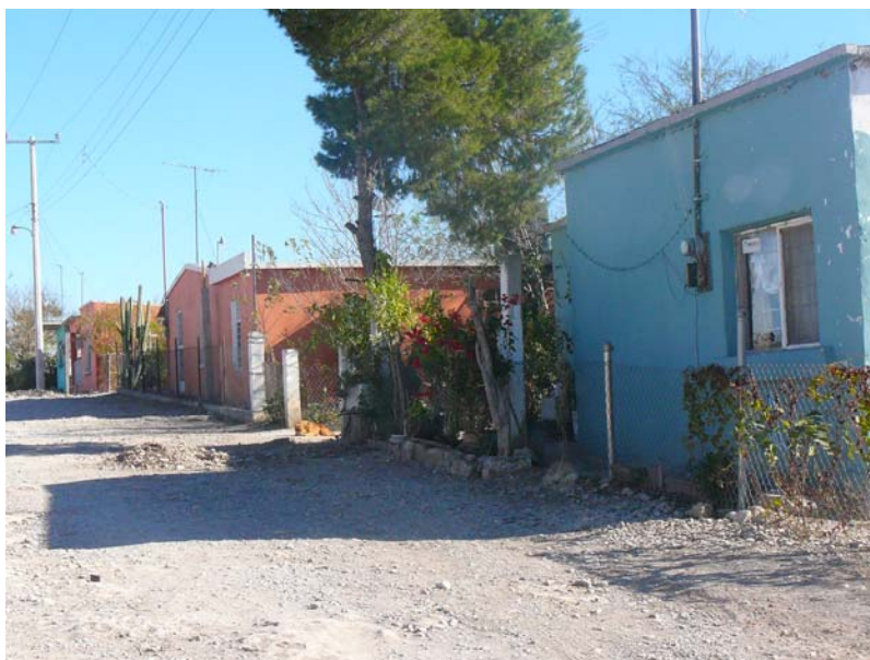
Fotografía 6. Ejemplo de ejido en la región carbonífera