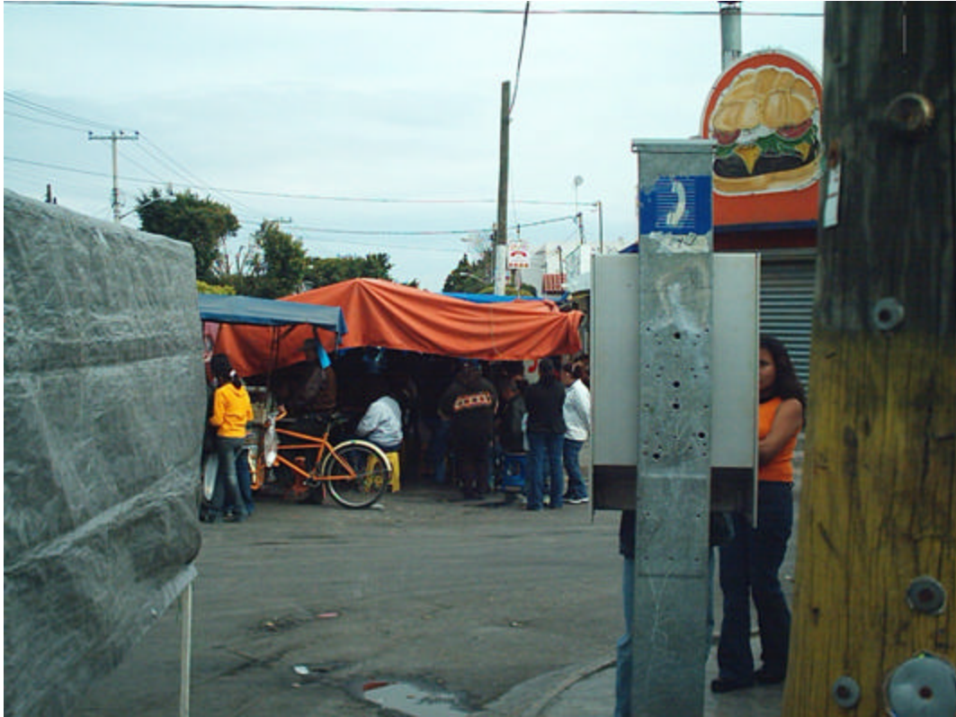
Foto 4. - Vista de la entrada a un puesto del juego de Lotería en avenida Unión.