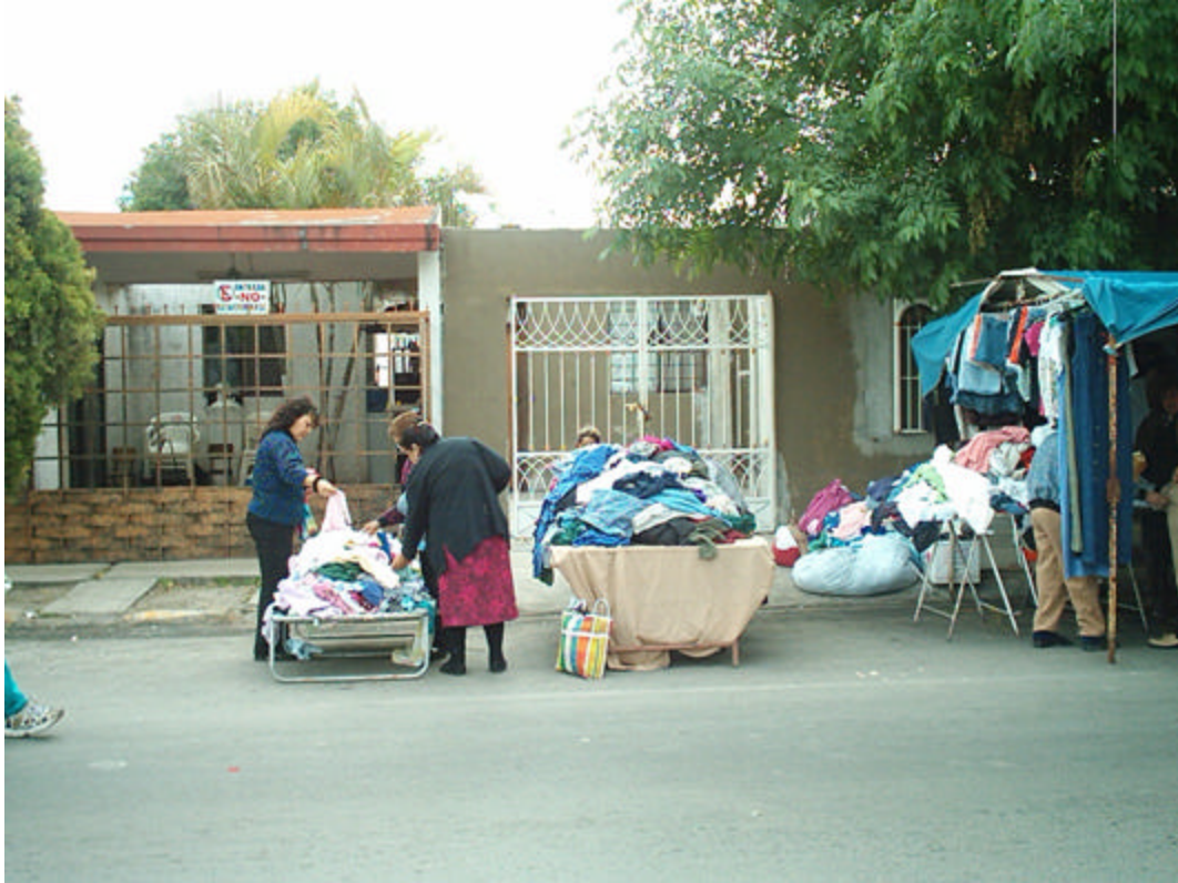
Foto 5. - Vendedora de ropa usada en avenida Unión.

Hay personas que ponen mantas en el suelo y encima ponen lo que venden, generalmente ropa o monos de peluche y muñecas usadas. Otros venden ropa usada sobre los cofres y techos de sus autos o sobre pequeñas mesas.