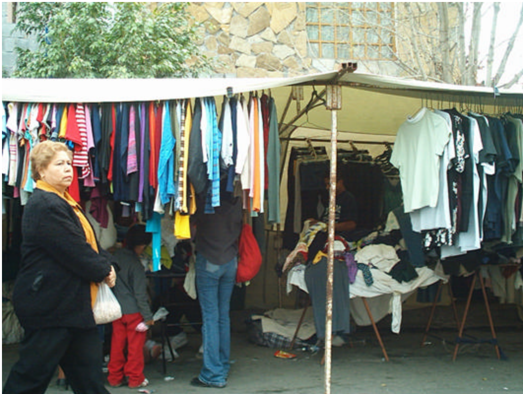
Foto 6. - Puesto de ropa usada