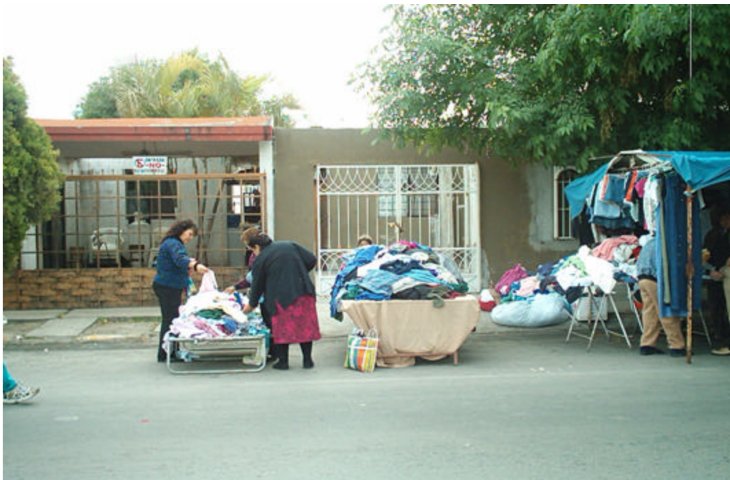
Foto 2.- Vendedora de ropa usada en avenida Unión.