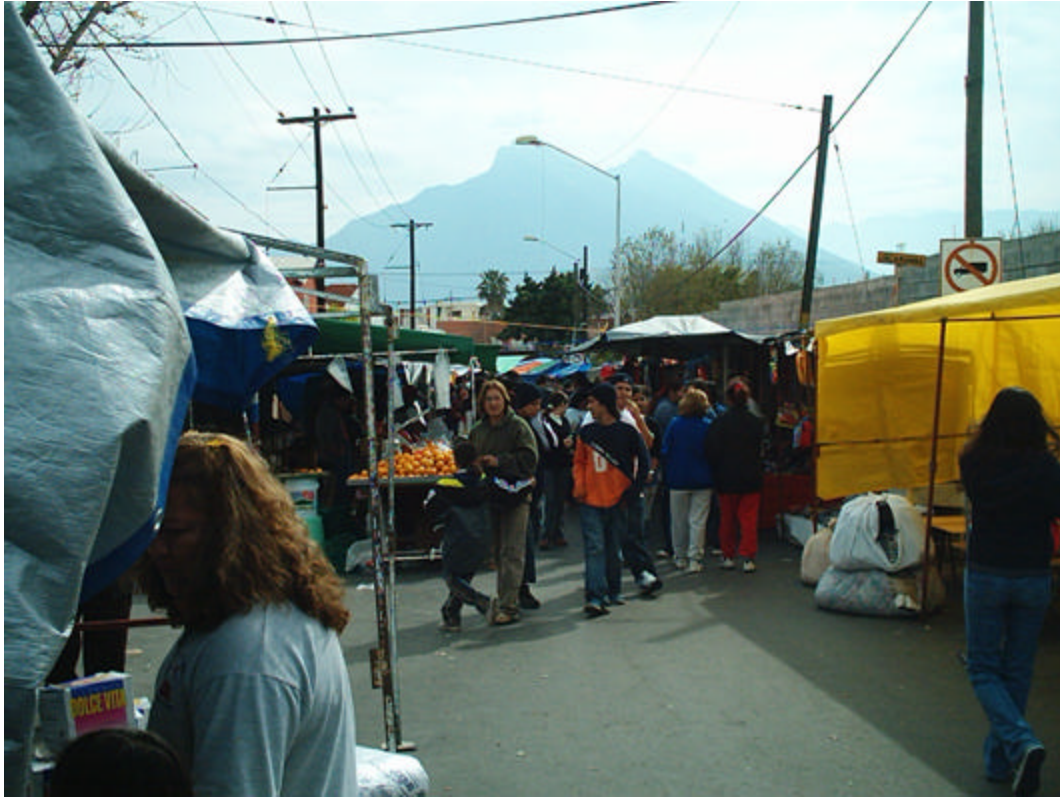
Foto 2. Vista del mercado sobre la calle Peinadores. Al Fondo, el Cerro de la Silla.

En la avenida Unión se percibe el olor a humo de los camiones entre los puestos de comida, pero no así en los de la calle Peinadores, que está cerrada al tráfico vehicular. Las granaderas de la policía municipal vigilan constantemente la avenida.