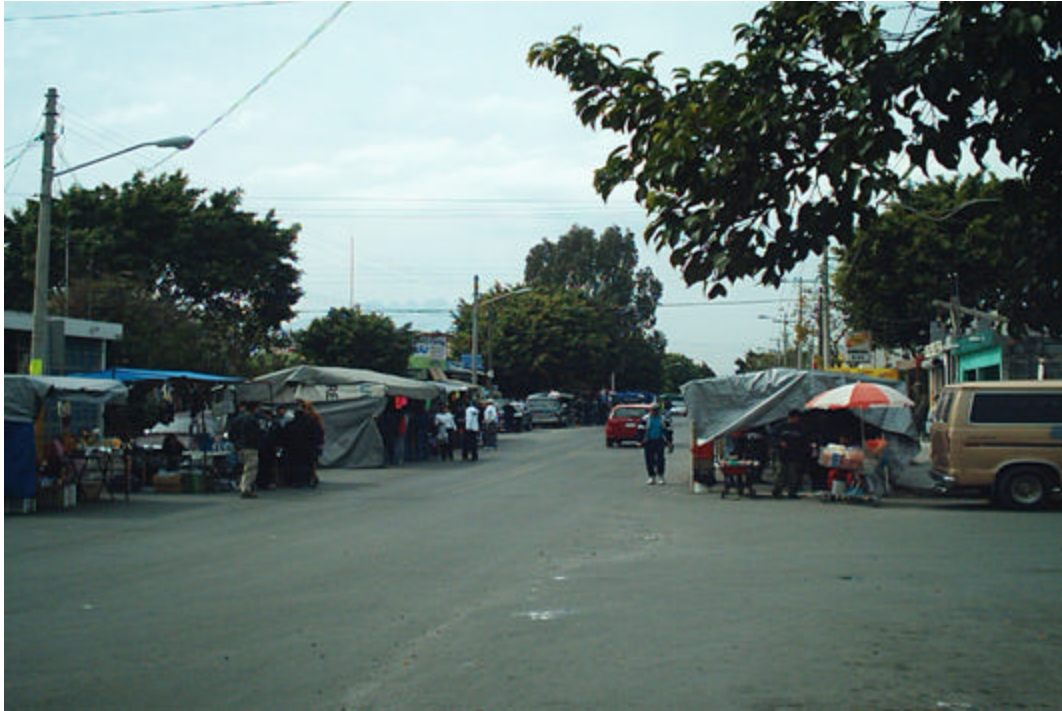
Foto 1. Vista del mercado sobre la avenida Unión.

La avenida Unión consta de 4 carriles, dos en cada sentido. Los dos carriles de los extremos son ocupados por los puestos de venta y los dos del centro están abiertos a la circulación, ya que esa avenida conecta a las colonias circunvecinas con la carretera Miguel Alemán de norte a sur, es decir, es la que te lleva entre otros lugares al centro de Guadalupe y a Monterrey.