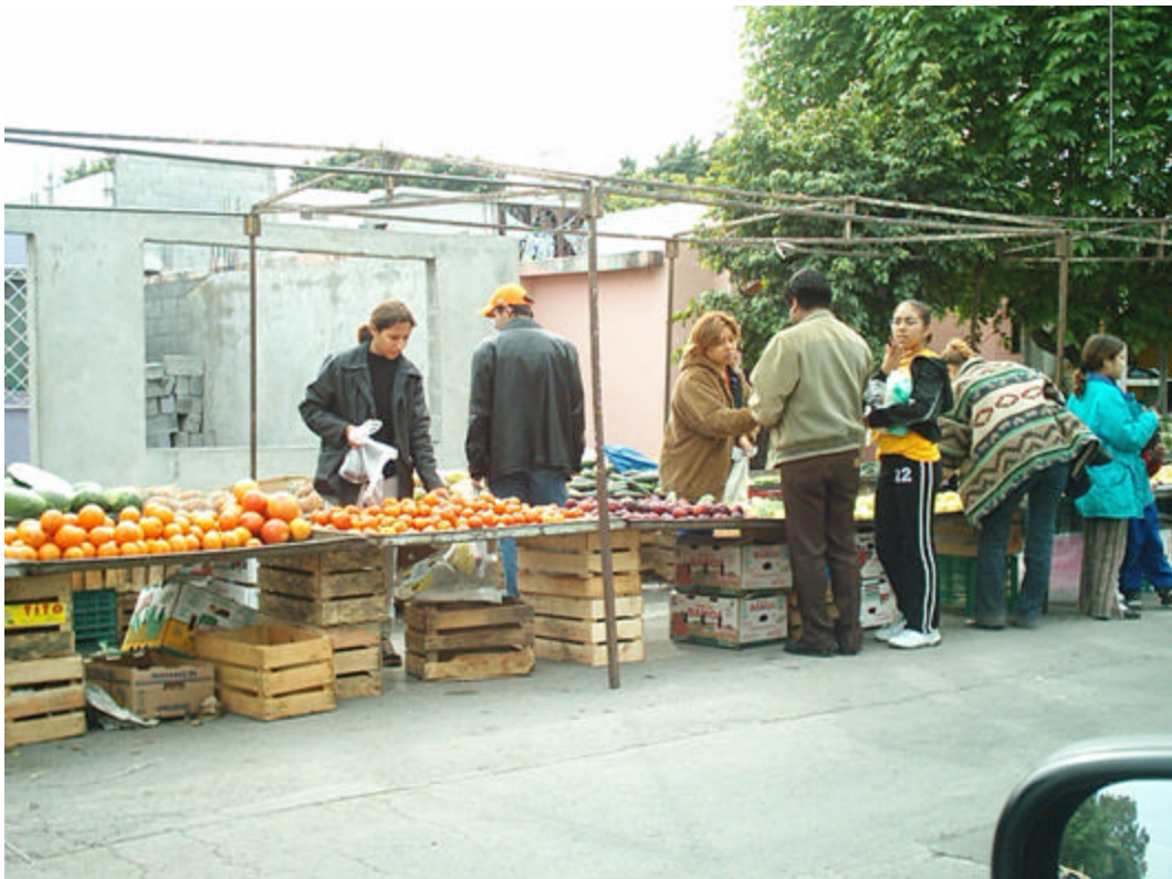
Foto 3. - Puesto de frutas y verduras sobre avenida Unión.