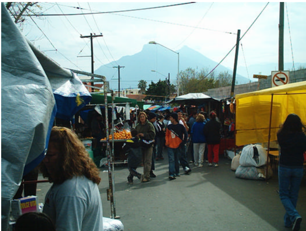
Foto 1. Vista del mercado Unión sobre la calle Peinadores. Al Fondo, el Cerro de la Silla.

Ya que la investigación cualitativa es muy extensa, presentaremos aquí solo el resumen de los hallazgos, pero los diarios de campo completos pueden ser consultados para mayor referencia en el anexo número tres.