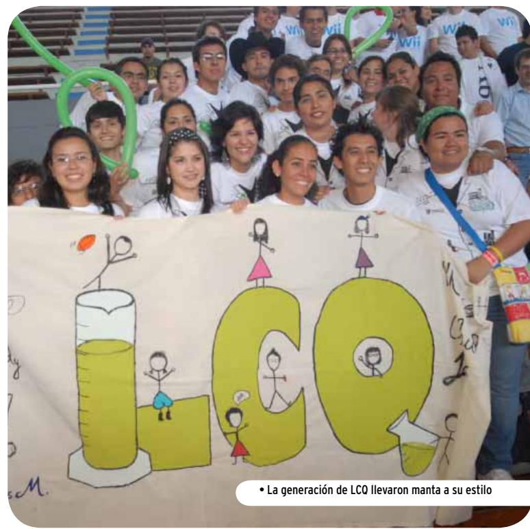
• La generación de LCO llevaron manta a su estilo