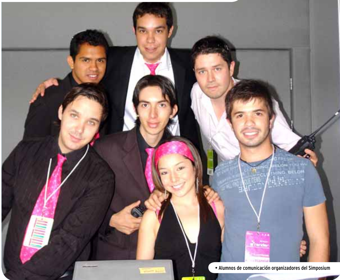
• Alumnos de comunicación organizadores del Simposium