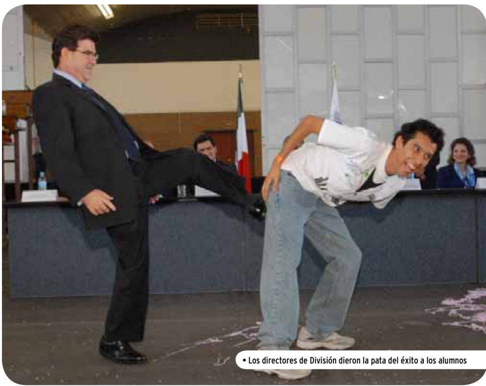
• Los directores de División dieron la pata del éxito a los alumnos