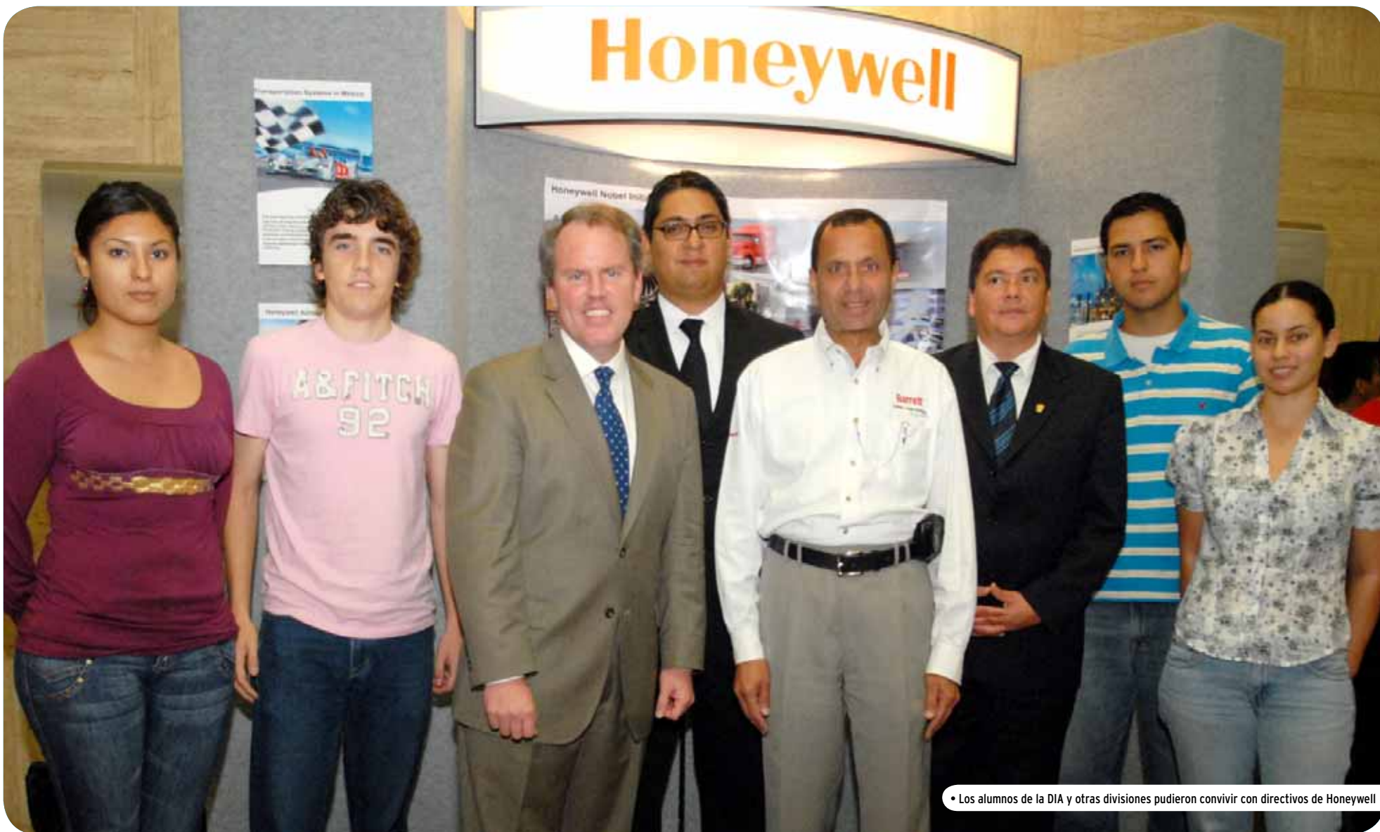
• Los alumnos de la DIA y otras divisiones pudieron convivir con directivos de Honeywell