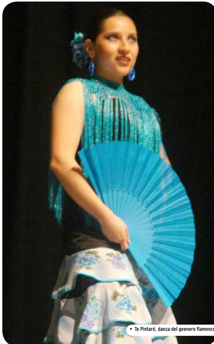
• Te Pintaré, danza del género flamenco