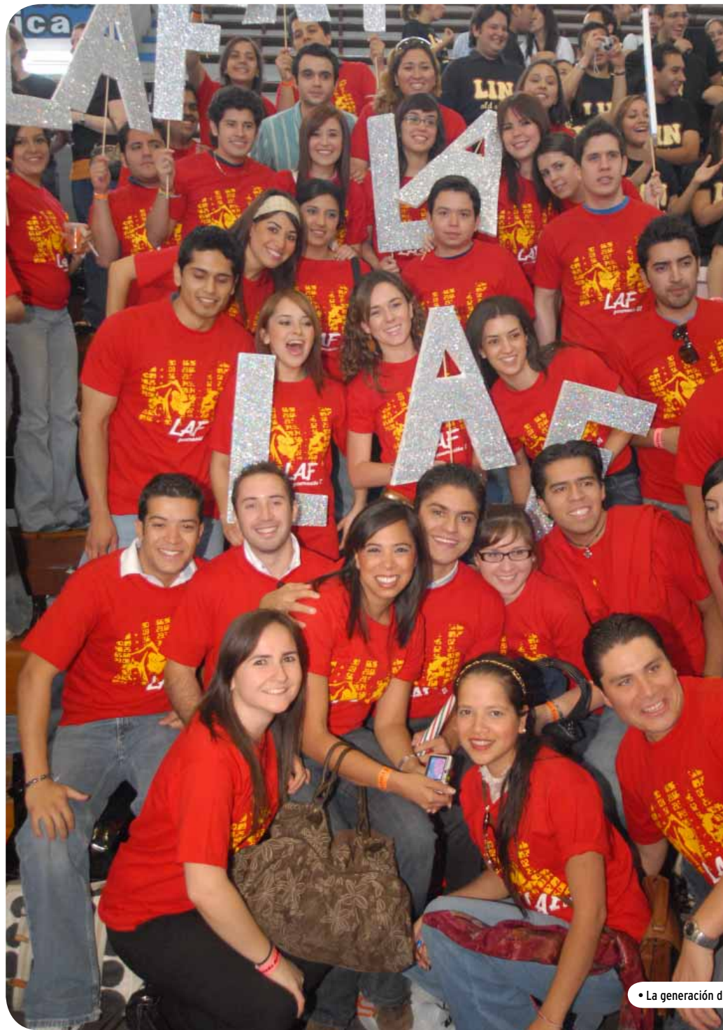
• La generación d