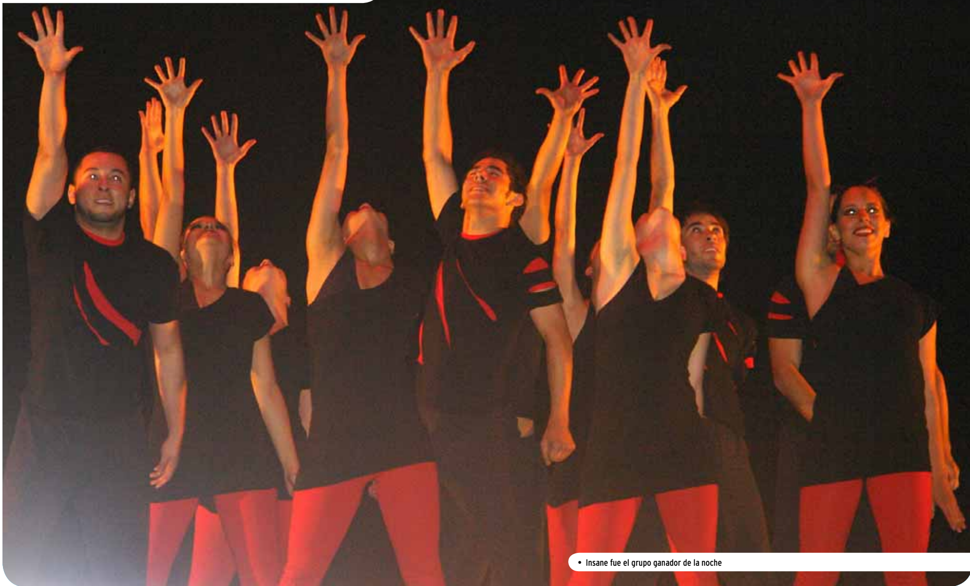
• Insane fue el grupo ganador de la noche