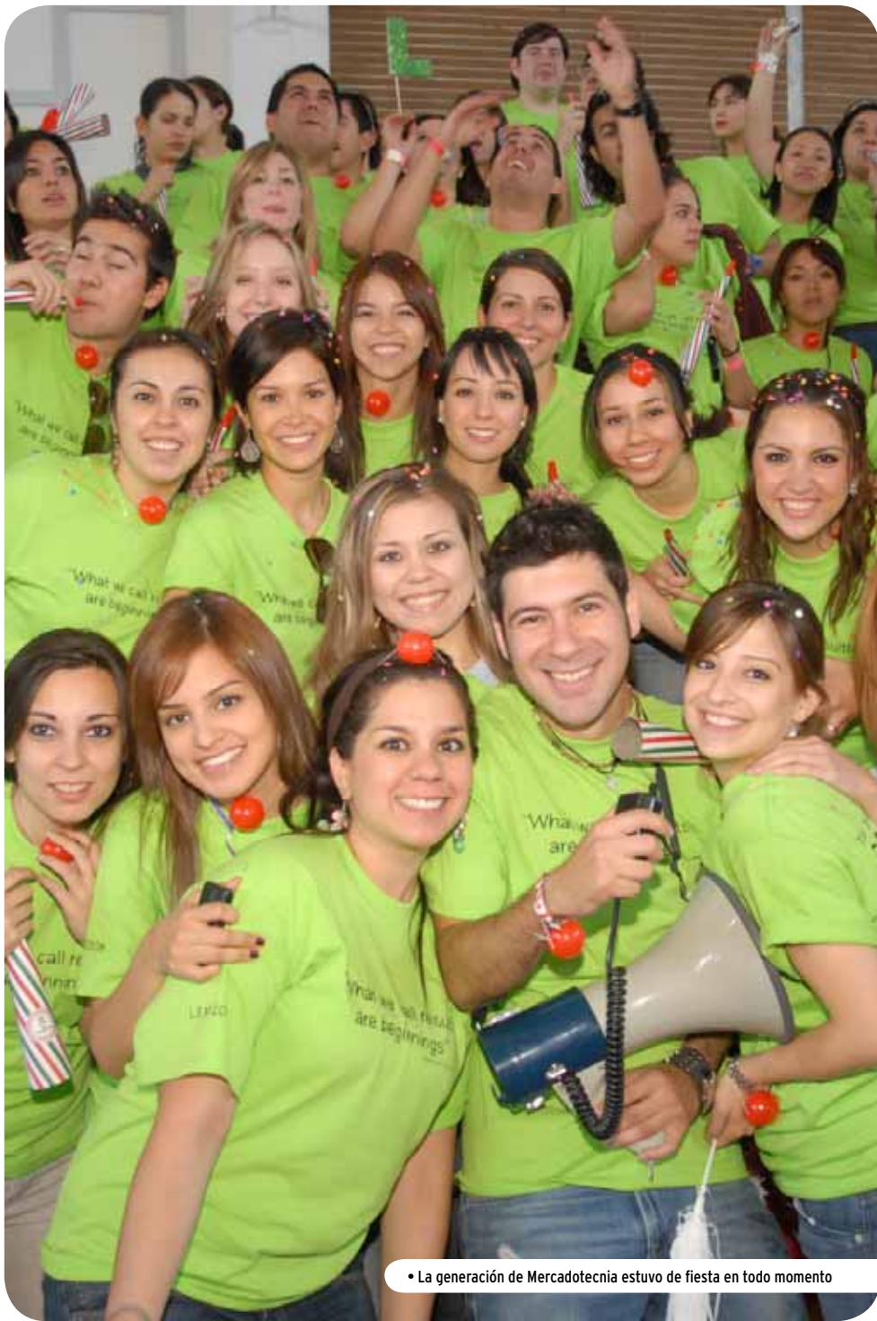
• La generación de Mercadotecnia estuvo de fiesta en todo momento