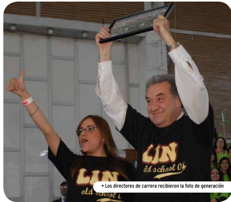
• Los directores de carrera recibieron la foto de generación

Así, la guerra de globos no se hizo esperar y al final hubo más de un alumno empapado. La patada del éxito terminó y ahora los graduandos esperan la ceremonia de graduación para culminar sus estudios en el Tecnológico de Monterrey.