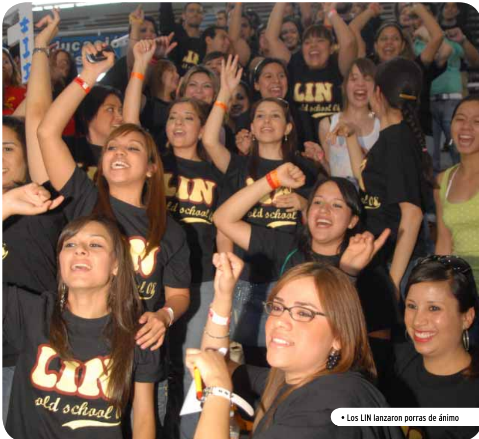
• Los LIN lanzaron porras de ánimo