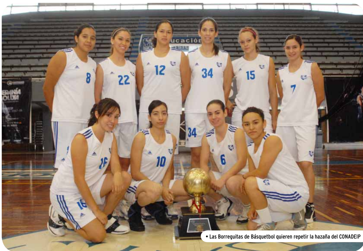
• Las Borreguitas de Básquetbol quieren repetir la hazaña del CONADEIP