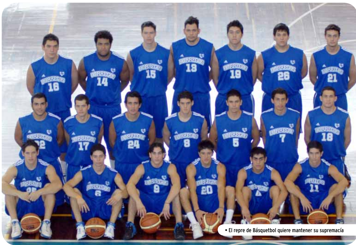
• El repre de Básquetbol quiere mantener su supremacía