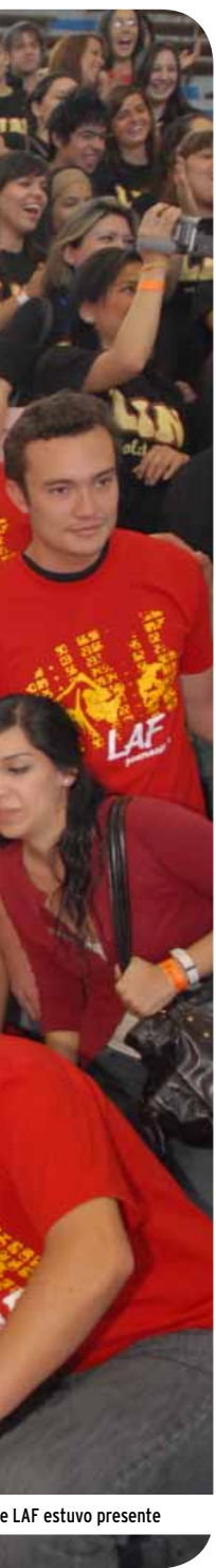
...e LAF estuvo presente