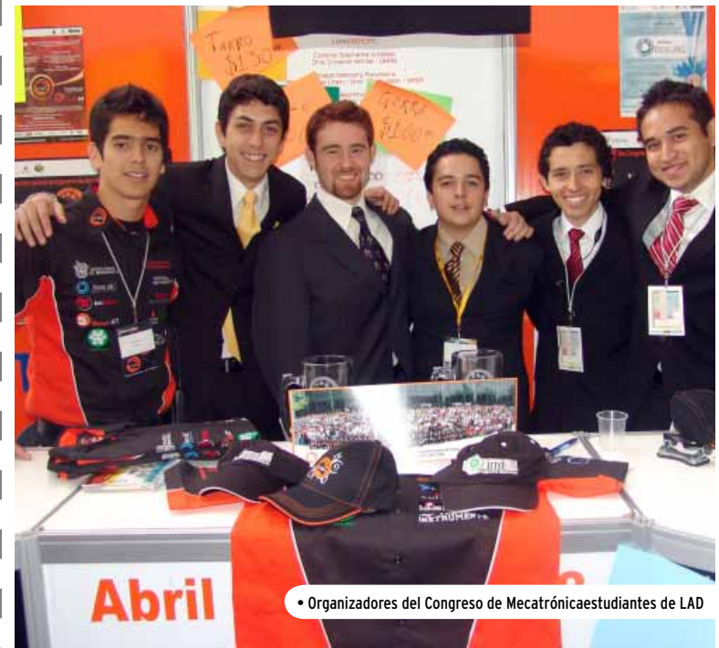
• Organizadores del Congreso de Mecatrónicaestudiantes de LAD

Con esto, la SAIMT logró organizar un evento de calidad que se espera continúe en los próximos años.