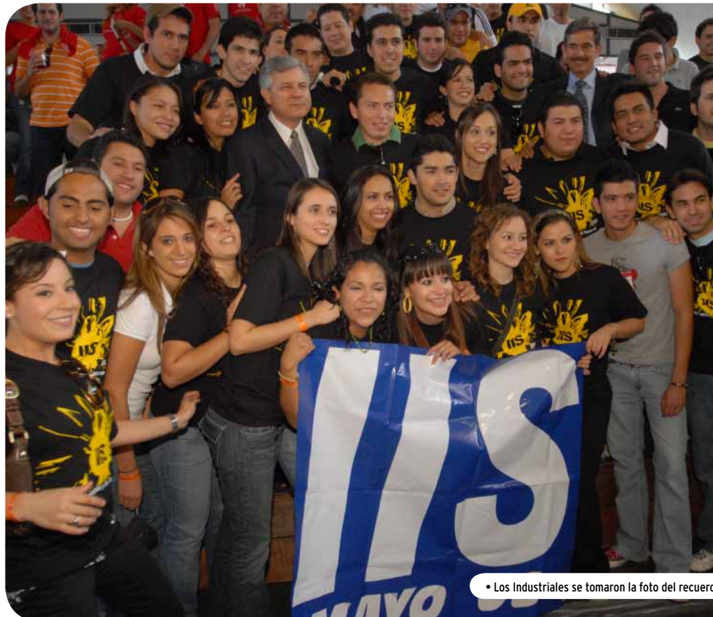
• Los Industriales se tomaron la foto del recuerdo