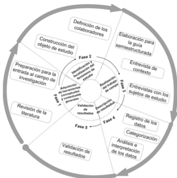
Figura 1. Método de investigación Descripción: El procesos de investigación se integró por cinco fases construidas a partir de las propuestas de McCurdy, Spradley y Shandy (2004) y Sandoval (2002).

La investigación se realizó desde el paradigma cualitativo, con enfoque interpretativo y con alcance comprensivo. El diseño de investigación se construyó tomando como referencia las aportaciones de McCurdy, Spradley y Shandy (2004) y Sandoval (2002), quienes definieron pasos para desarrollar el trabajo de campo y para conocer los fenómenos de estudio. La Figura 1 muestra una representación del proceso.