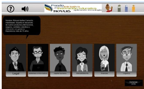
Figura 5. Principales roles de la empresa.

En la figura 5 se representan los principales roles identificados en una empresa, el encargado del área legal, el ingeniero en Sistemas, el experto en capital humano, la representante de mercadotecnia, la encargada de finanzas y el representante de logística. Cada personaje tiene información importante sobre la problemática en base al rol que tiene en la empresa, una vez seleccionados los personajes se iniciará la junta de consejo, ver figura 6.