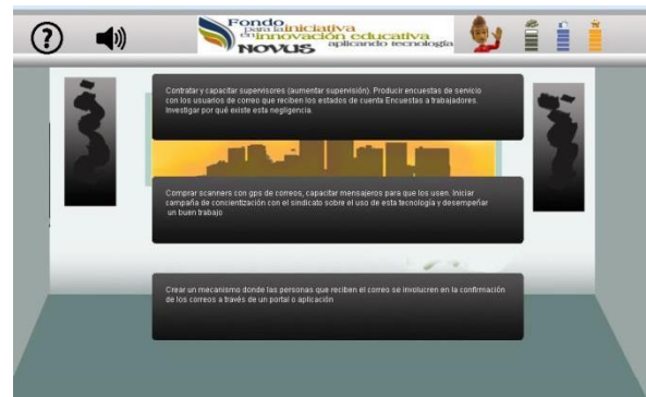
Figura 7. Posibles alternativas de solución.

Dependiendo de la alternativa que el jugador haya seleccionado obtendrá un puntaje, que puede incrementar o decrementar tres aspectos que se consideran primordiales en toda empresa: capital, clima laboral y prestigio.