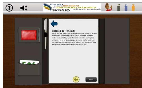
Figura 4. Descripción del caso.

La figura 3 muestra la pantalla inicial del juego, básicamente es una carpeta con tres casos cada uno con diferente nivel de complejidad. Una vez seleccionado el caso, al jugador se le presenta una segunda pantalla describiendo textualmente la problemática de ese caso, ejemplo de esta descripción se presenta en la figura 4.