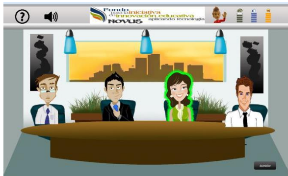
Figura 6. Participantes en la junta de consejo.

En la figura 5 se representan los principales roles identificados en una empresa, el encargado del área legal, el ingeniero en Sistemas, el experto en capital humano, la representante de mercadotecnia, la encargada de finanzas y el representante de logística. Cada personaje tiene información importante sobre la problemática en base al rol que tiene en la empresa, una vez seleccionados los personajes se iniciará la junta de consejo, ver figura 6.