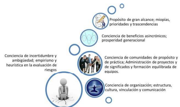
Figura 1. Modelo de saberes.

El modelo incluye once saberes que son presentados en las figuras 1 y 2: