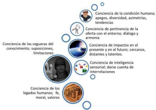
Figura 2. Modelo de saberes.

Los saberes listados en la figura 2, remarcan la necesidad de estar consciente de los impactos, la pertinencia y las consecuencias que pueden traer las decisiones que se tomen ante cierta problemática.