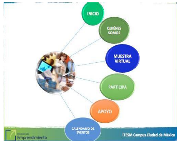
Figura 2. Secciones del Portal Emprendeweb.

El portal cuya dirección es http://www.emprendeweb.mx ; está conformado por seis secciones, ver Figura 2.