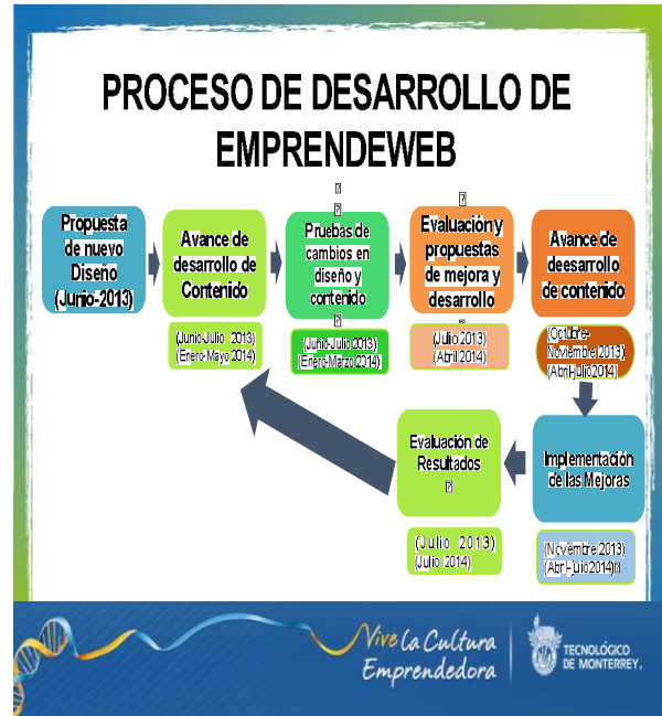
Figura 3. Esquema del Proceso de Desarrollo de EmprendeWeb.

Se siguió un proceso que incluyó propuestas, avances de desarrollo, pruebas, evaluación, implementación, evaluación y ajustes y nuevas propuestas. Para llevar a cabo este proceso además del respaldo de la empresa Kaitensoft quien llevó el proceso técnico, se tuvo el apoyo de alumnos de Comunicación, Tecnología de Información y Mercadotecnia, adicionalmente se tuvo el apoyo de profesores que permitieron validar con sus alumnos los procesos de mejora y en sus propuestas después de cada ejercicio que se llevó a cabo durante el período junio 2013 a julio 2014. En la Figura 3 se esquematiza este proceso en el tiempo.