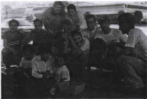
Alumnos del Tec de Monterrey y voluntarios forman el equipo de trabajo de PADI

programas con niños del área metropolitana de Monterrey.