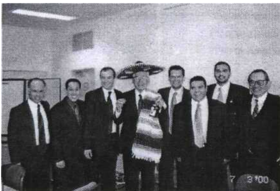
Las misiones comerciales se llevan a cabo en Centro América, Sudamérica, Asia y Europa

Con el objetivo primordial de promocionar los productos de la micro y pequeña empresa mexicana