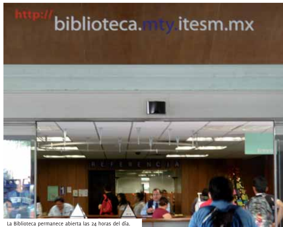
La Biblioteca permanece abierta las 24 horas del día.