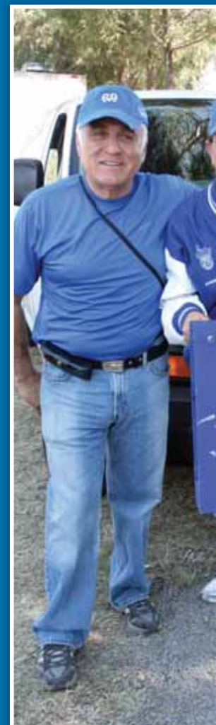
Integrantes de Tec Campus Puebla fueron a apoyar a los Borregos del Campus Monterrey