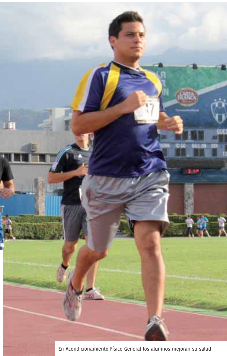
En Acondicionamiento Físico General los alumnos mejoran su salud