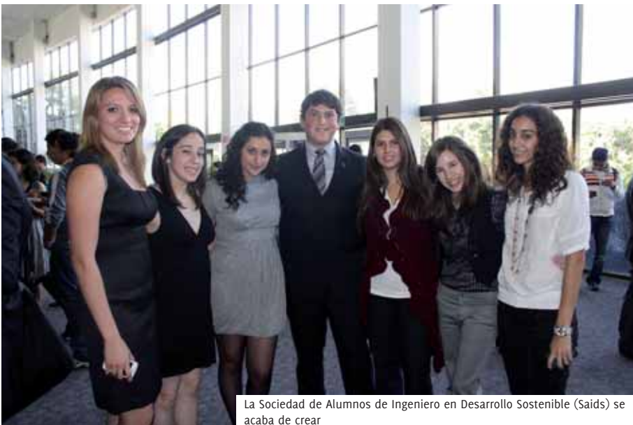
La Sociedad de Alumnos de Ingeniero en Desarrollo Sostenible (SaiDs) se acaba de crear