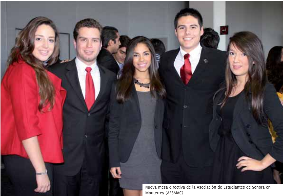
Nueva mesa directiva de la Asociación de Estudiantes de Sonora en Monterrey (AESMAC)