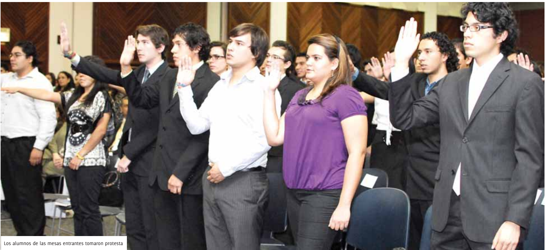
Los alumnos de las mesas entrantes tomaron protesta