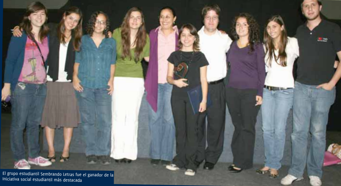
El grupo estudiantil Sembrando Letras fue el ganador de la Iniciativa social estudiantil más destacada