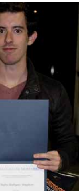
sobresalieron en Yoga