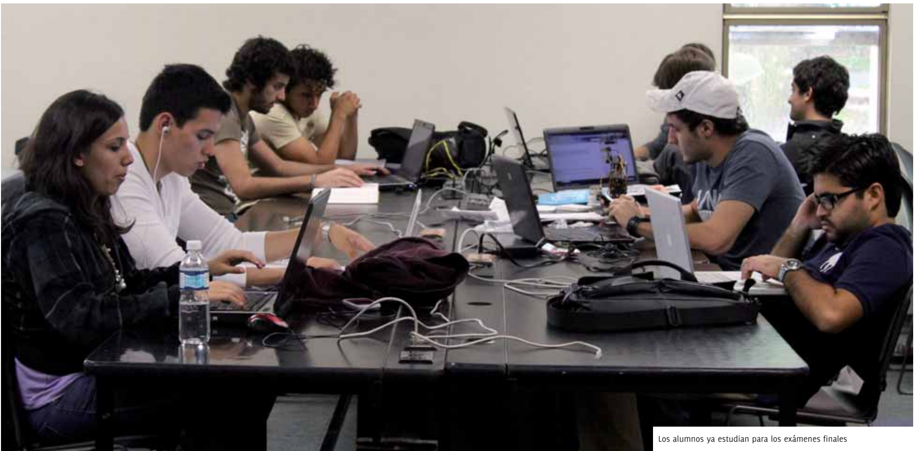
Los alumnos ya estudian para los exámenes finales