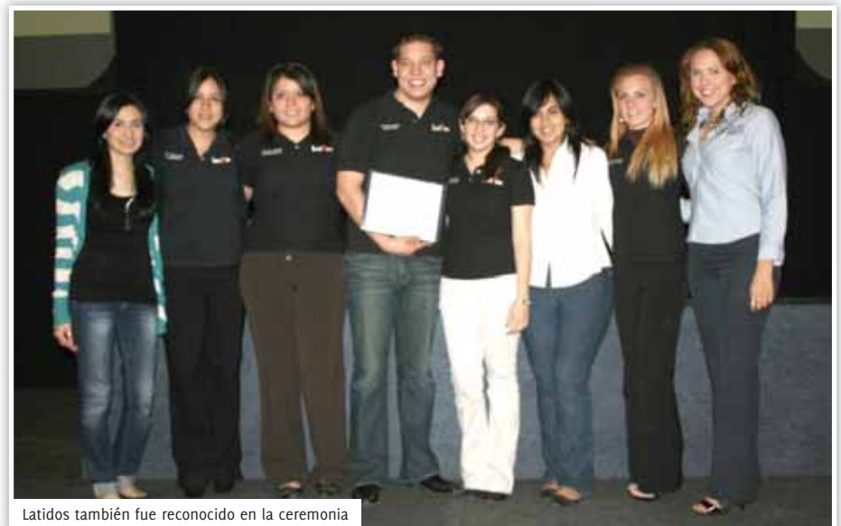
Latidos también fue reconocido en la ceremonia