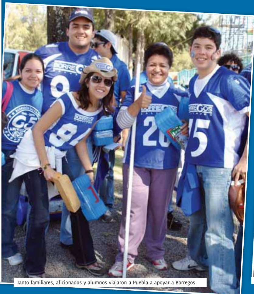
Tanto familiares, aficionados y alumnos viajaron a Puebla a apoyar a Borregos