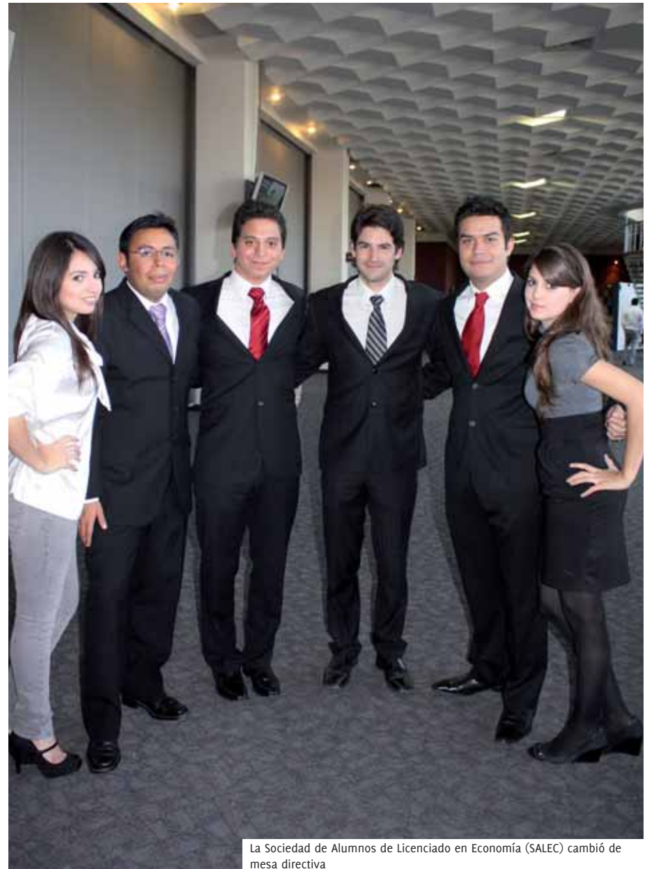
La Sociedad de Alumnos de Licenciado en Economía (SALEC) cambió de mesa directiva