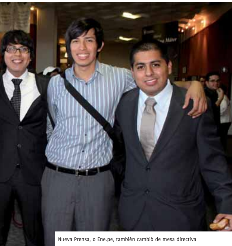
Nueva Prensa, o Ene.pe, también cambió de mesa directiva