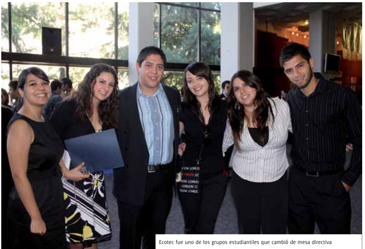
Ecotec fue uno de los grupos estudiantiles que cambió de mesa directiva