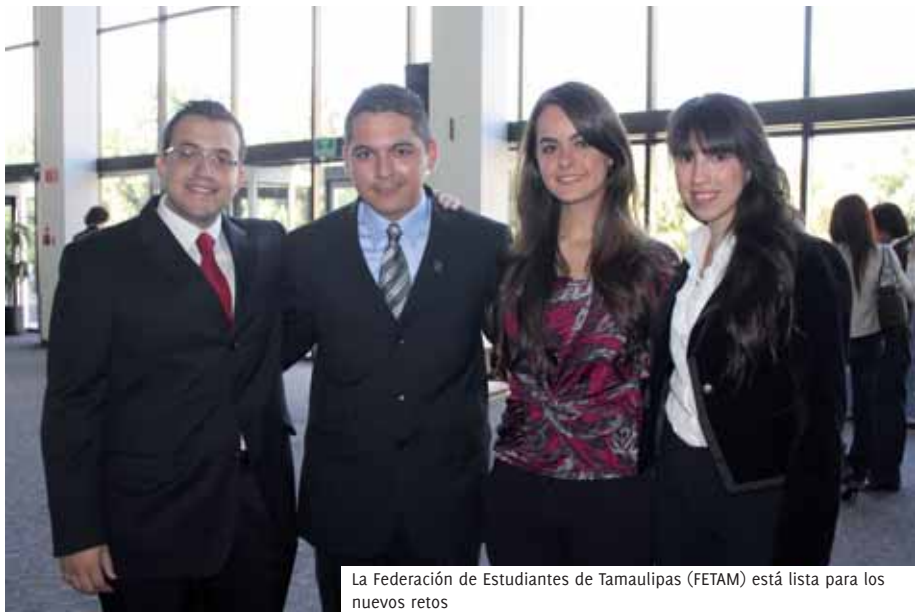
La Federación de Estudiantes de Tamaulipas (FETAM) está lista para los nuevos retos