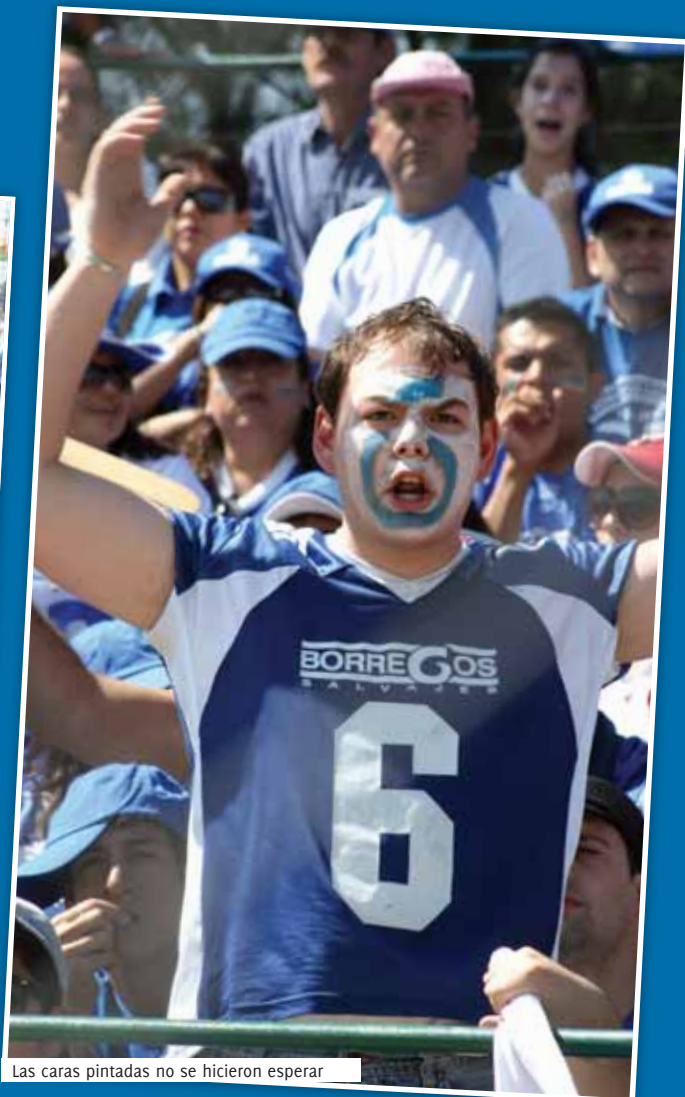
Las caras pintadas no se hicieron esperar