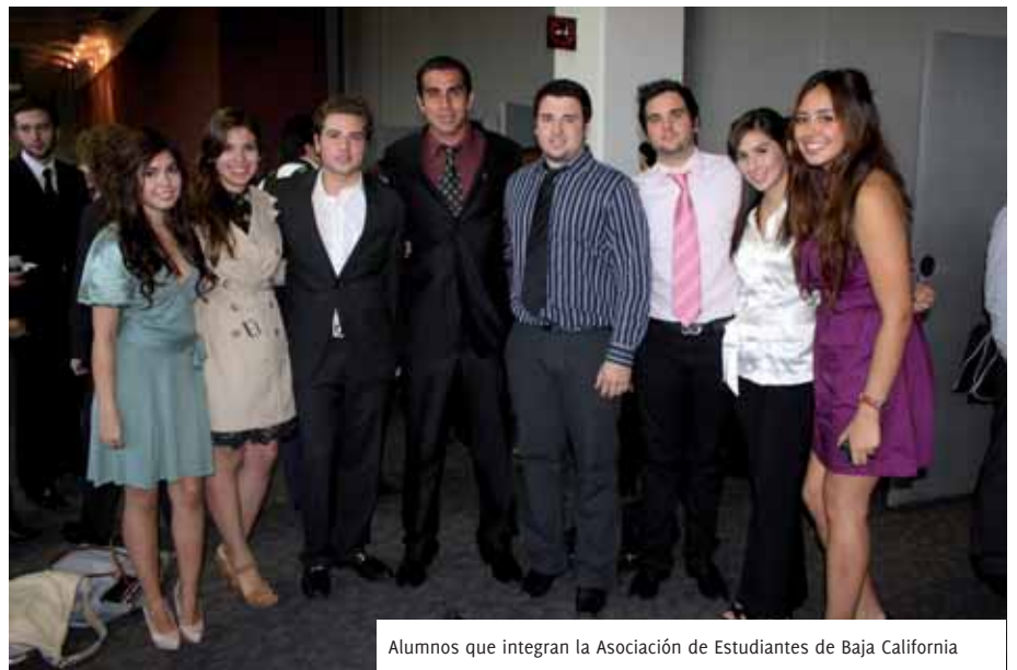
Alumnos que integran la Asociación de Estudiantes de Baja California