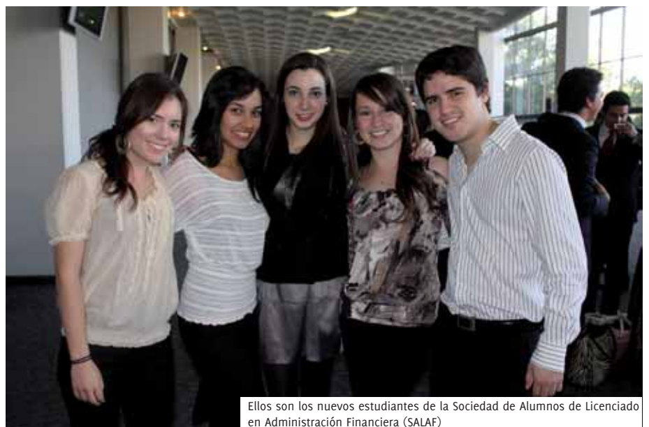
Ellos son los nuevos estudiantes de la Sociedad de Alumnos de Licenciado en Administración Financiera (SALAF)