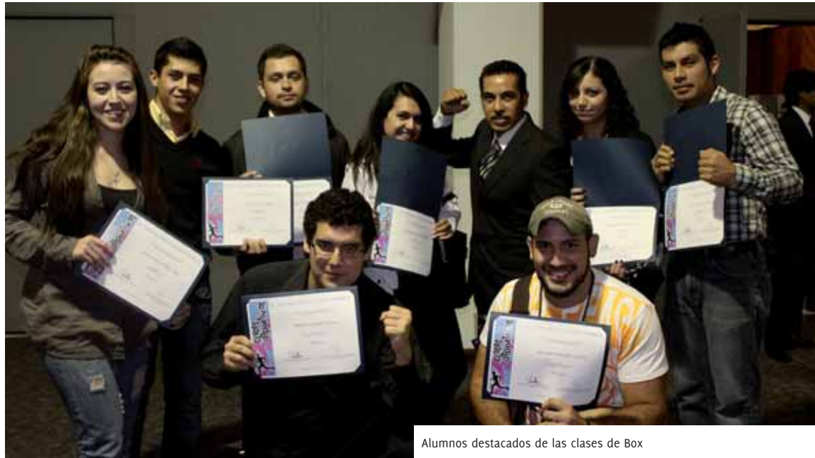
Alumnos destacados de las clases de Box