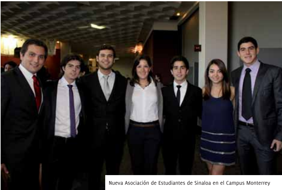
Nueva Asociación de Estudiantes de Sinaloa en el Campus Monterrey