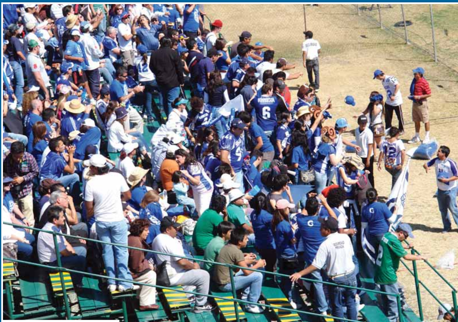
Antes de iniciar el partido se regalaron gorras

Una felicitación especial a la porra de residencias ya que mostró su lealtad durante toda la temporada incluyendo dos viajes por tierra hasta la ciudad de Puebla.