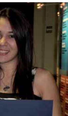
do, IIS, Zumba