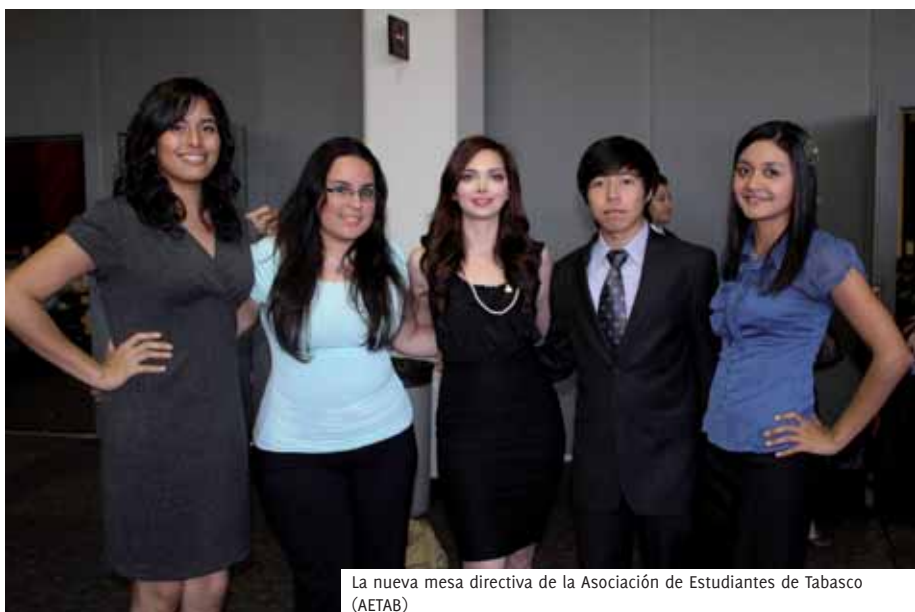
La nueva mesa directiva de la Asociación de Estudiantes de Tabasco (AETAB)