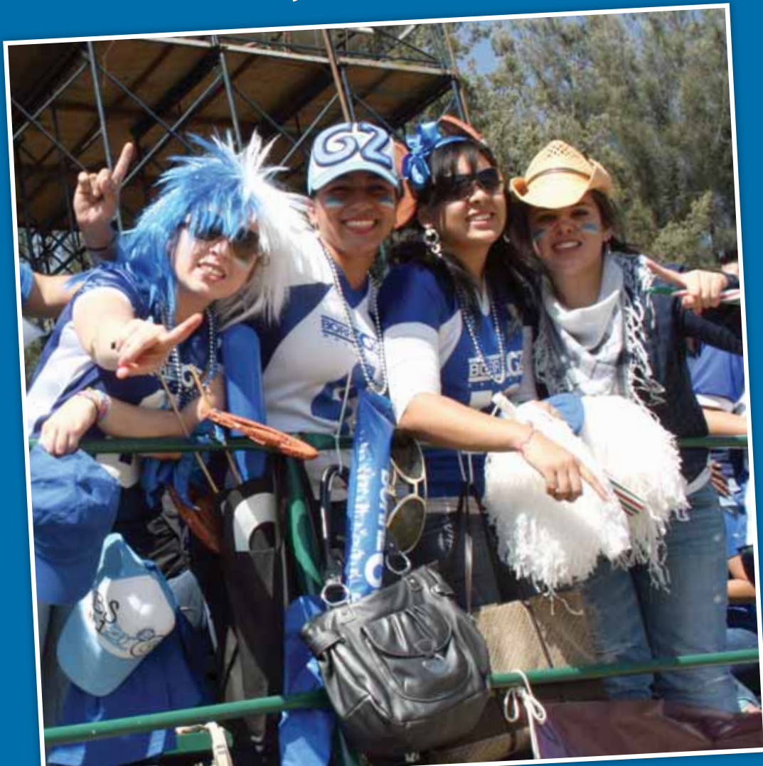
La afición de Borregos siempre estuvo apoyando al equipo

Aficionados de Borregos viajan en camión 13 horas a Cholula para asistir a la final de la Conferencia Premier