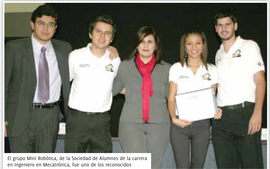
El grupo Mini Robótica, de la Sociedad de Alumnos de la carrera en Ingeniero en Mecatrónica, fue uno de los reconocidos