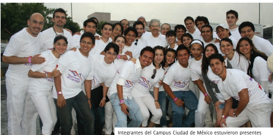
Integrantes del Campus Ciudad de México estuvieron presentes

tes caminaron pacíficamente por las avenidas que rodean al Campus Monterrey, y dieron inicio al Movimiento por el Cambio, que busca promover los valores en la comunidad y se adquiera un compromiso para mejorar la seguridad. A la marcha asistieron alumnos de diferentes campus de la Institución.