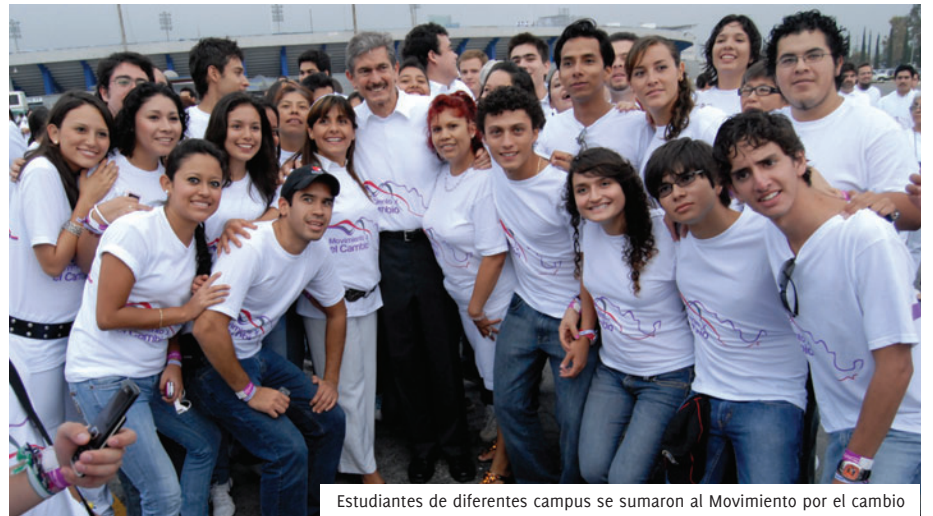
Estudiantes de diferentes campus se sumaron al Movimiento por el cambio