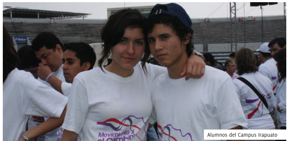
Alumnos del Campus Irapuato