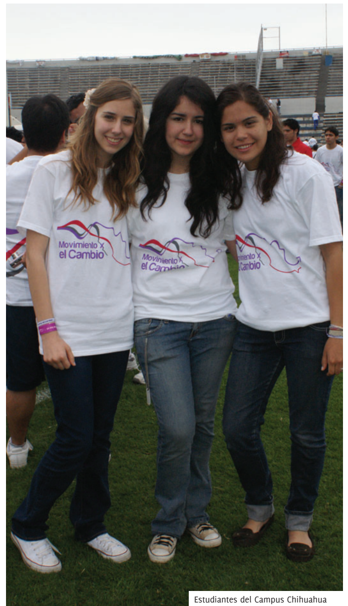
Estudiantes del Campus Chihuahua