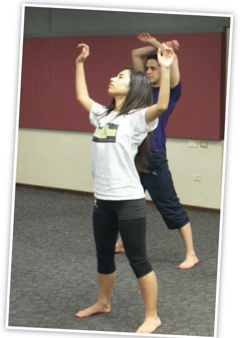
Una clase de danza contemporánea fue parte de las actividades de la comisión de Arte, Cultura y Entretenimiento

Ésta fue la primera ocasión en que se realizó este evento donde los presidentes de cada comisión trabajaron en conjunto para un bien común.