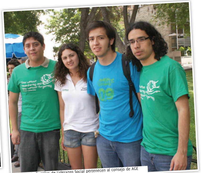
Grupos estudiantiles de Liderazgo Social pertenecen al consejo de AGE