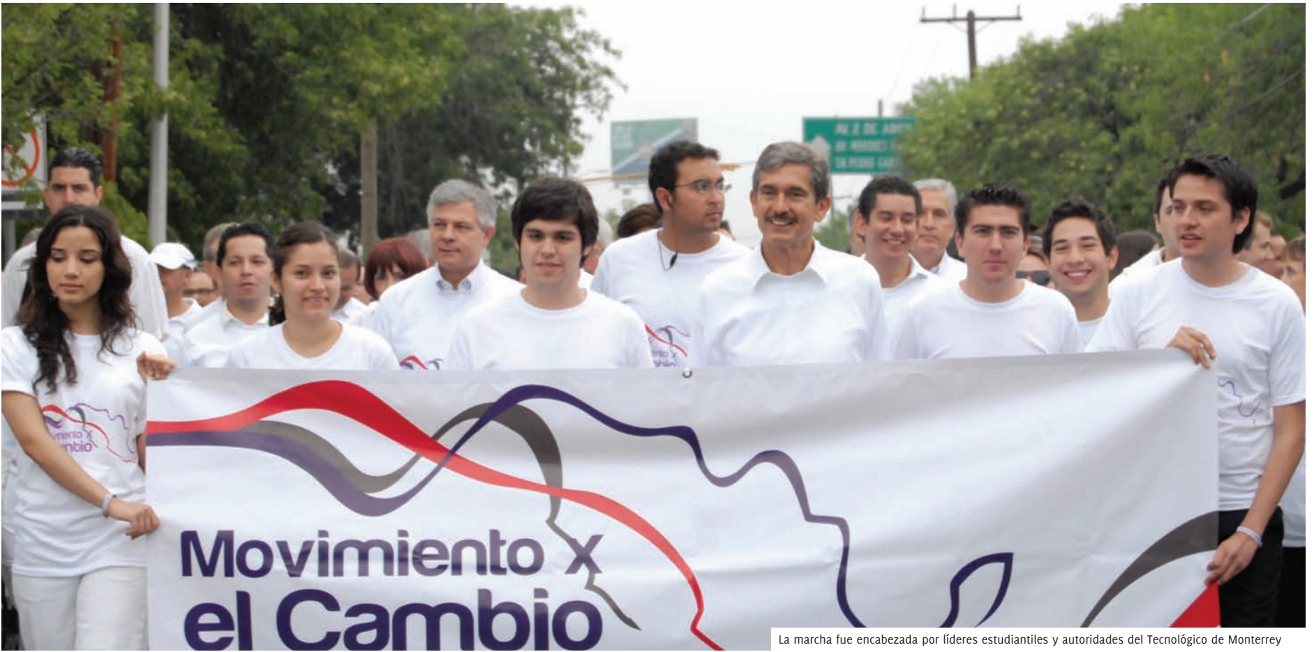
La marcha fue encabezada por líderes estudiantiles y autoridades del Tecnológico de Monterrey