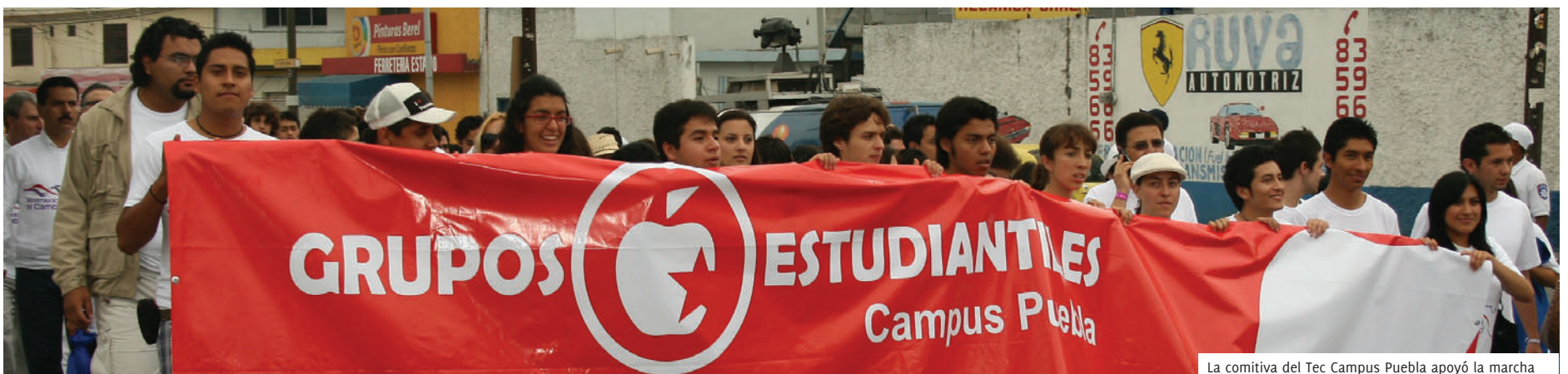
La comitiva del Tec Campus Puebla apoyó la marcha