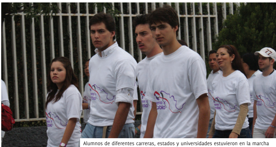
Alumnos de diferentes carreras, estados y universidades estuvieron en la marcha