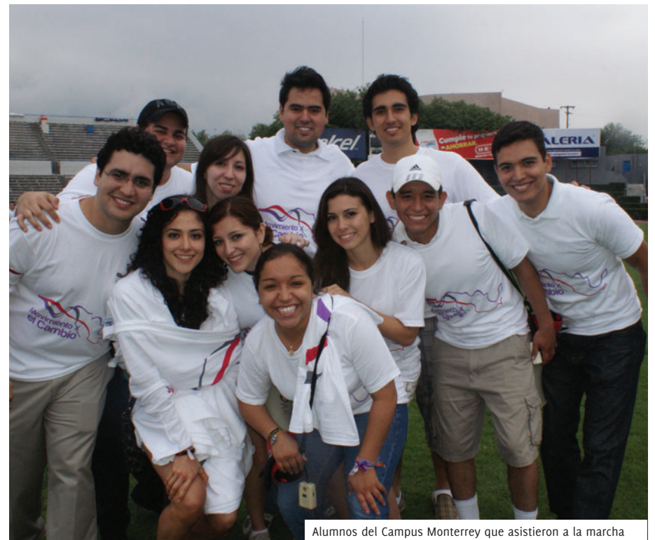
Alumnos del Campus Monterrey que asistieron a la marcha