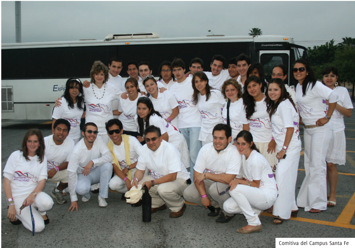
Comitiva del Campus Santa Fe