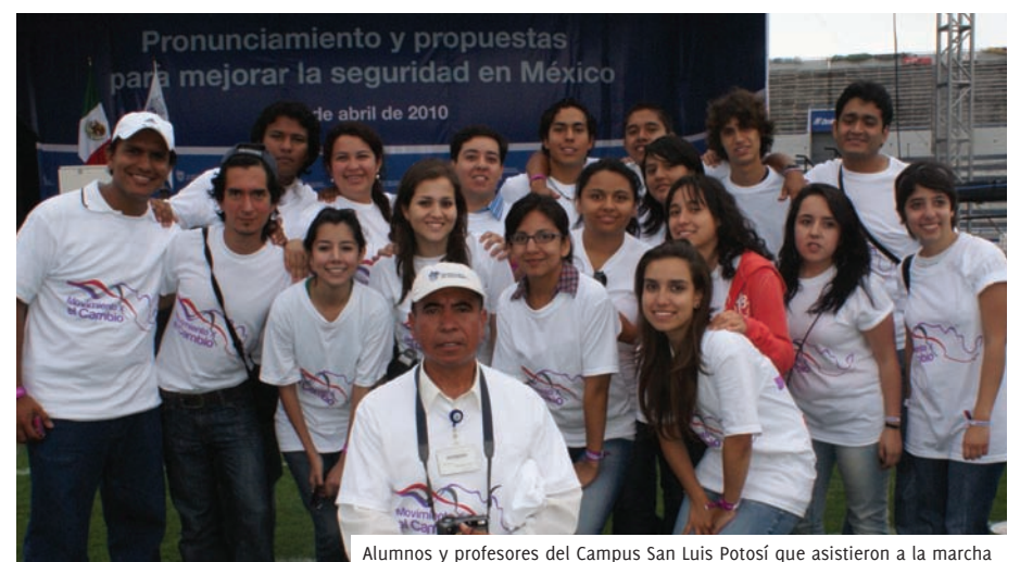
Alumnos y profesores del Campus San Luis Potosí que asistieron a la marcha