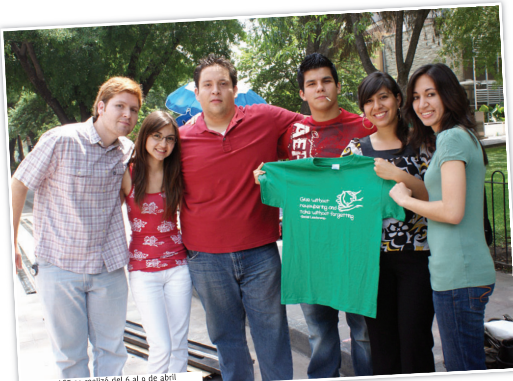
Semana AGE se realizó del 6 al 9 de abril