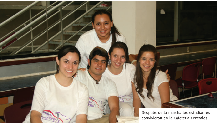
Después de la marcha los estudiantes convivieron en la Cafetería Centrales