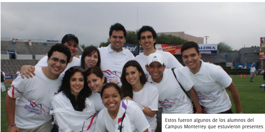
Estos fueron algunos de los alumnos del Campus Monterrey que estuvieron presentes