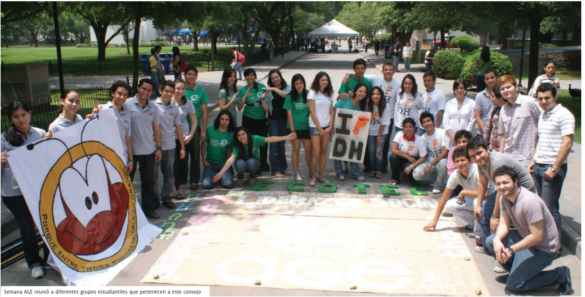
Semana AGE reunió a diferentes grupos estudiantiles que pertenecen a este consejo