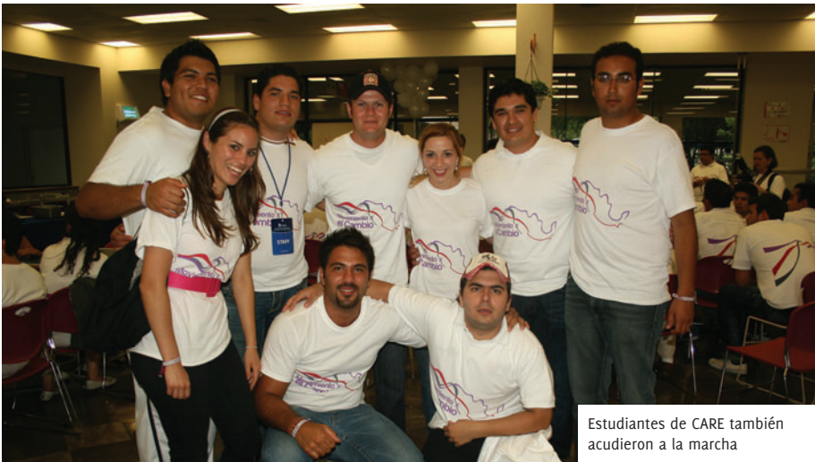
Estudiantes de CARE también acudieron a la marcha