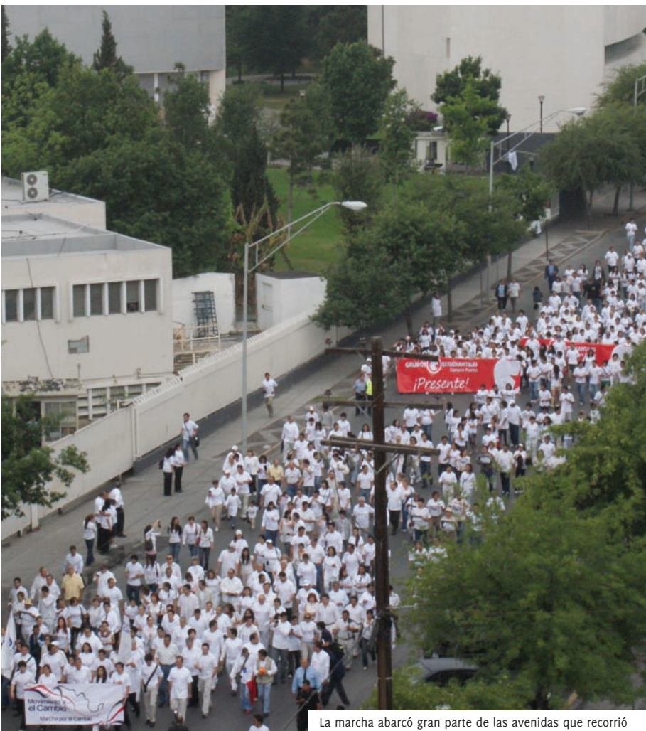
La marcha abarcó gran parte de las avenidas que recorrió