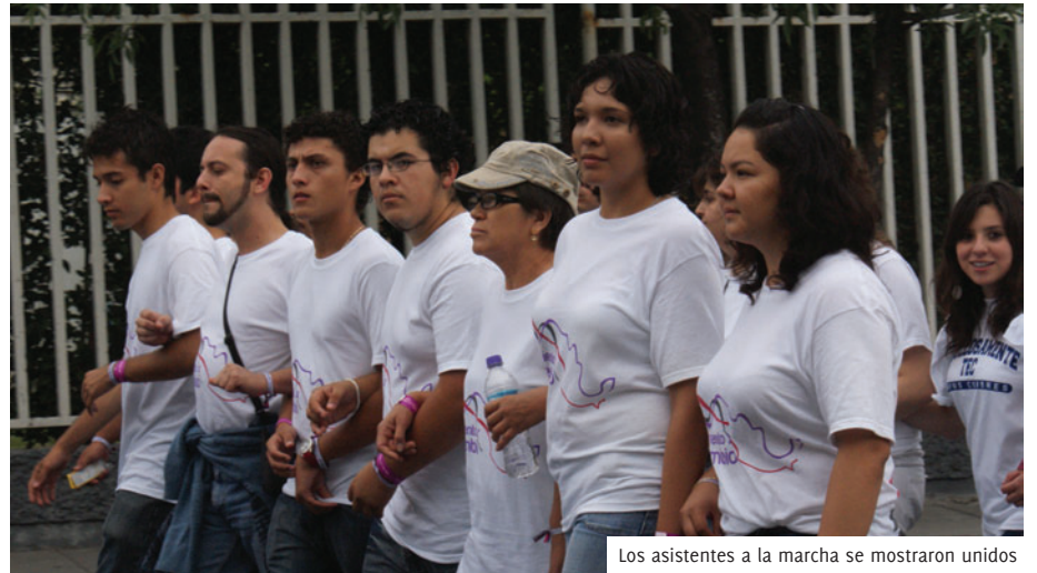
Los asistentes a la marcha se mostraron unidos