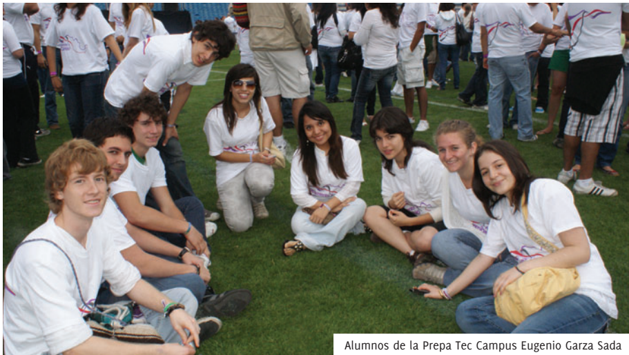
Alumnos de la Prepa Tec Campus Eugenio Garza Sada