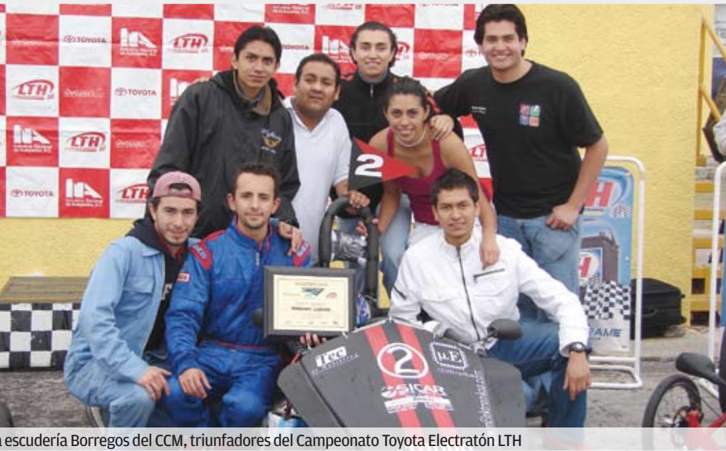
Escudería Borregos del CCM, triunfadores del Campeonato Toyota Electrón LTH