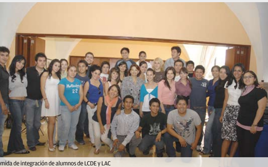
Comida de integración de alumnos de LCDE y LAC