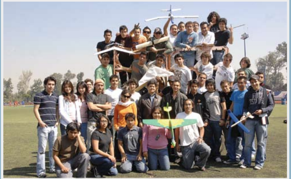
>Concurso de aeronáutica IME