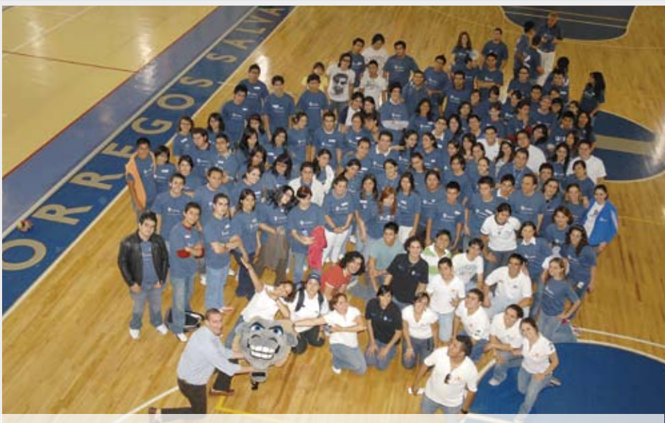
>Bienvenida a alumnos de nuevo ingreso