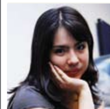
POR CITLALI ESTRELLA ESTUDIANTE DE PREPARATORIA PROGRAMA TRADICIONAL (PTB)