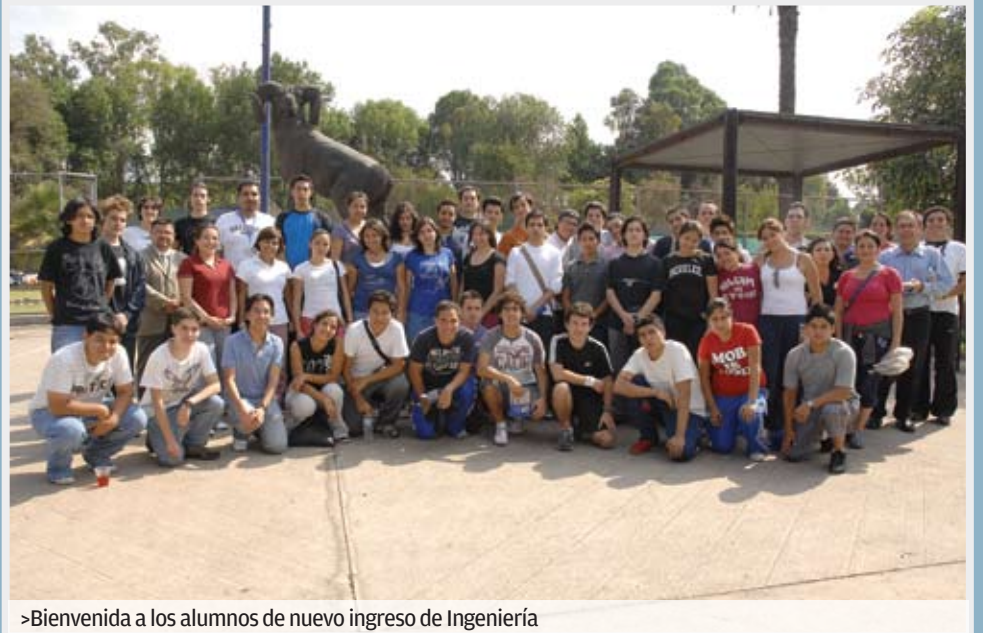
>Bienvenida a los alumnos de nuevo ingreso de Ingeniería