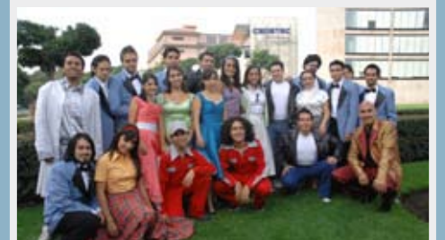
>Integrantes de Vaseline