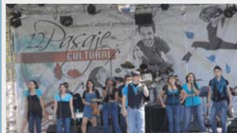
>Pasaje Cultural en Six Flags