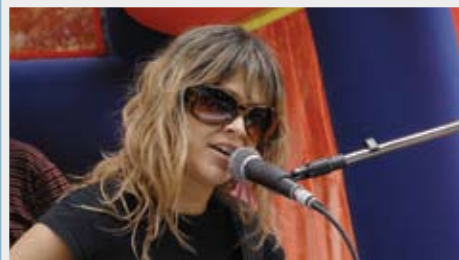
>Festejo de Fiestas Patrias de Concepto Radial