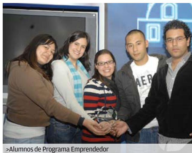
>Alumnos de Programa Emprendedor