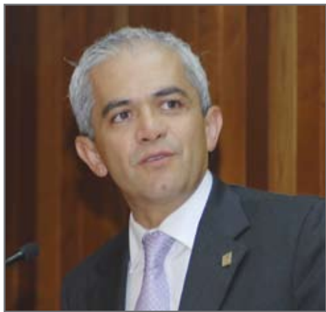
>Dr. Miguel Ángel Mancera