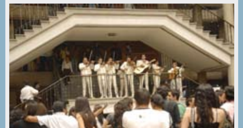
>Mariachi de fin de semestre