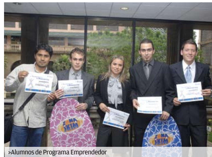
>Alumnos de Programa Emprendedor