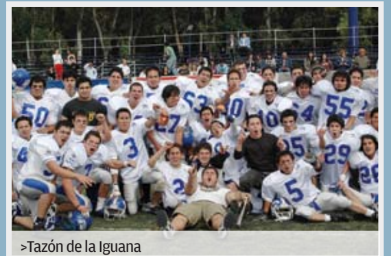
>Tazón de la Iguana