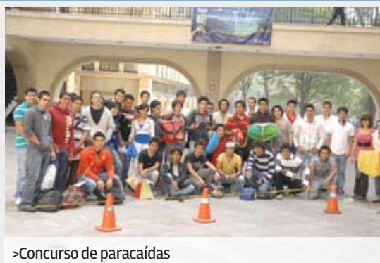
>Concurso de paracaídas