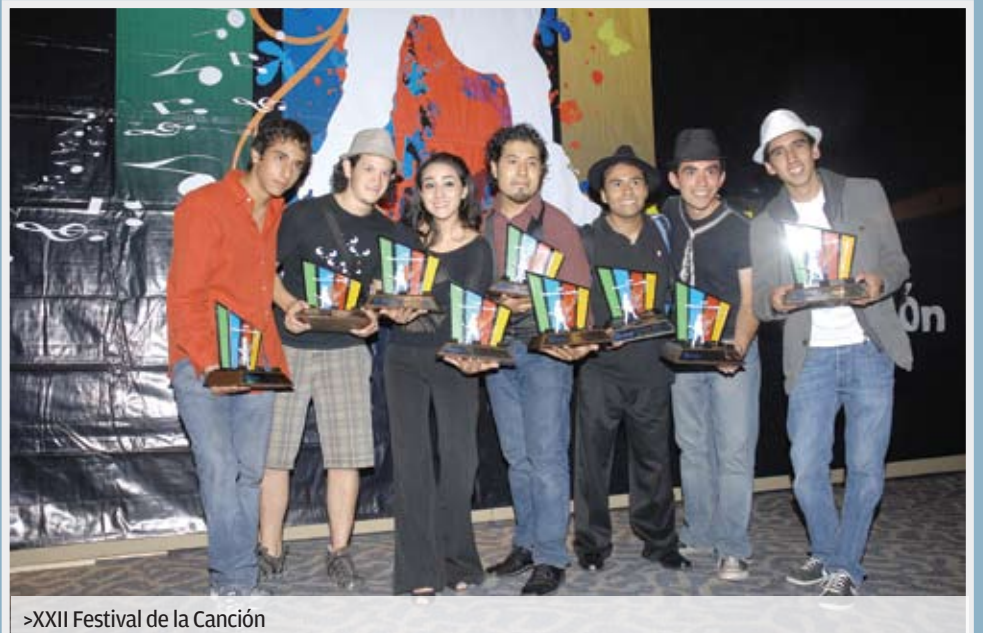
>XXII Festival de la Canción