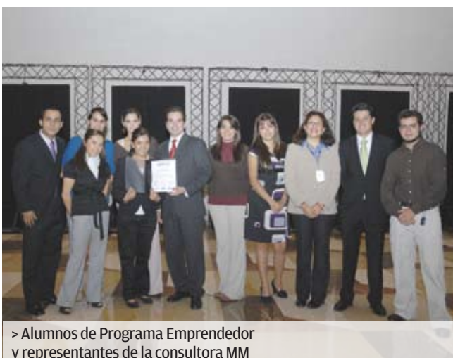
> Alumnos de Programa Emprendedor y representantes de la consultora MM