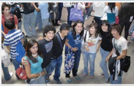
>Bienvenida de Preparatoria