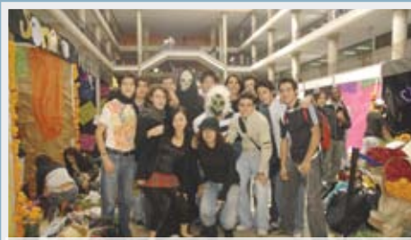
>Ofrendas del Día de Muertos en Preparatoria