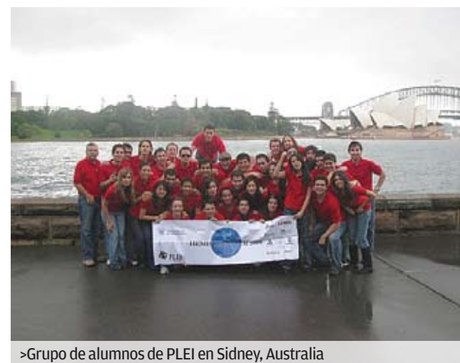
>Grupo de alumnos de PLEI en Sidney, Australia