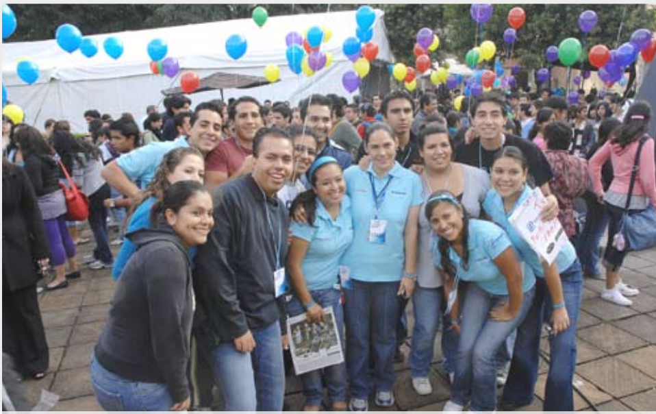
>Convivencia en el 35 Aniversario del Campus Ciudad de México