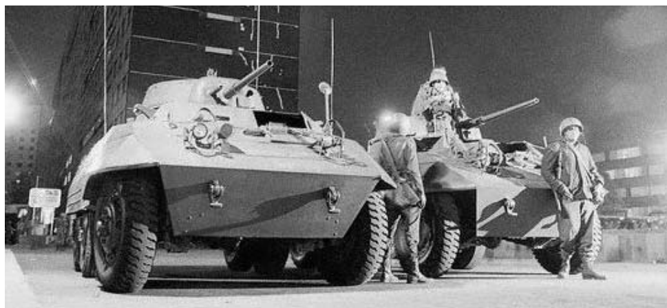
>Ejército mexicano en Tlatelolco

En octubre de 2009 se cumplen 41 años de la masacre a estudiantes quienes se manifestaban en la plaza de Tlatelolco, hecho que marcó un antes y un después en la historia contemporánea de México y en los medios de comunicación mexicanos.