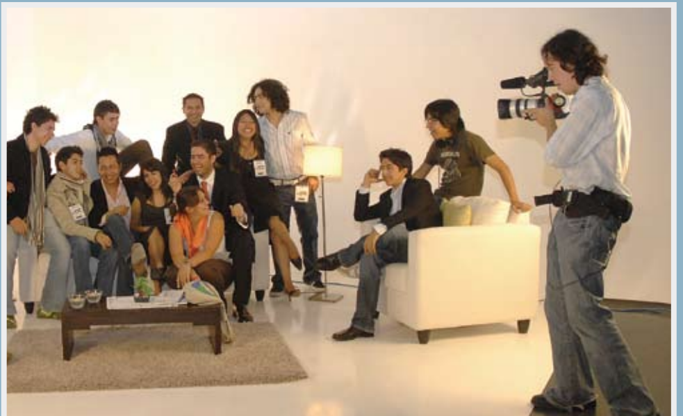
>Inauguración de las instalaciones de Centro de Innovación Multimedia

Estas páginas muestran más de cien rostros felices y satisfechos por los resultados del esfuerzo, por el duro trabajo que da fruto y por la solidaridad humana que nos permite llamarnos "civilización". Enhorabuena, integrantes del Campus Ciudad de México, esta es una prueba más de una labor incansable.