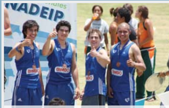
>Integrantes del equipo de Atletismo