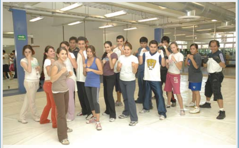
>Integrantes del taller de kick boxing