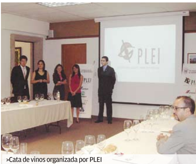
>Cata de vinos organizada por PLEI

Como ves, hay un sinnúmero de oportunidades que puedes aprovechar desde tu vida universitaria para formar competencias laborales. Graduarte con tu título profesional es un requisito básico pero, además, lo que los empleadores buscan de ti es la capacidad para trabajar con un espíritu emprendedor.