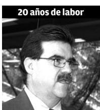
20 años de labor

“Yo amo al Tec y amo lo que hace el Tec y es ese el sentimiento que más me ha llenado”.