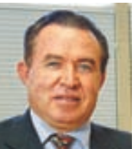
“Lo más importante es sembrar el concepto de ayudar a los demás, ya que en su vida profesional, los alumnos van a tener excelentes oportunidades de contribuir con la comunidad que los rodea para desarrollarla”.