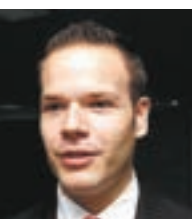
“Estamos avanzando a pasos agigantados en responsabilidad y compromiso con el sector público y privado. Que mejor que empezar con nosotros mismos encontrando nuevas formas de ayuda dentro de la Institución”.