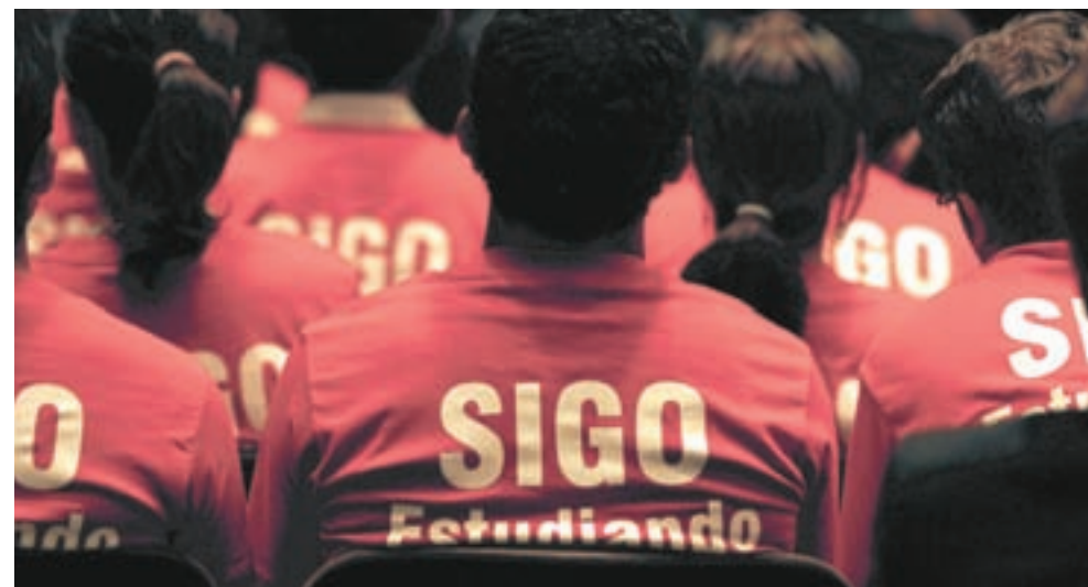
> La labor filantrópica crea un círculo virtuoso que deja secuelas, por eso es importante fomentarla en la juventud, tal como se ha hecho a través de la Red de Filantropía.