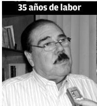
35 años de labor

“Para mí representa el estar con una familia que se ha formado con los mismos objetivos, el hacer amistades, el recibir muestras de afecto de los alumnos que se van y de pronto te mandan una carta o un correo electrónico diciéndote: gracias maestro”.