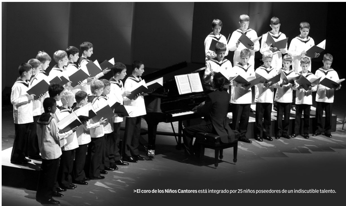
>El coro de los Niños Cantores está integrado por 25 niños poseedores de un indiscutible talento.