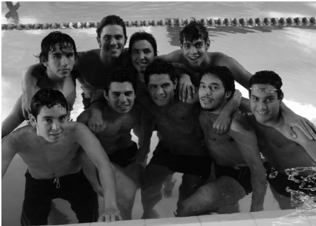
>Integrantes del equipo de natación varonil buscarán el sexto campeonato nacional Conadeip consecutivo.