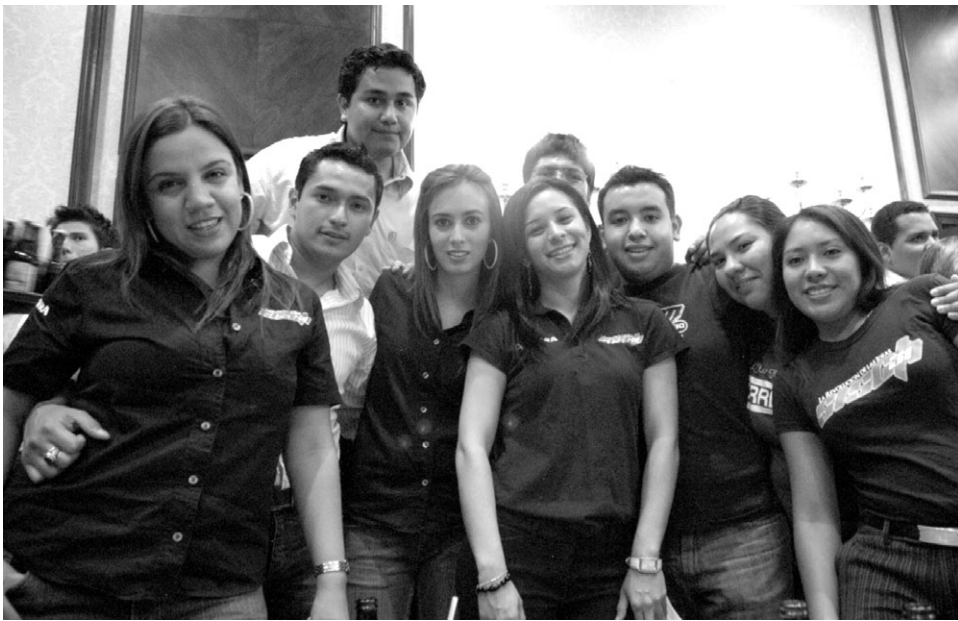
> Los ganadores fueron reconocidos por su dedicación y liderazgo en las actividades estudiantiles.