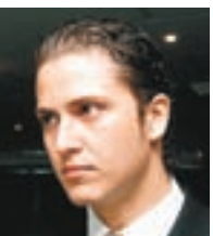
“Difundir la filantropía en toda la comunidad estudiantil significa que podremos darle la oportunidad a alumnos destacados de sostenerlos económicamente durante el tiempo que dure la carrera”.