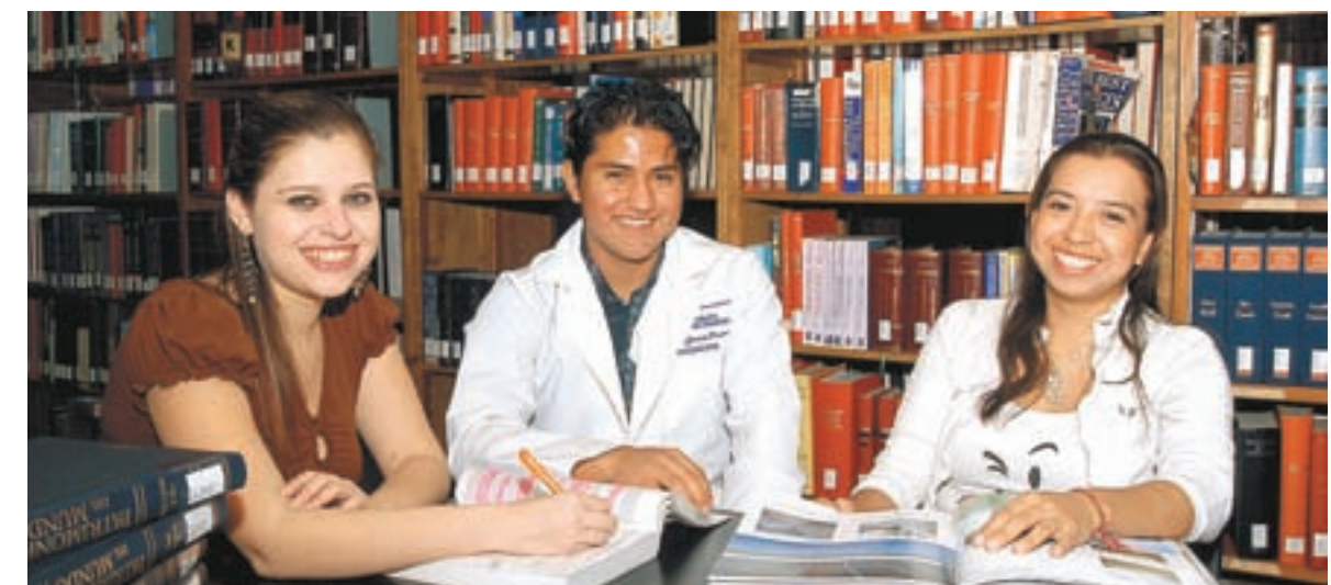
> Gracias a las labores filantrópicas realizadas en el Tecnológico de Monterrey, alumnos de alto rendimiento académico con escasos recursos económicos pueden continuar sus estudios.