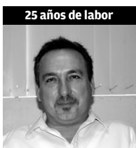
25 años de labor

“Es un gran logro, se dice fácil, parece fácil, pero vistos desde atrás acumulados, si son muchos años de trabajo, que se han vivido a gusto”.