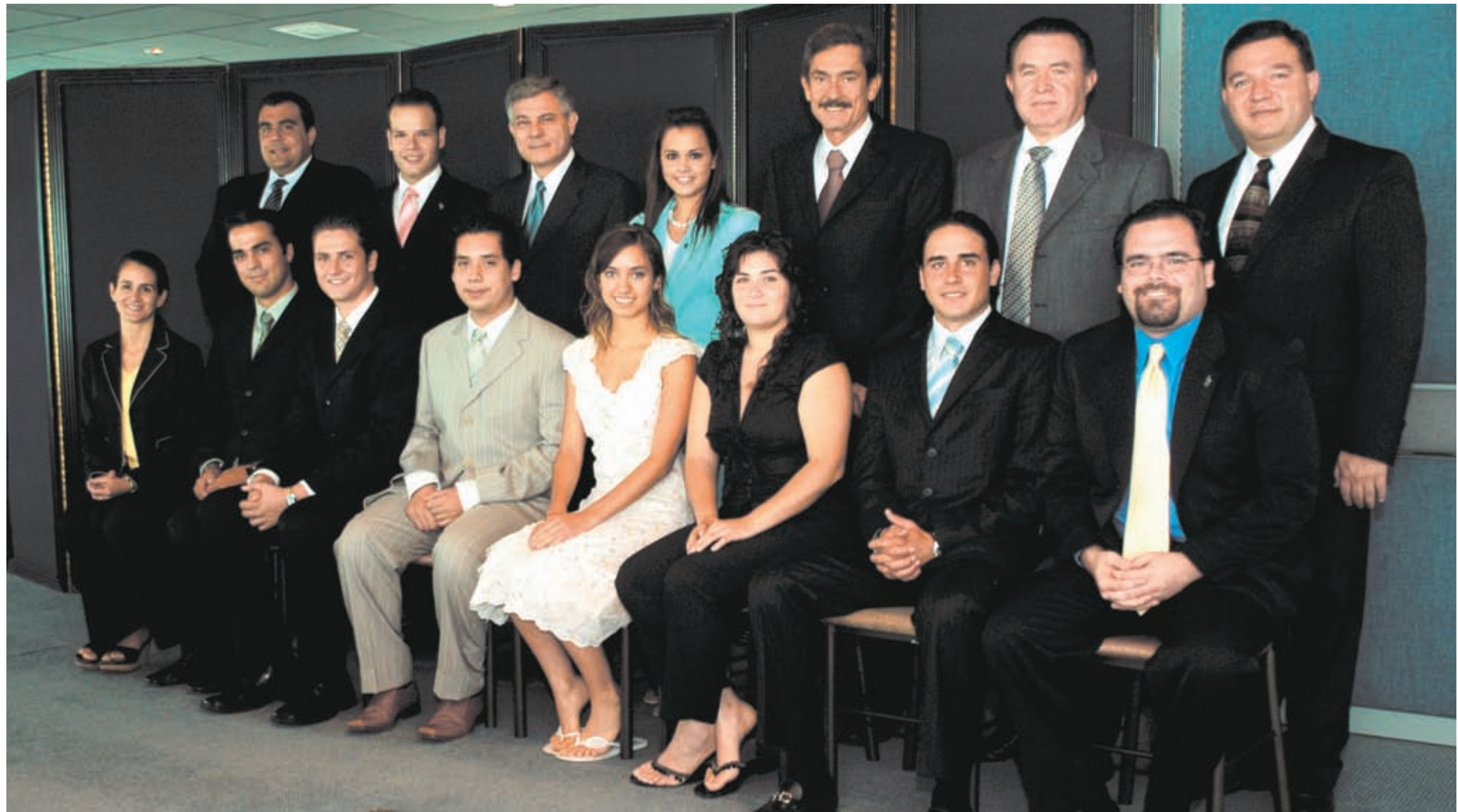
> El Consejo Estudiantil de Filantropía se reunió con directivos del Tecnológico de Monterrey para rendir su informe y trazar las próximas metas.