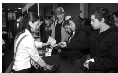
> Los congresos estudiantiles son unos de los eventos más esperados