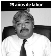
25 años de labor

“A nivel personal, me gusta porque he tenido la oportunidad de realizarme como profesional. Es una meta que no se espera tener, pero cuando se cumple se siente mucha satisfacción, ojalá pudiera llegar a los 30 o más”.