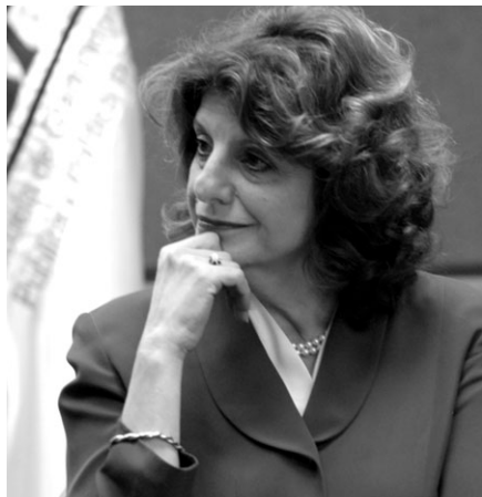
>Dra. Lourdes Dieck, embajadora de México ante la Unión Europea.