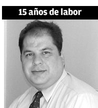
15 años de labor

“Representa el esfuerzo y dedicación para la orientación de los alumnos y para que se enfoquen a lo más importante, su estudio”.