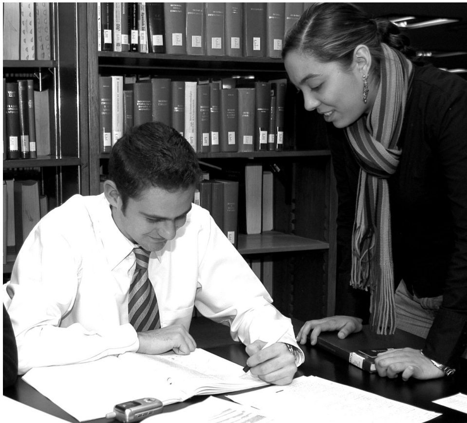
>La calidad académica es la estrategia de la Misión 2015 a la que más se ha enfocado la Institución en el 2006.

Actualmente, el Tecnológico concentra sus esfuerzos en la primera estrategia: asegurar la calidad académica y enriquecer el modelo educativo. El doctor Rangel dijo que en este tenor se trabaja diariamente, vigilando que los procesos se realicen correctamente.