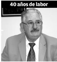
40 años de labor

“Representa Una etapa de realización y logros personales profesionales, y sobre todo el de poder servir, servir con calidad, el de dar lo mejor de ti para la Institución y para la gente que trabajamos, ésa ha sido la labor más trascendente que yo he observado en estos 40 años: el servicio”.