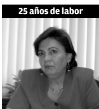
25 años de labor

“Estoy contenta y satisfecha, sobre todo con la gente con la que he trabajado y de los proyectos que hemos sacado”.