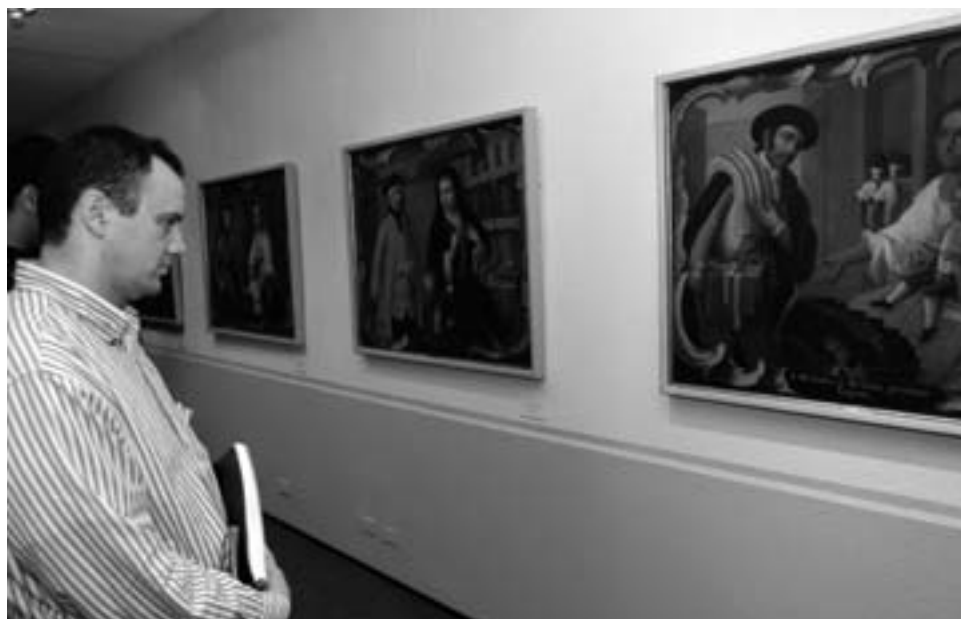
> La exposición permanecerá en el 2° piso de Biblioteca hasta el 15 de diciembre.