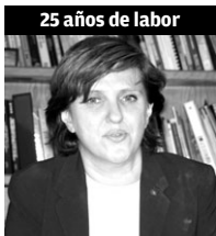
25 años de labor

“El Tecnológico es mi alma mater, el recinto con el que he convivido con tantos alumnos y tantos proyectos, ha sido la casa en la que he convivido con personas y proyectos. En tu estancia aquí, vas acumulando experiencias, pero a la vez cada día presentas retos diferentes, no siento que haya pasado tanto tiempo”.