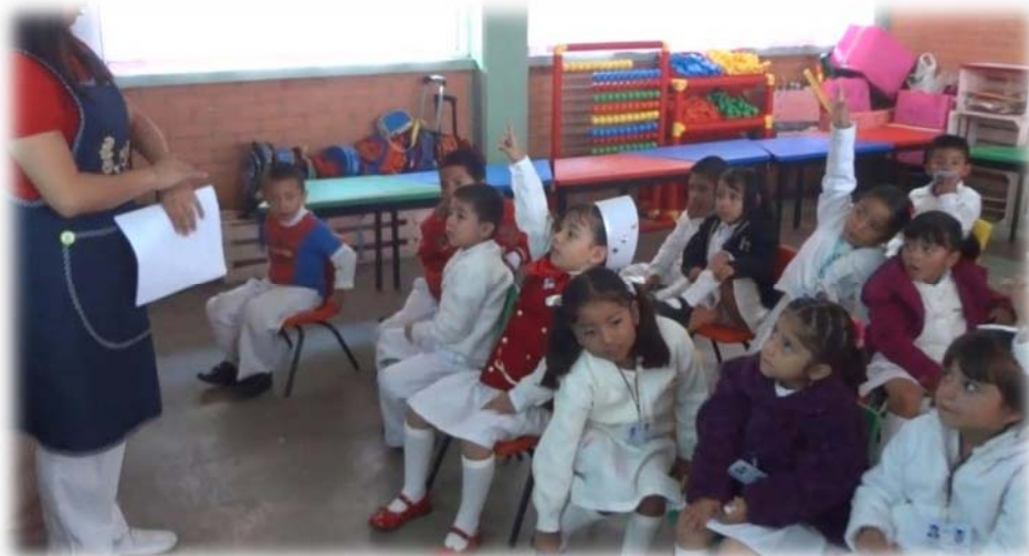
Figura 1. Alumnos del grupo tercero “C” en la lección 1 “eso no se vale”

La lección duro alrededor 30 minutos, concluyendo a las 9:00 de la mañana.