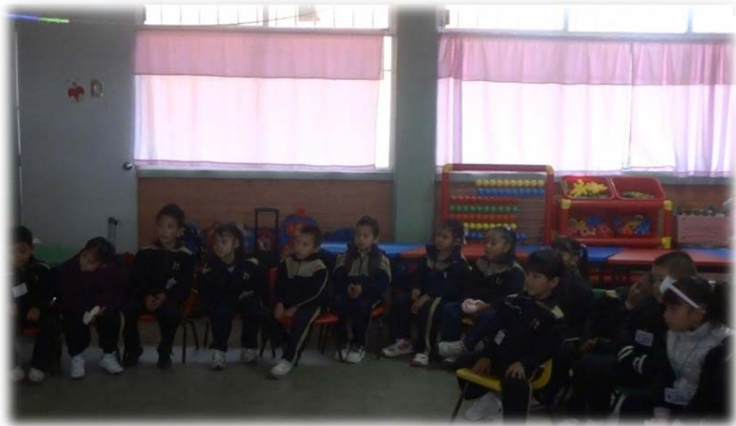
Figura 5 Los niños de grupo de tercero “C” en la lección 5 “La voz de la conciencia”