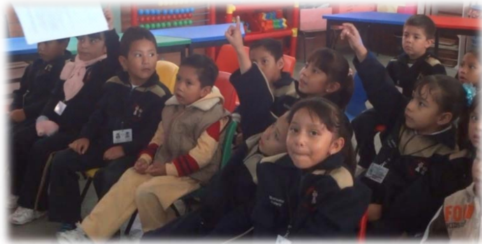
Figura 3. Los niños de grupo de tercero “C” en la lección tres “Tú me haces sentir seguro”

La educadora da una pequeña explicación sobre la familia y como esta da seguridad N6. La familia nos cuida para que no nos pase nada. La D1 se apoya de la presentación para dar ejemplos. Los niños reconocen a aquellas personas con las que se sienten seguros, en este caso son los padres. Posteriormente la educadora les indica que leerá un dilema, mientras ella lo hace los niños se muestran interesados. En este momento pregunta ¿si ellos saben que son las películas pirata? N13. Contesta muy seguro, cuando luchan los piratas. La D1 da una pequeña explicación de que es una película pirata. N1. Después de escuchar la definición de película pirata por parte de la educadora comenta; es como grabado de cine. La educadora al terminar de leer el dilema lanzo la pregunta para saber que pensaban sobre el punto de que la mamá de Miguel le pidió a su hijo que ya no se junte con Alicia.