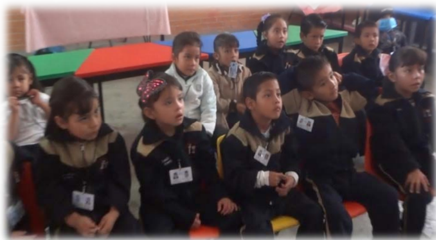
Figura 2. Los niños de grupo de tercero “C” en la lección 2 “Tú y tu cuerpo, tú y tu mente”

Posteriormente la educadora les dice que va a leer este dilema y que lo escuchen y posteriormente van a comentar que fue lo que paso. La educadora empieza a leer el dilema... los niños cambian su actitud y ya se observan muy atentos a las imágenes, pensativos a lo que la educadora está leyendo (dilema).