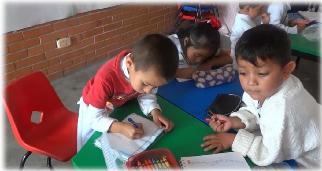
Figura 4. Los niños de grupo de tercero “C” en la lección 4 “La tecnología y el ser humano”

Me gusto que mi maestra me leyera ese cuento.