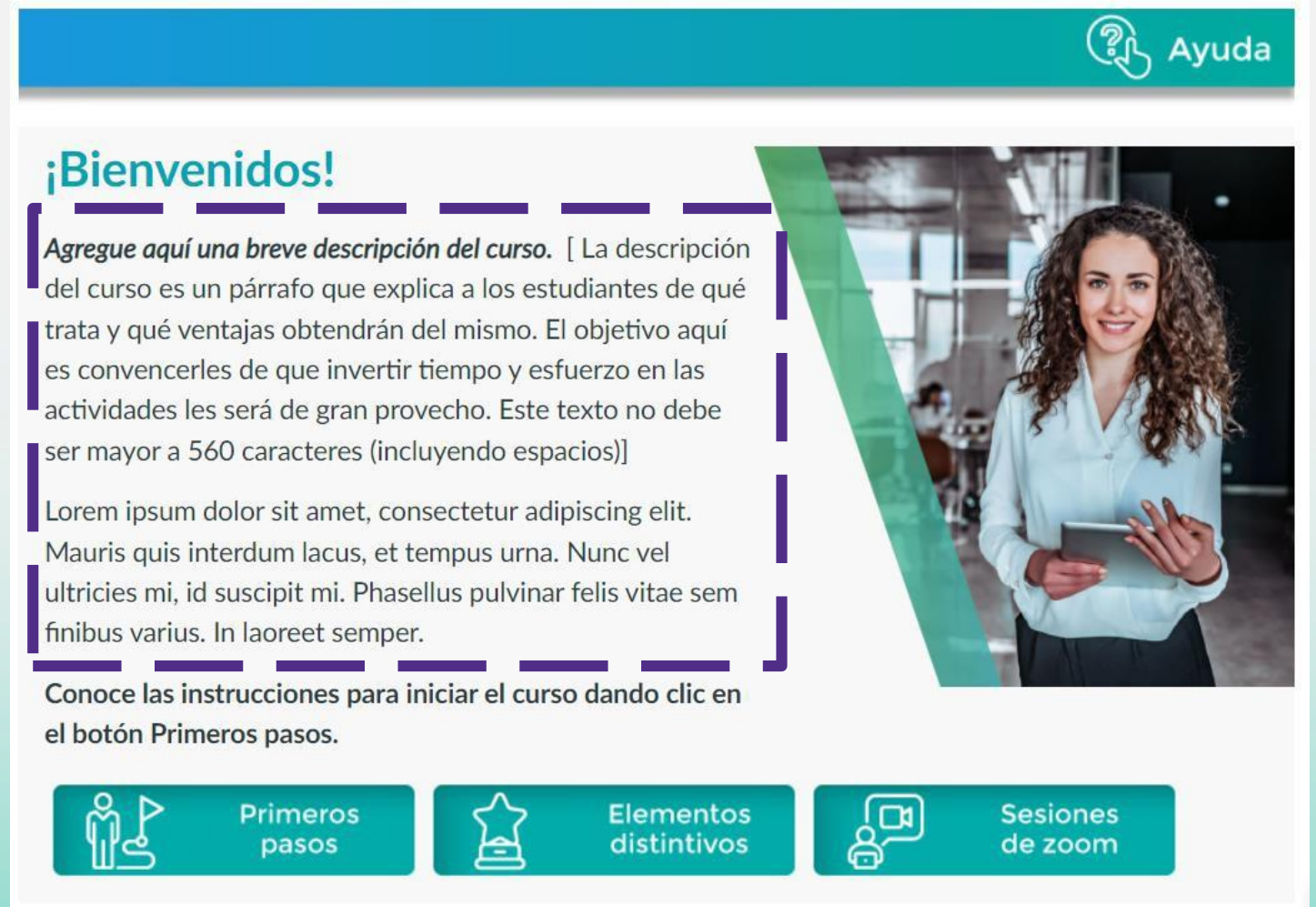
Imagen para fines ilustrativos basada en la Plantilla Institucional de Posgrado. En caso de que el curso cuente con otra plantilla, no se agrega una descripción del curso.

Debemos reemplazar el texto siguiendo las direcciones que se indican en la plantilla.