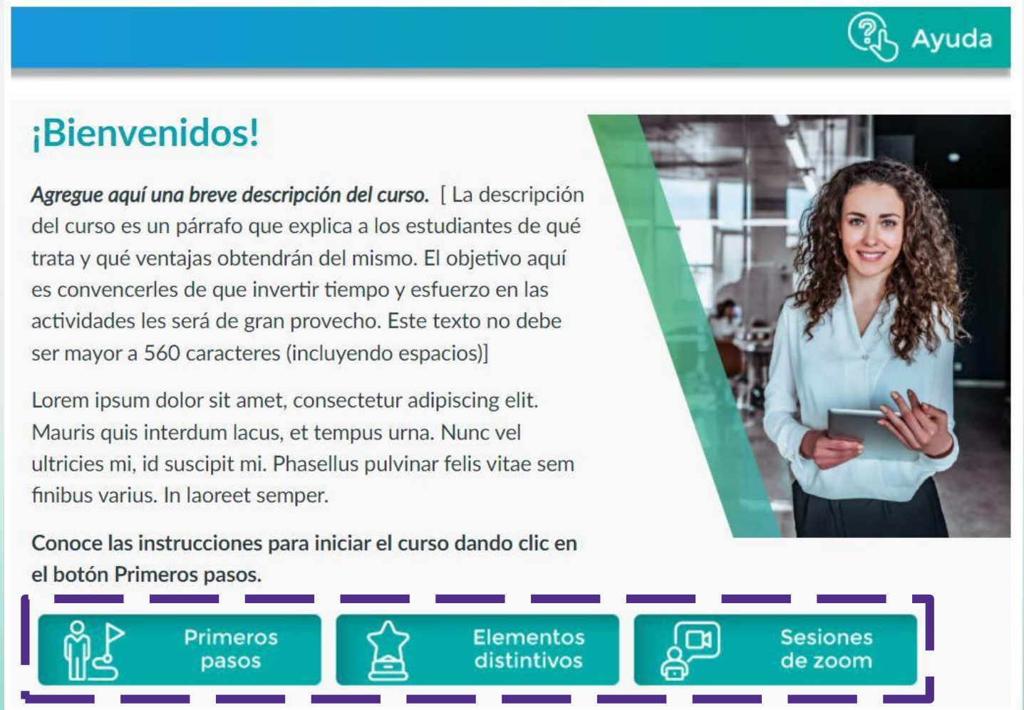
Imagen para fines ilustrativos basada en la Plantilla Institucional de Posgrado. En caso de que el curso cuente con otra plantilla, completar la información de las páginas ligadas a los botones principales.

El contenido en el botón Ayuda no requiere cambios.