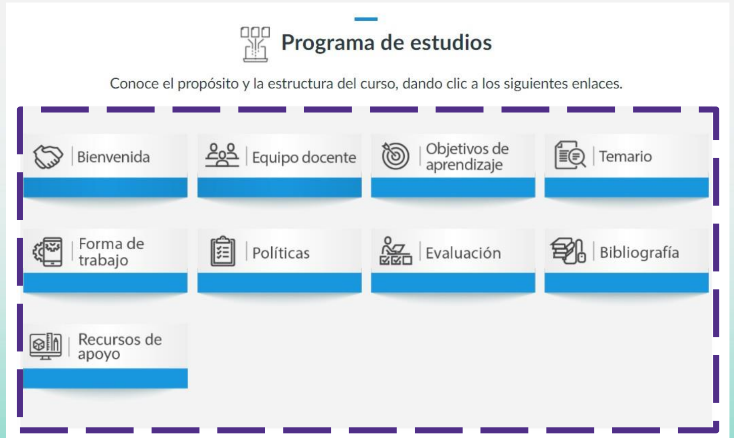
Imagen para fines ilustrativos basada en la Plantilla Institucional de Posgrado. En caso de que el curso cuente con otra plantilla, explorar y completar las páginas a las que dirigen los botones correspondientes a los elementos del programa de estudios.