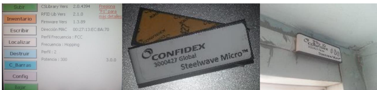
Figura 6. Menú principal de aplicación móvil, etiqueta RFID pasiva y laboratorio etiquetado .

Una vez que la Base de datos de la aplicación Web se encuentra actualizada se continua a escribir dentro de las etiquetas RFID (sólo se escribe en una etiqueta un identificador único que exista en la Base de datos móvil), el tipo de etiqueta RFID en la que se escribe es una pasiva Confidex Steelwave Micro mostrada en la Figura 6 especial para leerse en medios ambientes con ruido de señales emitidas por dispositivos electrónicos. Para escribir se hace uso de la dos aplicaciones, en la aplicación Web se consulta el identificador que se escribirá en la etiqueta y en la aplicación móvil por medio de radiofrecuencia se escribe en un banco de memoria.