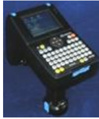
Figura 1. Lector RFID Handheld CS101-2.