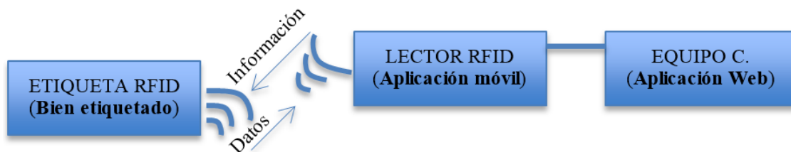
Figura 2. Estructura básica de un sistema RFID.

Es un sistema inalámbrico que por medio de señales de radiofrecuencia transmite información a etiquetas RFID, para identificarlas, localizarlas y rastrearlas, concretamente un sistema RFID está compuesto por tres elementos: por mínimo 1) una etiqueta RFID, 2) un lector RFID y 3) un sistema de administración ( middleware ) que controla toda la información sobre los objetos etiquetados (Zhao & Ng, 2012) (Zanetti, Danev, & Capkun, 2010) (Wang, Li, Daneshmand, Sohraby, & Jana , 2011) (Tecnotic, 2014) (Somasundaram , Khandavilli, & Sampalli, 2010). En la Figura 2 se muestra la estructura básica de un sistema RFID.