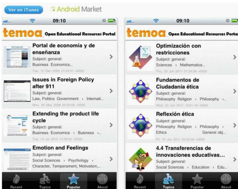
Figura 7. Servicio de TEMOA en dispositivos móviles (Temoa, 2011b; 2011c)

El nuevo ecosistema digital ofrece a las personas acceso a la información en situaciones reales que demandan movilidad, así como la capacidad de contar con la posibilidad de su procesamiento y aprovechamiento para consulta, referencia y aplicación. La capacidad de consultar manuales, procedimientos, instrucciones, dirección o asesoría en tiempo real posibilita un aprendizaje situacional, contextual y ubicuo.