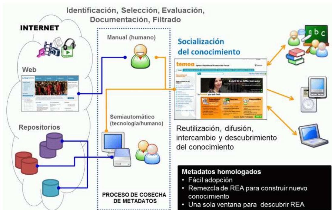
Figura 3. Esquema de operación del catálogo de TEMOA

El catálogo de REA permite que los visitantes (usuarios) realicen búsquedas por aproximaciones sucesivas (gracias a los metadatos que describen los REA) a través de fichas electrónicas descriptivas, permitiendo una serie de acciones que se representan en servicios de información. El catálogo documenta fichas de información que refieren a recursos en distintas áreas de conocimiento considerando el esquema de "Interface y Clasificación Jerárquica LC", HILCC (Davis, 2006; HILCC, 2008), de la Universidad de Columbia" y publicados en varios formatos de entrega que se agrupan en distintos tipos de recursos de aprendizaje. En la figura 4 se pueden apreciar los resultados de una búsqueda de información por medio de la clasificación jerárquica de conocimiento aplicada en el catálogo y tras haber organizado los REA identificados bajo el esquema del HILCC.