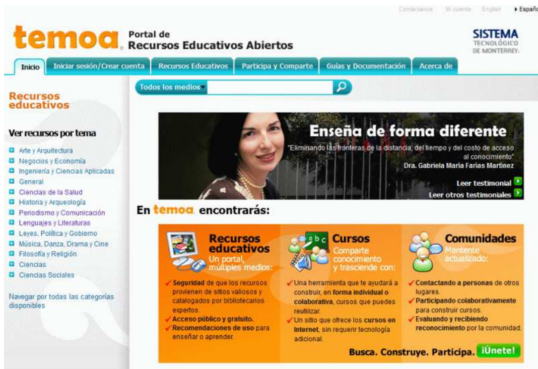
Figura 2. Catálogo de recursos educativos abiertos TEMOA

Inicialmente el catálogo fue llamado como “ Knowledge Hub ” (Burgos, 2008; Mortera, Escamilla, 2008) y posteriormente se le dio identidad propia y se le nombró como “temoa”. El servicio de información representa una iniciativa educativa del Instituto Tecnológico y de Estudios Superiores de Monterrey, ITESM (conocido como Tecnológico de Monterrey), institución de educación superior de México que ofrece un sistema multicampus universitario creado por la sociedad civil y perteneciente a ella sin fines de lucro, conformado por 31 campus en México y una Universidad Virtual que permite su posicionamiento a nivel internacional a través de programas educativos de alta calidad para México, Latinoamérica y el resto del mundo (ITESM, 2011).