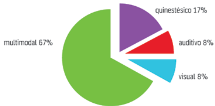
Figura 1. Inventario de estilos de aprendizaje herramienta VARK

De acuerdo con el planteamiento del problema, los objetivos planteados y los resultados obtenidos en la pre-