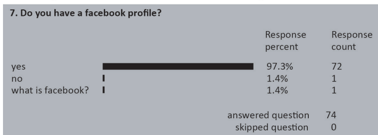
Figura 4. Resultados acerca de contar o no con un perfil en Facebook.

Las conversaciones se transcribieron textualmente; es importante que permanezcan de esta forma y en el idioma meta del curso (inglés), ya que queda evidenciado que, a pesar de tener algunos errores gramaticales, se logra la comunicación e interacción en inglés. Asimismo, se colocan de manera textual los signos utilizados por los alumnos como parte de las herramientas culturales que manejan.