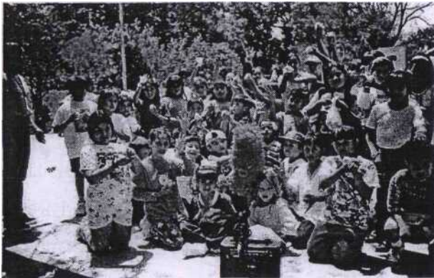
Ahora los niños del DIF Estatal de Tamaulipas también se beneficiarán con las actividades del Programa PADI

Formar personas comprometidas con el desarrollo de su comunidad y fomentar el desarrollo integral