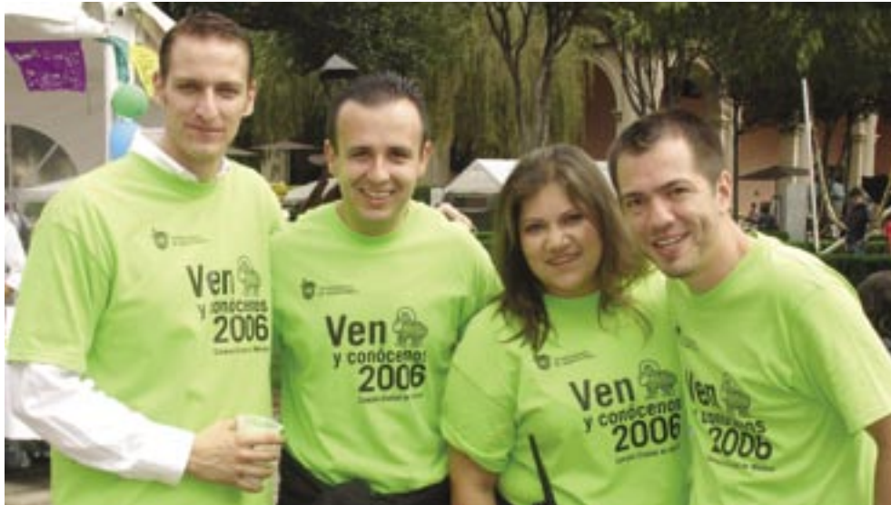
>Comité organizador del Ven y conócenos

Durante tres días de eventos consecutivos, los alumnos y padres de familia se mostraron contentos por la importancia que el Tecnológico de Monterrey les da a sus futuros alumnos.