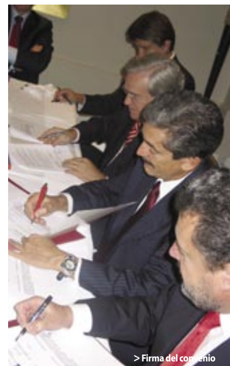
> Firma del convenio

Hotel Four Seasons de la Ciudad de México, el pasado 25 de octubre. Al finalizar la firma del convenio, las personalidades asistentes se tomaron la foto del recuerdo, departieron e intercambiaron comentarios con alumnos y exalumnos emprendedores del Tecnológico de Monterrey procedentes de los campus que la institución tiene en el Valle de México.