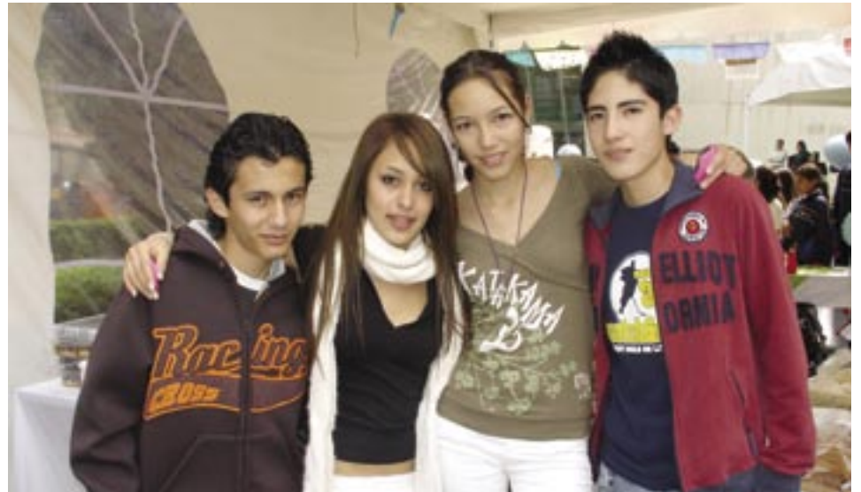
>Alumnos de la Escuela Continental.