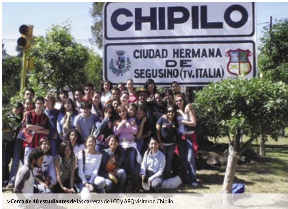
>Cerca de 40 estudiantes de las carreras de LCC y ARQ visitaron Chipilo

Aproximadamente 40 alumnos de los campus Ciudad de México y Querétaro viajaron a Chipilo, Puebla, para estudiar los diversos lenguajes que han permitido conservar la memoria de los inmigrantes veneto radicados en ese lugar