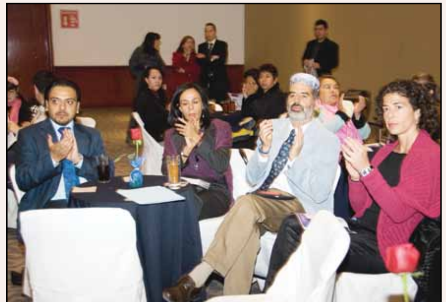
>Claustro de profesores de la Escuela de Humanidades