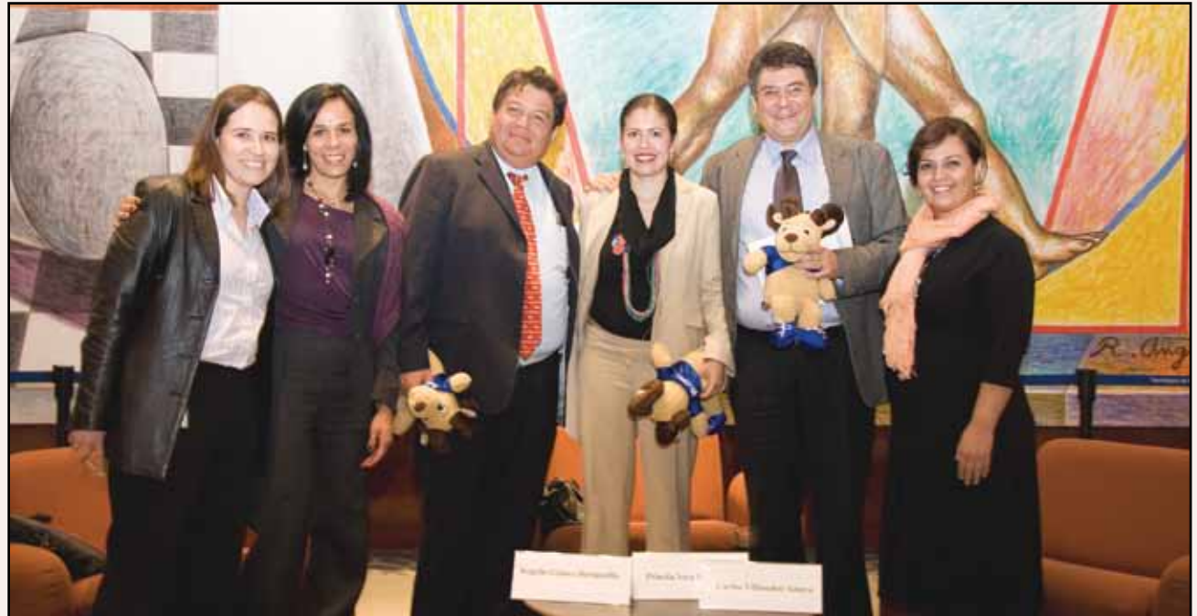
>Los invitados resaltaron la importancia de la nueva licenciatura en el ámbito laboral

Dentro del plan de estudio de la Licenciatura en Emprendimiento Cultural y Social, se encuentran materias relacionadas con cultura, sociología, filosofía social, cuidado del medio ambiente, psicología social, políticas públicas, visión económica, relaciones internacionales y turismo alternativo. También se refuerzan las habilidades de relaciones humanas, conocimientos de