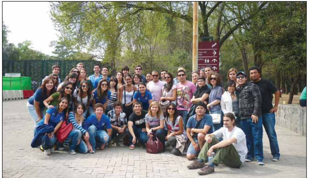
&gt;Alumnos de intercambio