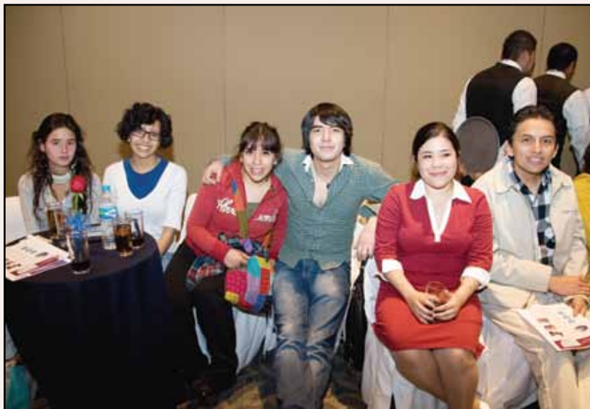
>Alumnos de la Licenciatura en Humanidades y Ciencias Sociales

“México tiene la mayor cantidad de jóvenes en su historia moderna, tres de cada 10 mexicanos que se encuentran entre los 12 y los 29 años de edad. Ésta es la pluralidad que le da al país la posibilidad de crecer económicamente, tenemos la aprovecharlo o dejar que se convierta en una pesadilla demográfica”, sentenció.