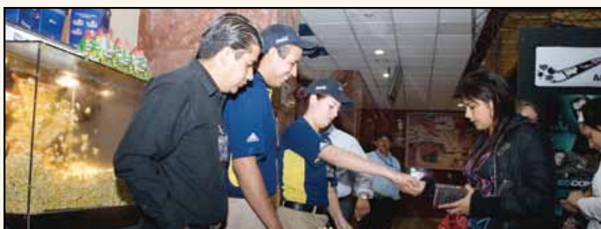
>Cinépolis estuvo a cargo de la dulcería