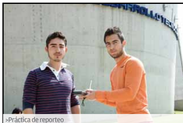
>Práctica de reporteo