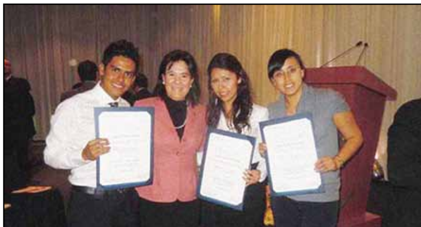
>Ganadores del Campus Ciudad de México

Asimismo, dos alumnos del Tecnológico de Monterrey Campus Estado de México quedaron también dentro de los primeros 10 lugares, con lo que la Rectoría de la Zona Metropolitana de la Ciudad de México obtuvo, en total, seis de los 10 reconocimientos.