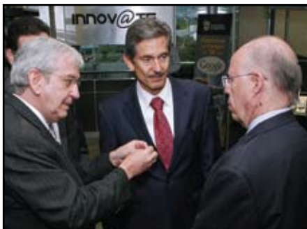
>Con el Dr. José Narro