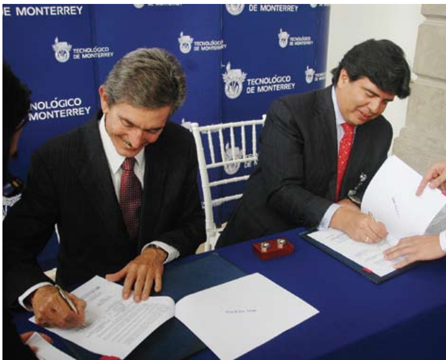
>El convenio fortalece la relación entre IBM y el Tecnológico de Monterrey como aliados para el desarrollo educativo del país