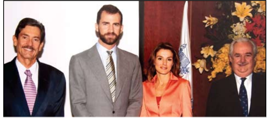
>Con los príncipes de España, Felipe de Borbón y Leticia Ortiz