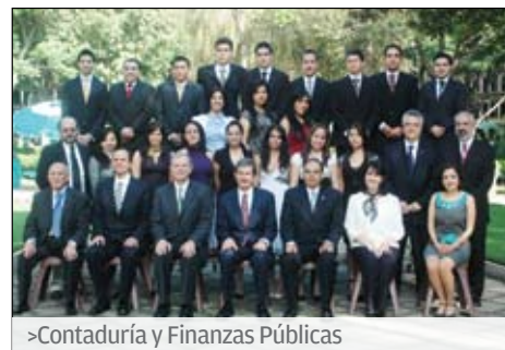
>Contaduría y Finanzas Públicas