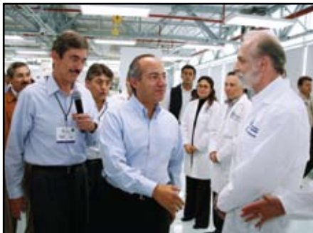
>Con el Presidente Felipe Calderón Hinojosa