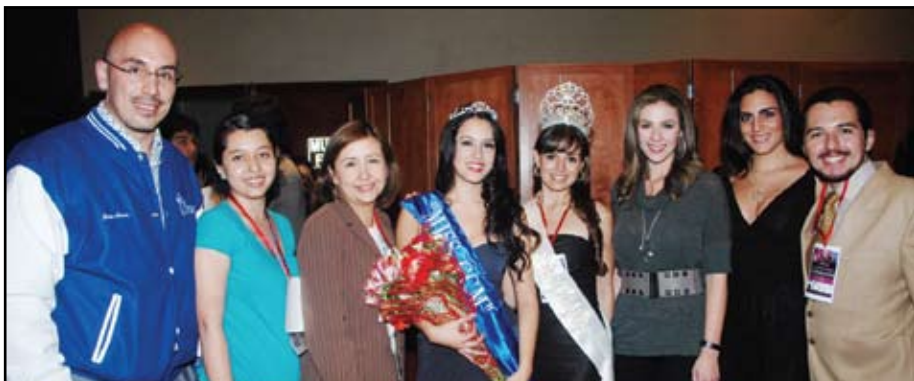
&gt;Los integrantes del Jurado, Miss CCM y la Reina del CEM