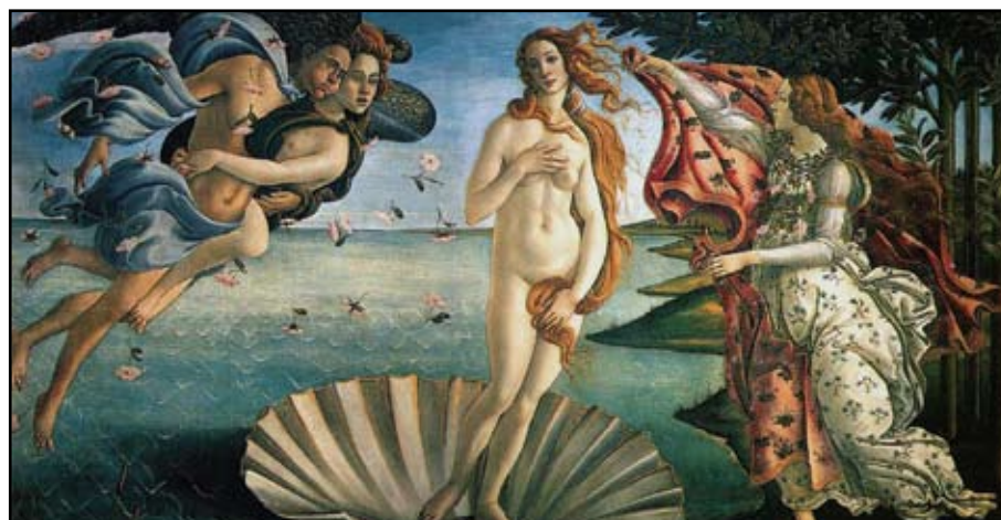
> El nacimiento de Venus, de Boticelli.

La belleza para los griegos se refería a la simetría y a la proporción que proveían las matemáticas a los estudios que hacían: esto para ellos era atractivo. Lo que quiero concluir de aquí es que normalmente no