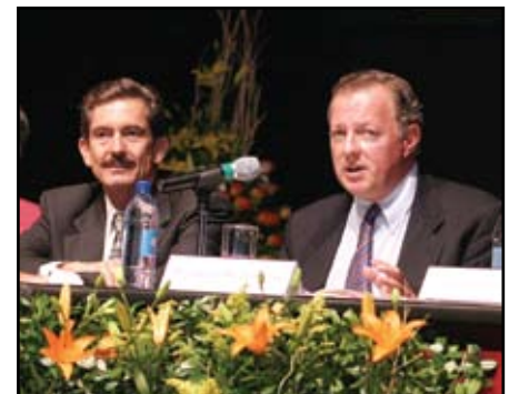
>Con Jesús Reyes Heróles