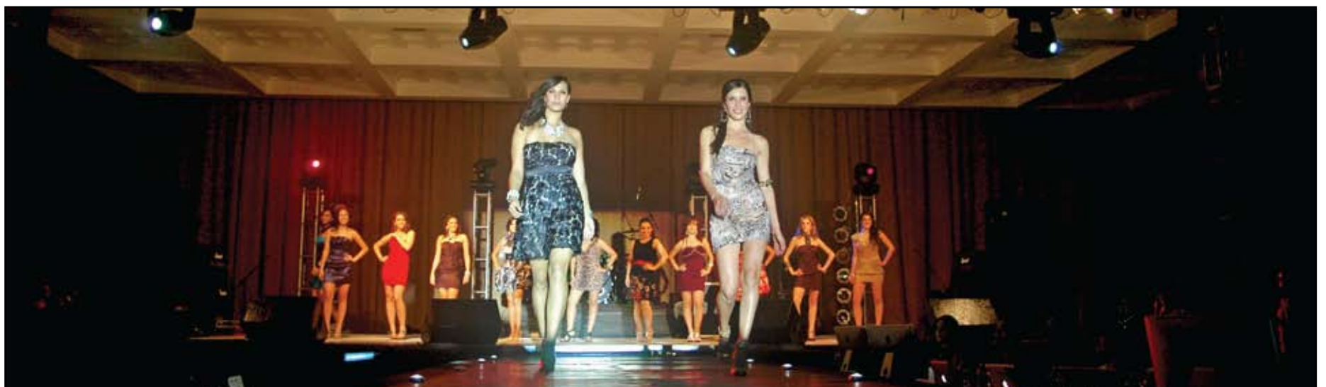
>El concurso llenó a su máxima capacidad el Salón de Congresos con un ambiente de entusiasmo y apoyo

"Me gustaría comenzar a trabajar, tenemos que hacer un buen plan de trabajo y empezar cuanto antes para que las propuestas se lleven a cabo. Vamos también a rescatar propuestas de mis otras compañeras y si alguien tiene alguna más no duden en decírnos", concluyó.