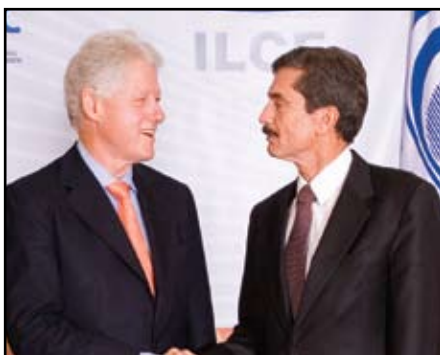
>Con el ex Presidente Bill Clinton