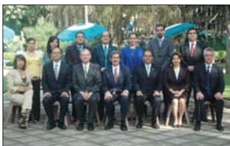
>Primer generación de LAC