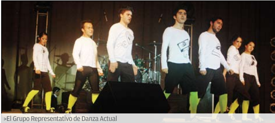
&gt;El Grupo Representativo de Danza Actual