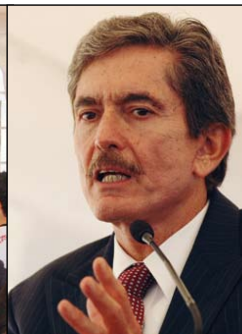
>El Parque Tecnológico se enfocará a la incubación y aceleración de empresas que impulsen el desarrollo del país