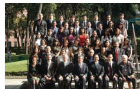
>Ciencias de la Comunicación