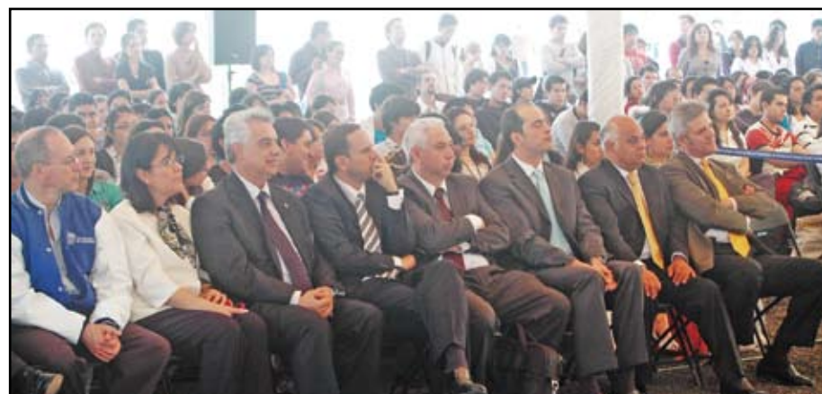
>La comunidad del campus presenció el inicio del Parque Tecnológico