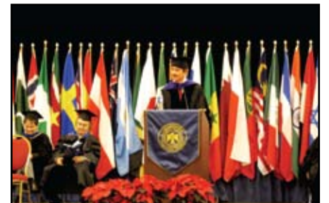
>Recibiendo el doctorado Honoris Causa de la Thunderbird School of Global Management