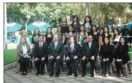
>Primer generación de LNB