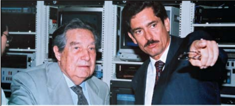
>Con el escritor y poeta, Octavio Paz