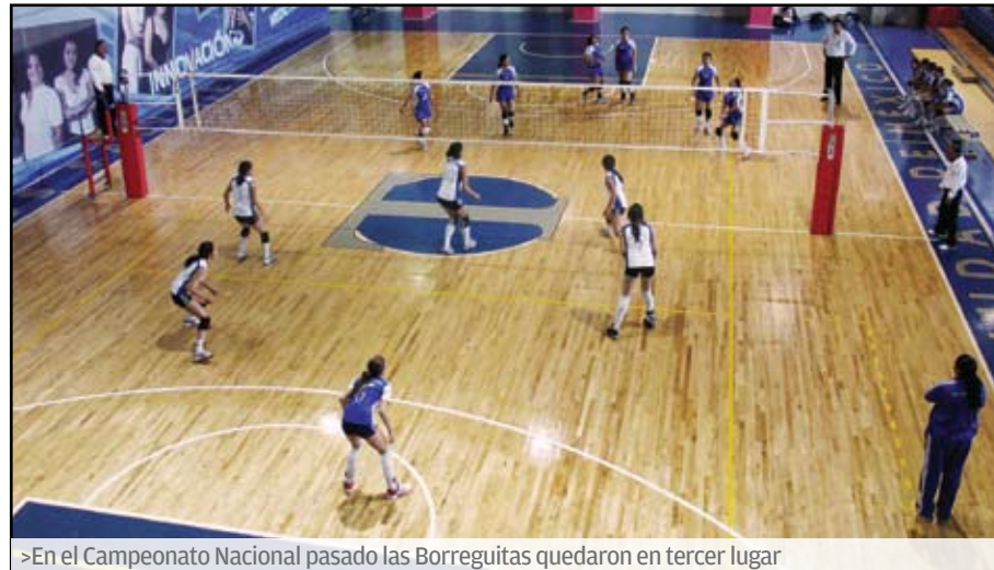
>En el Campeonato Nacional pasado las Borreguitas quedaron en tercer lugar

Tras 45 minutos de juego, la balanza finalmente se inclinó a favor del Campus Ciudad de México, cuando tras un tapón de