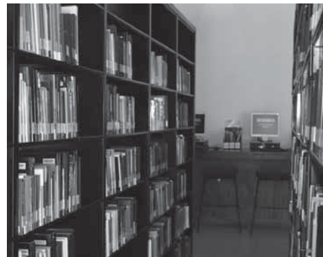
>Los alumnos de la EGAP Gobierno y Política Pública, cuentan con libros especializados.

Anteriormente, las Bibliotecas y la FIL, han sido acreditadas en diversos aspectos, como el académico, por otras instancias internacionales. “Para FIMPES, para ABET, para SACS, para NAAB y el Institute of Food Technology, la Biblioteca tiene que hacer un informe para continuar con sus acreditaciones. También tenemos acreditación por parte del Banco Mundial, la Chemical Abstracts Service y el INEGI, lo que también garantiza el trabajo en el que buscamos la satisfacción del usuario”, dijo el ingeniero Arreola.