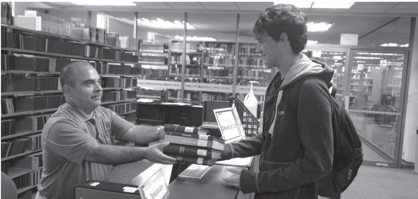
>La certificación otorgada por ABS Quality Evaluation, representa para la Comunidad Tec el contar con servicios de calidad y mejores colecciones bibliográficas.