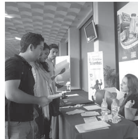
>Los “Días De”, organizados por el CVC, vinculan a los alumnos con empresas de renombre.

“Triunfar y tener éxito no es una cuestión ni de forma, ni de garantía ni etiqueta, sino que debes tener pasión en lo que haces, estrategia para vender tu idea y arriesgarte”, aconsejó.