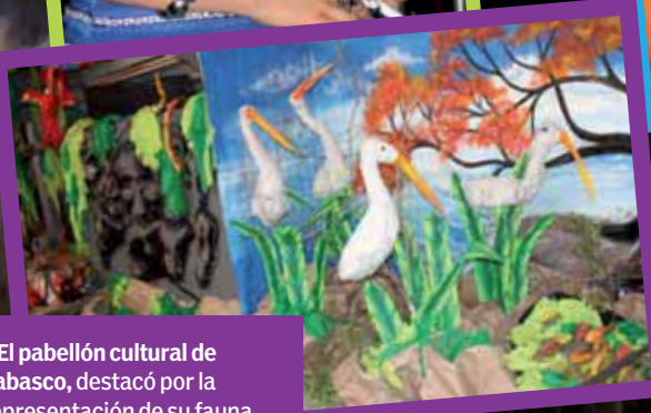
>El pabellón cultural de Tabasco, destacó por la representación de su fauna.