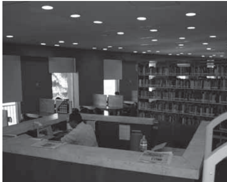
>La Biblioteca de la EGADE Business School, ofrece servicios de calidad a sus usuarios.

“En la Dirección de Biblioteca estamos comprometidos con nuestros usuarios para satisfacer plenamente sus requerimientos de información, ofreciéndoles servicios y recursos, conforme al Sistema de Gestión de Calidad, en un proceso de mejora continua. Es nuestra responsabilidad cumplir con la misión de proveer los recursos y servicios de información en todos los formatos para contribuir al desarrollo académico y de investigación, y promover su uso efectivo de manera óptima. Para asegurar lo anterior, la Política de Calidad es conocida y entendida por todos los miembros de la organización, y