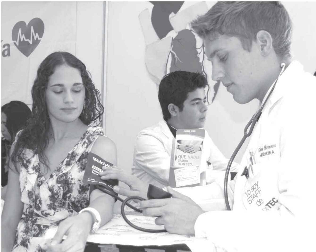
>La realización de chequeos oportunos en diferentes ámbitos de la salud, fueron las labores principales de MEDITEC.