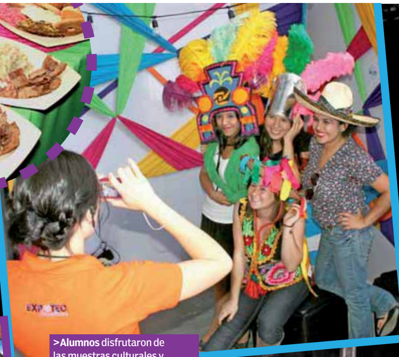
>Alumnos disfrutaron de las muestras culturales y gastronómicas.