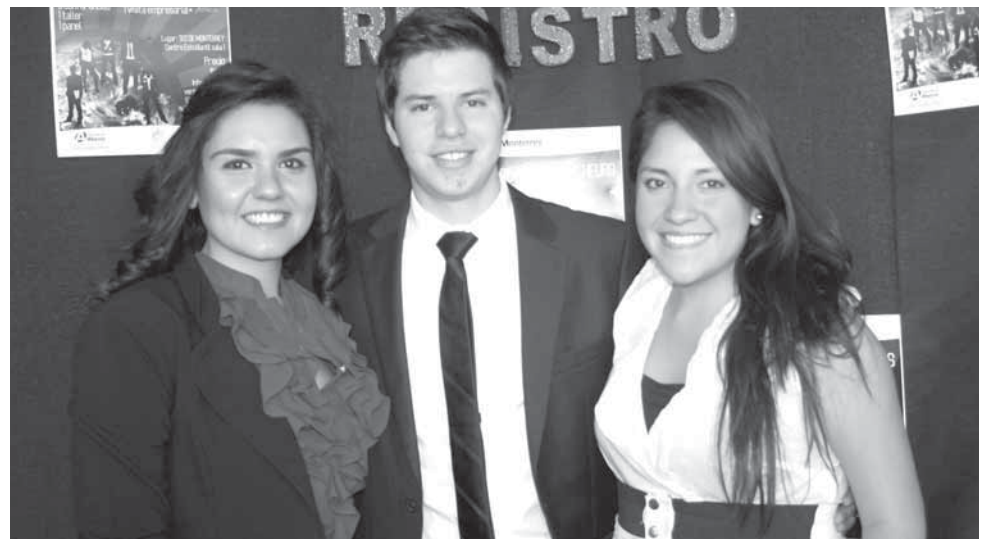
>El XII Foro Global Entrepreneurs Born To be a Global fue organizado por miembros de la SALIN.

“Hubo otros factores que tuvimos que analizar, por ejemplo el nombre del producto tenía significados ofensivos de acuerdo al país donde estábamos, por lo que tuvimos que cambiarlo, dar una porción mayor de carne en comparación a otros países, respetando el estándar de la Unión Europea y como en ese continente las mujeres trabajan en una proporción similar al hombre y tienen menos hijos, tuvimos que hacer el producto en paquetes de menor cantidad”, indicó.