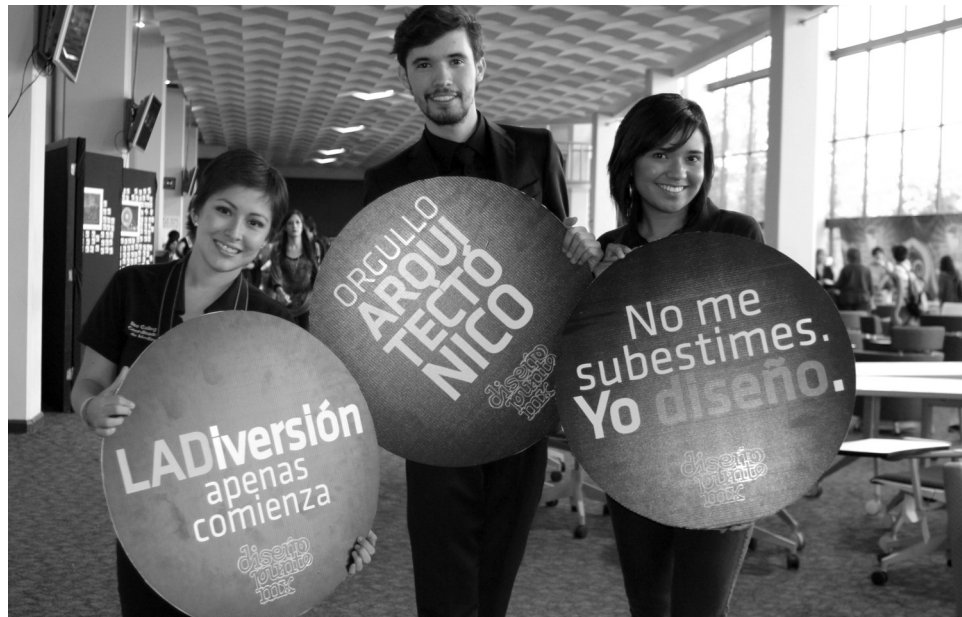
>Diseño punto mx es organizado por más de 100 alumnos de las carreras de LAD, ARQ y LDI.

"Para nosotros es más que lógico, tenemos algo en común que nos une como Escuela y creo que es la razón por la cual todos estamos aquí, nos apasiona el diseño", dijo.