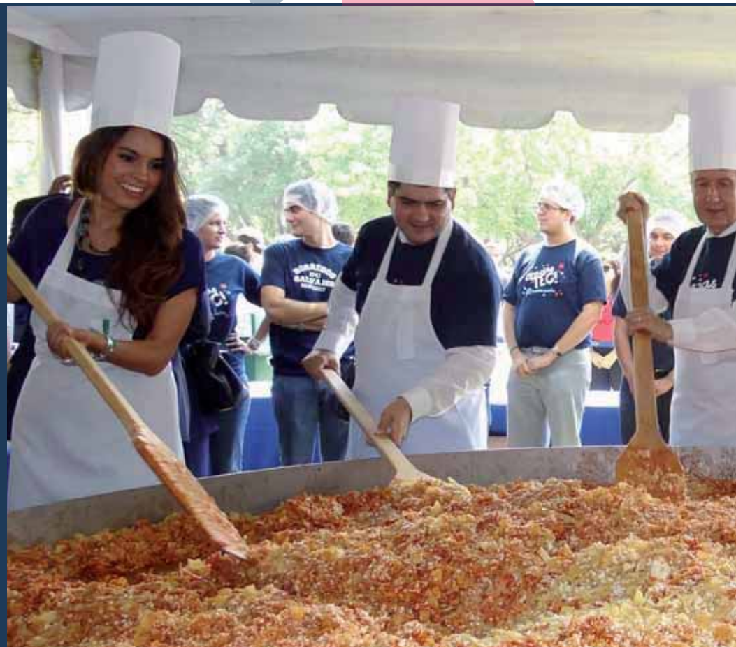
> Directivos y alumnos ocuparon un turno para preparar los chilaquiles.

Posteriormente, se realizó la preparación de las 2 mil órdenes de los tradicionales chilaquiles y se repartió el pastel por parte de autoridades y alumnos del comité organizador, para los asistentes que disfrutaron de la convivencia.