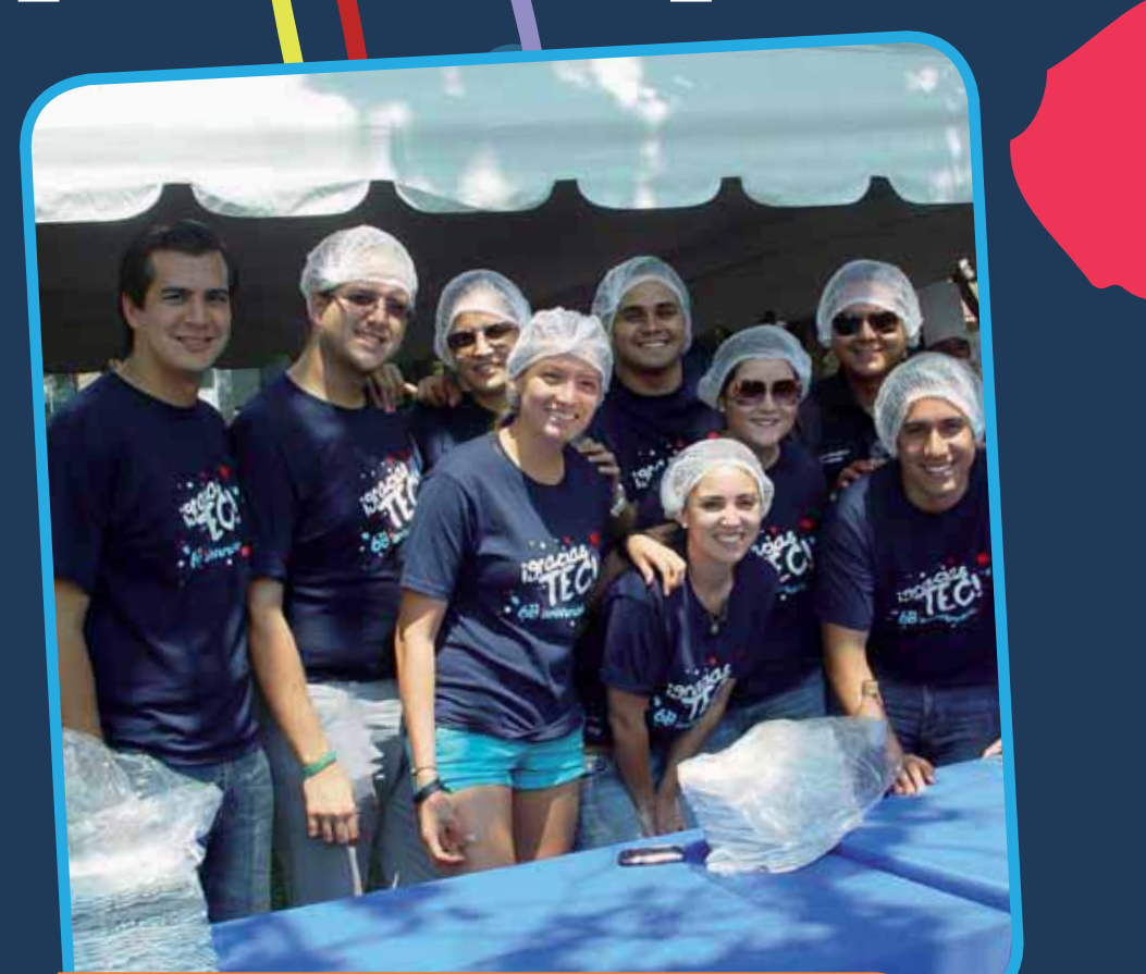
> Alumnos del comité organizador estuvieron al pendiente de todos los detalles del festejo, para que los asistentes disfrutaran el evento.

Revive el festejo en video: http://www.reportec.com.mx