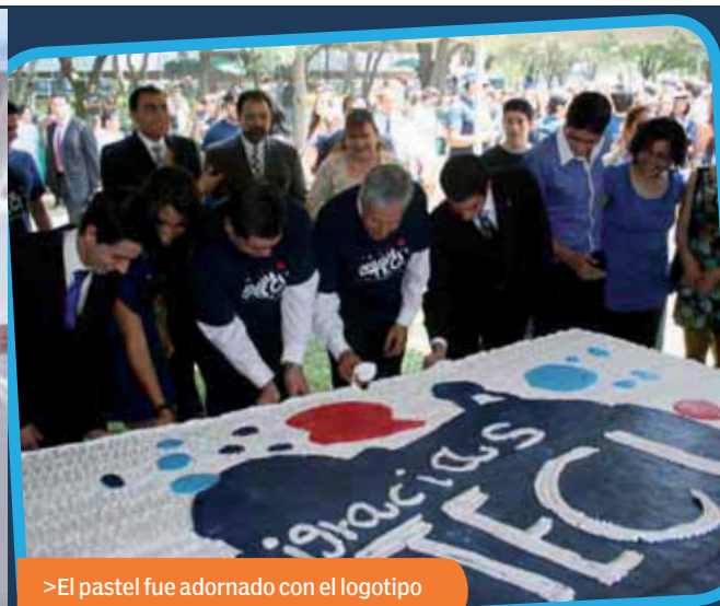
>El pastel fue adornado con el logotipo del 68 aniversario.

2,000 ASISTENTES APROXIMADAMENTE A LA CEREMONIA DE FESTEJO