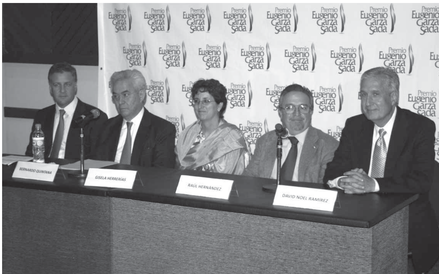
> Los ganadores del Premio Eugenio Garza Sada ofrecieron una rueda de prensa para hablar de la visión que los ha hecho sobresalir y ser un referente en la sociedad.