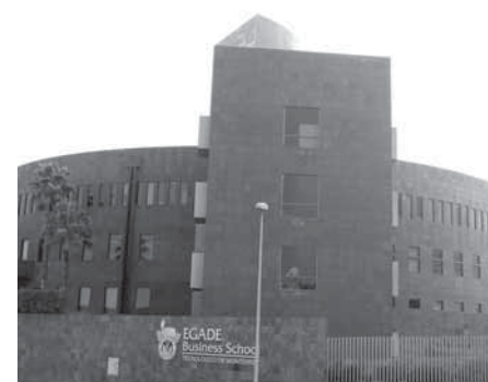
> La EGADE Business School y la Bolsa Mexicana de Valores firman convenio.

“El convenio que hoy formalizamos nos congratula y fortalece, ya que esta alianza permitirá fomentar aún más el conocimiento bursátil, financiero y empresarial mediante el desarrollo de programas y cursos académicos conjuntos, para la formación de emprendedores, líderes innovadores competitivos y socialmente responsables en el contexto nacional e internacional”, aseguró el doctor Luis Téllez, Presidente de la Bolsa Mexicana de Valores.