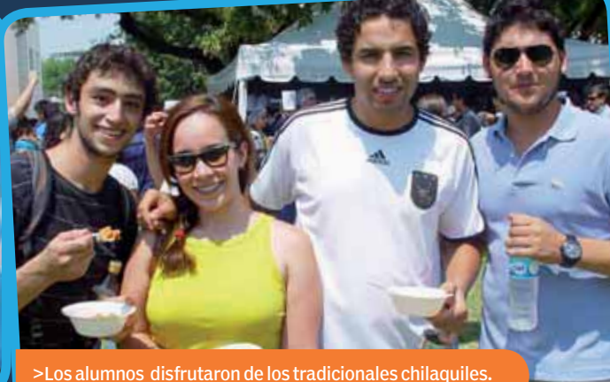
>Los alumnos disfrutaron de los tradicionales chilaquiles.