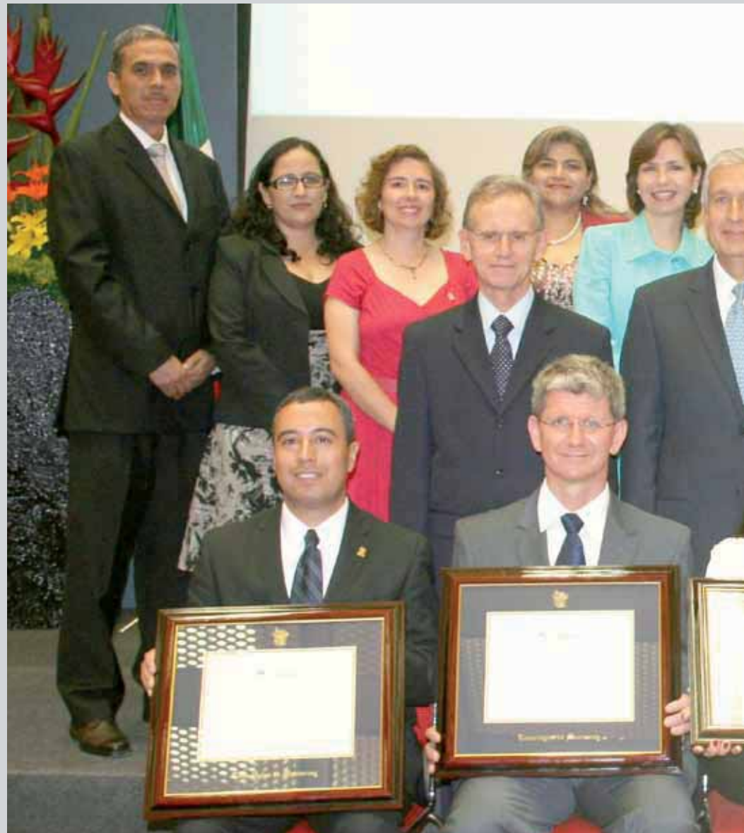
> Los nuevos profesores titulares (quienes muestran su reconocimiento), y los profesores asociados fueron distinguidos en una ceremonia en su honor.

“Una de las características del Tec, fue que