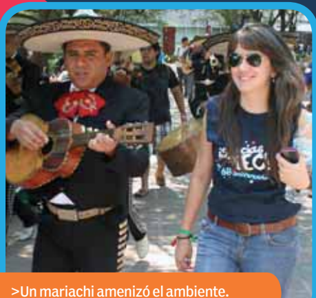
>Un mariachi amenizó el ambiente.