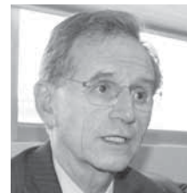
“El Tec de Monterrey ha sido pionero en el uso de la tecnología educativa y por su amplia oferta de programas internacionales”.

“Como todo en la vida, todo cumpleaños viene un gran reto, un gran compromiso de superar lo anterior, se trata de que las nuevas generaciones sean mejores”, concluyó.