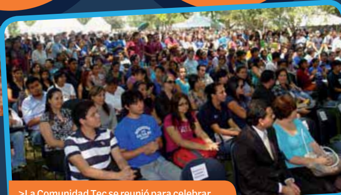
>La Comunidad Tec se reunió para celebrar.