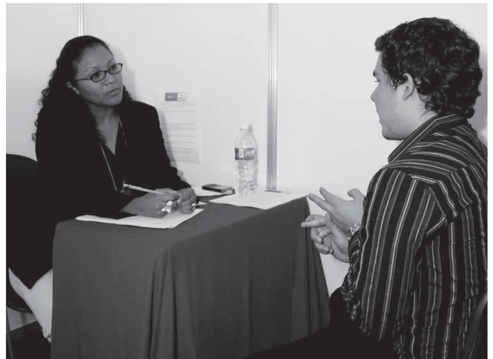
> El próximo Preparatec se realizará los días 13 y 14 de septiembre, en el Centro Estudiantil.

Entre las conferencias que se imparten dentro de Preparatec, se abordan temas como: Plan de Vida y Carrera, Currículum Efectivo, Entrevista de Trabajo, Tips para ratificar la elección de carrera,