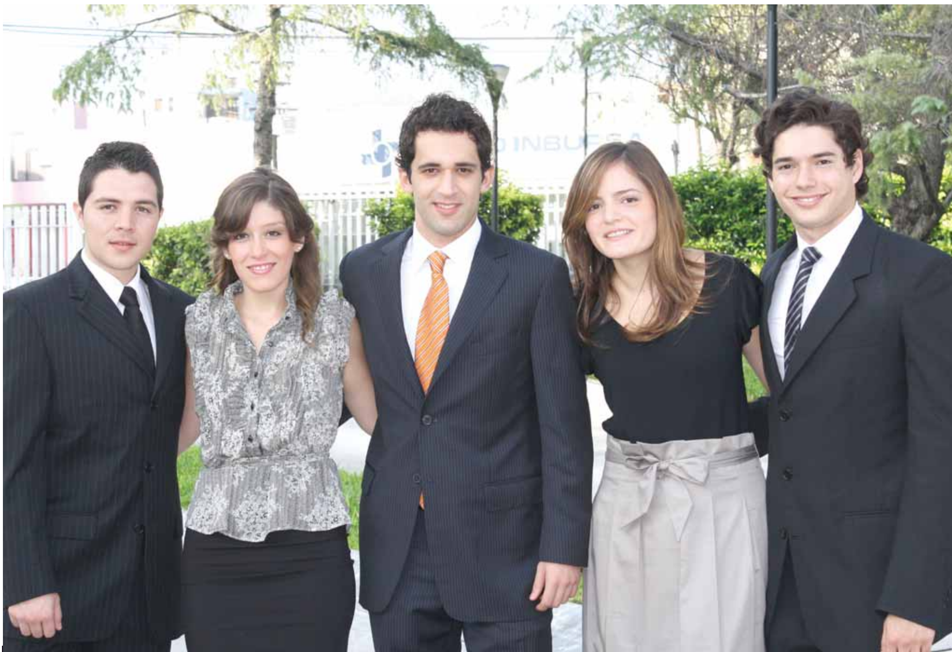
FOTO DE GENERACIÓN

SÁBADO 2 DE OCTUBRE DE 2010, EXPLANADA DE RECTORÍA