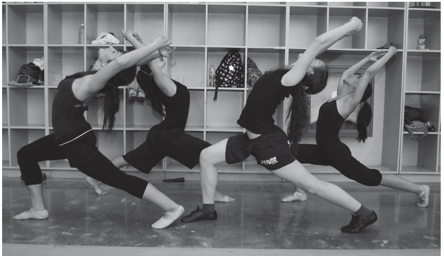
> Las clases de Jazz permiten a los practicantes fortalecer el cuerpo para lograr una buena condición física.

Las funciones serán el viernes 24 y el sábado 25 de septiembre a las 20:30 horas. También el domingo 26 habrá una a las 18:00 horas.