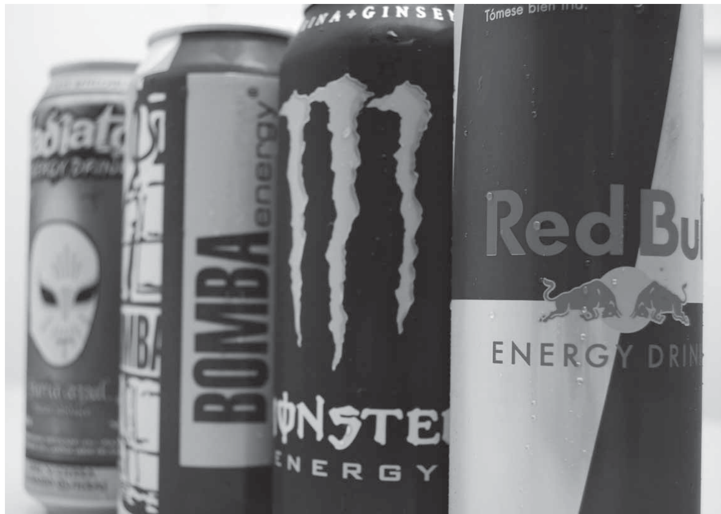
>El consumo de estas bebidas representa un riesgo para la salud, evítalas.