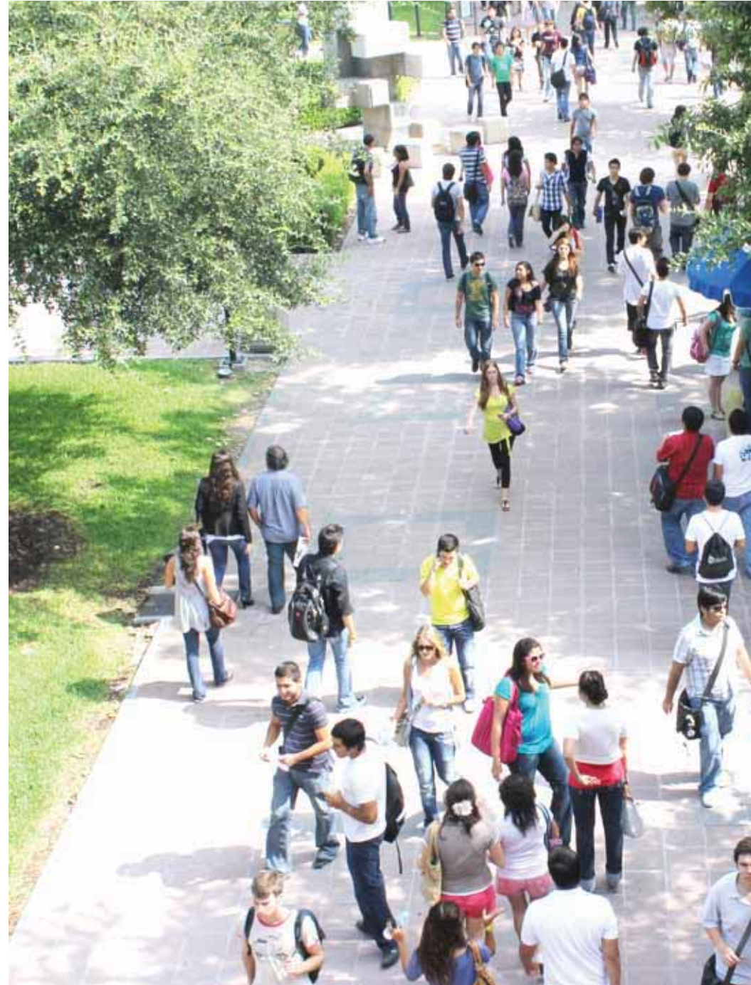
>PANORAMA describe en sus páginas las actividades más importantes impulsadas por todos los miembros de la Com

En 1996, en cuestión gráfica, se añadió color a