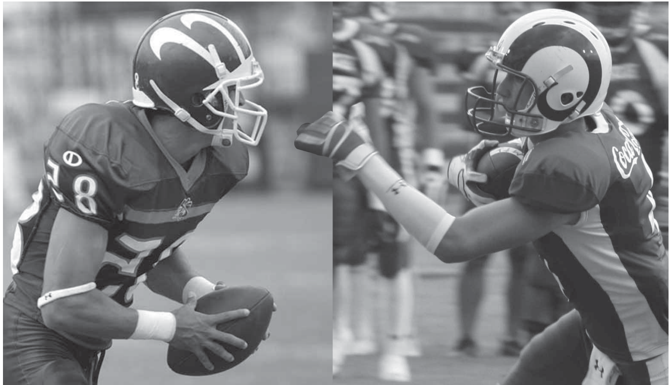
>El partido será el sábado 25 de septiembre a las 16:00 horas en el Estadio Tecnológico.

Las Borreguitas jugarán el viernes 24 de septiembre a las 13:00 horas contra la UPAEP; los Borregos enfrentan a la UPAEP el jueves 23 y el viernes 24 de septiembre a las 19:00 horas; por su parte los Borregos de Tenis participarán del 24 al 27 de septiembre, en la primera etapa del Circuito Nacional, que se jugará en las canchas del Tec Campus Estado de México.