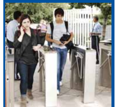
> Los accesos automatizados entrarán en funcionamiento en los próximos días.

Además, este documento de identidad ofrece otros beneficios, por lo que se exhorta a todos los alumnos que no han ido por su nueva identificación a que acudan por ella lo antes posible.